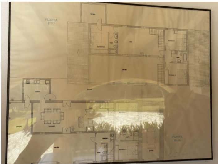
Plano planta baja y primera planta

Toda la información como mejor se puede saber, salvo por error durante el periodo de venta. Sirva este documento como un informe previo, las bases legales solo serán válidas a traves de un contrato de compra acordado ante Notario.