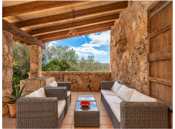
Área de estar