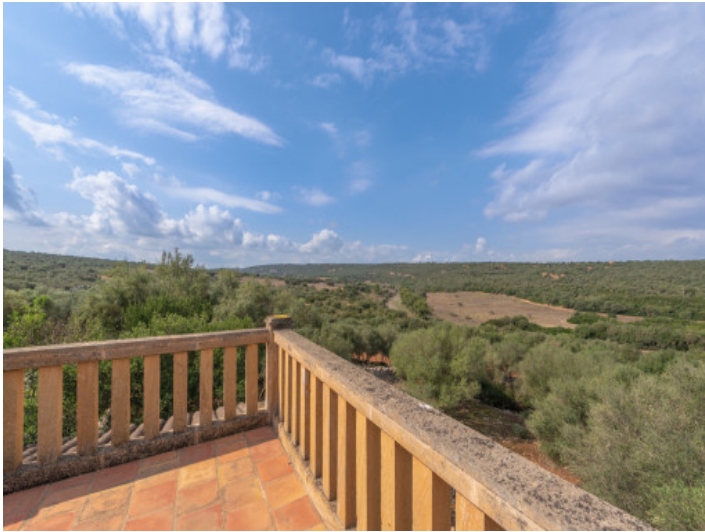
Vista al terreno