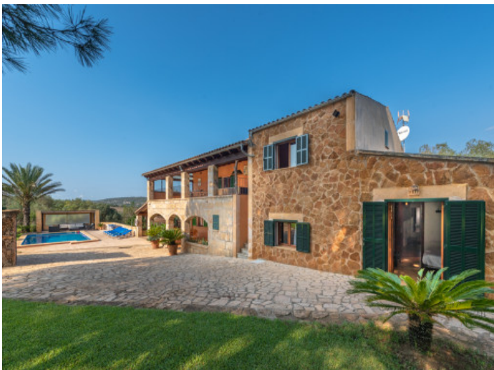
Vista exterior y área de piscina