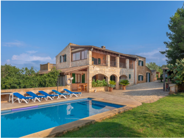
Piscina y finca