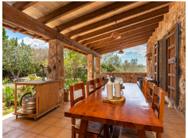
Terraza con comedor