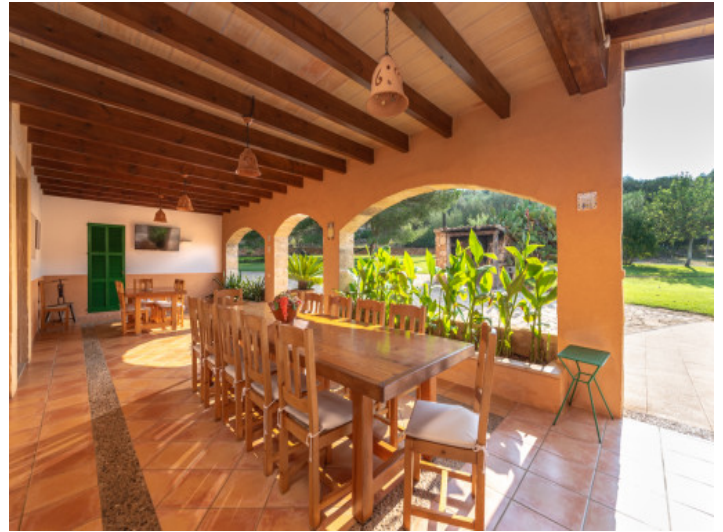
Terraza planta baja