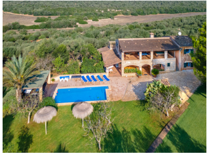
Gran propiedad rodeada de naturaleza cerca de Manacor