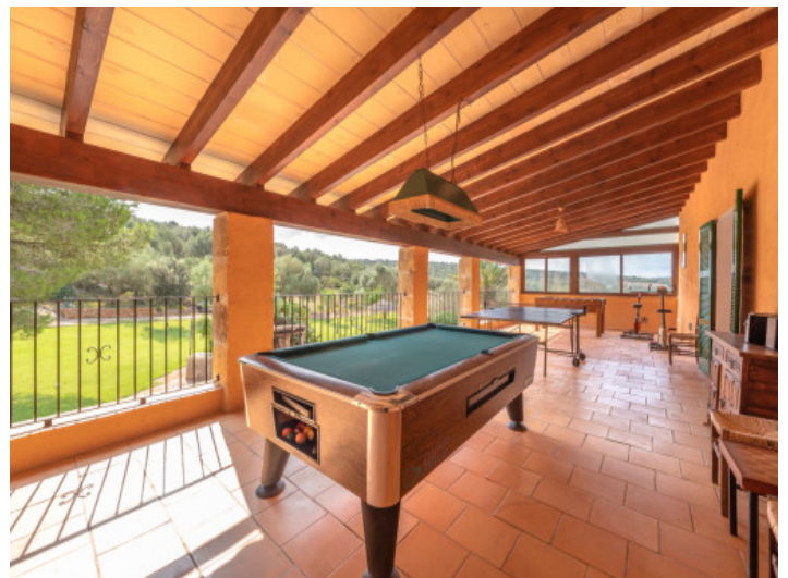
Terraza planta superior

Toda la información como mejor se puede saber, salvo por error durante el periodo de venta. Sirva este documento como un informe previo, las bases legales solo serán válidas a través de un contrato de compra acordado ante Notario.