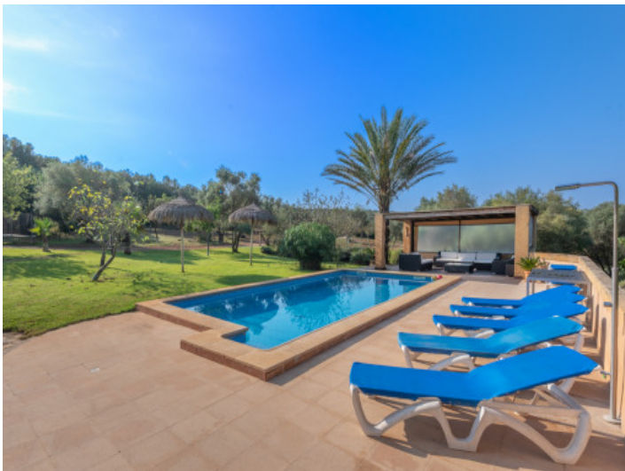
Piscina y jardín