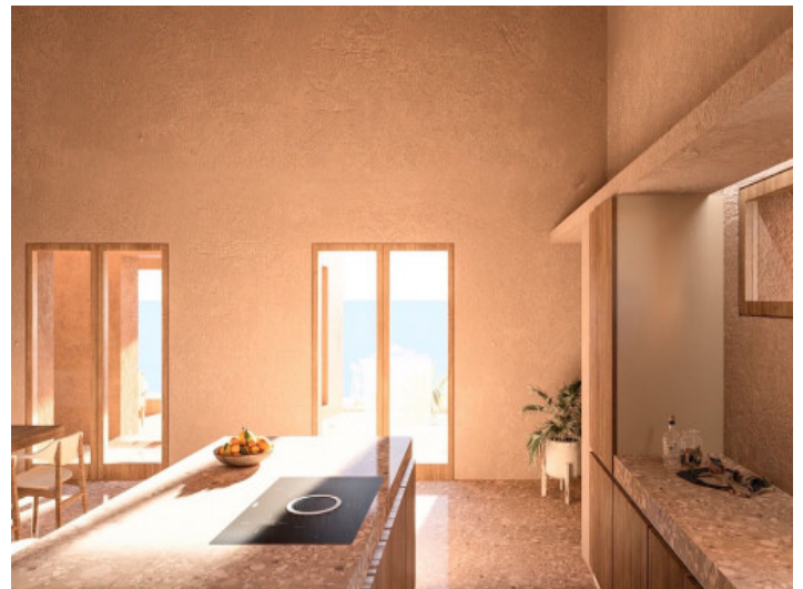
Vista alternativa a la cocina