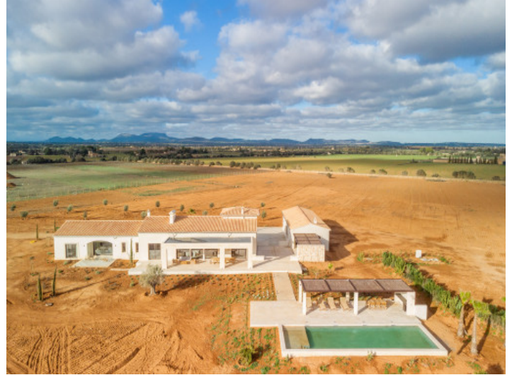
Vista desde arriba

Toda la información como mejor se puede saber, salvo por error durante el periodo de venta. Sirva este documento como un informe previo, las bases legales solo serán válidas a través de un contrato de compra acordado ante Notario.