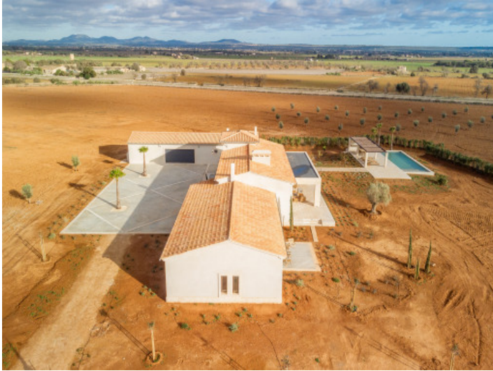
Vista desde arriba