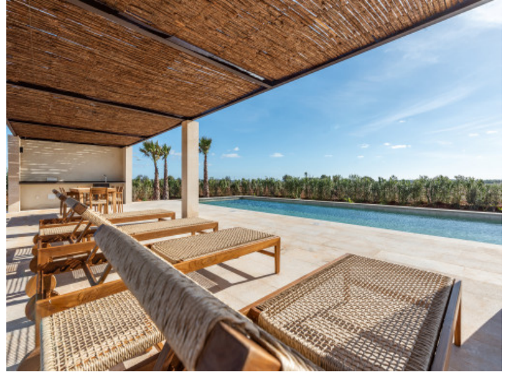
Finca de lujo cerca del Es Trenc