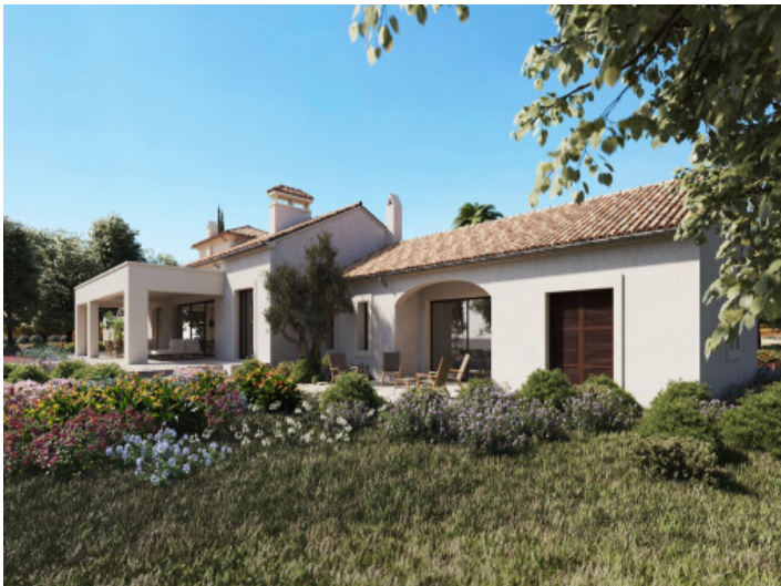
Render del jardín