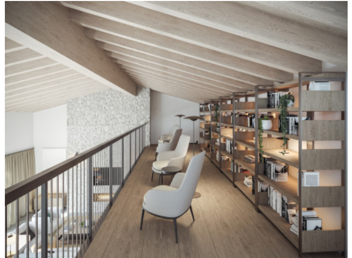
Galería con biblioteca