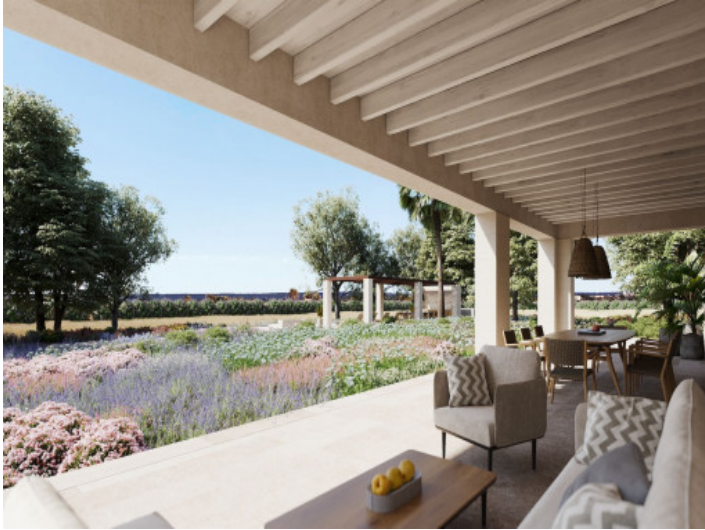
Vista al jardín