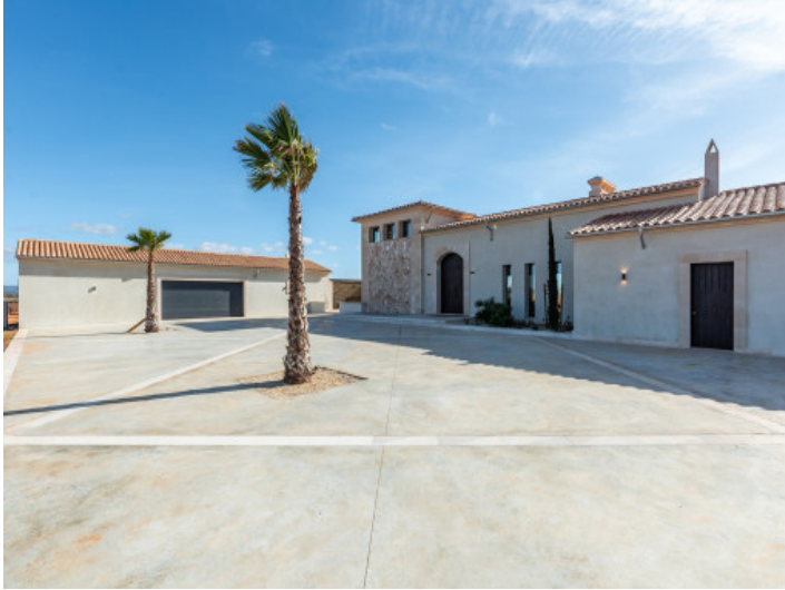
Vista frontal y garage