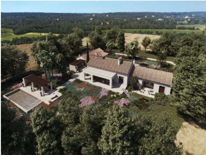
Render de la vista aérea