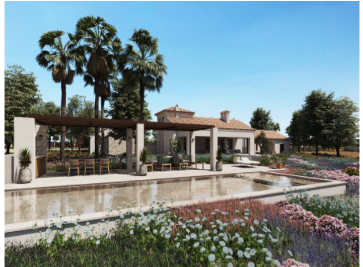
Render de la piscina