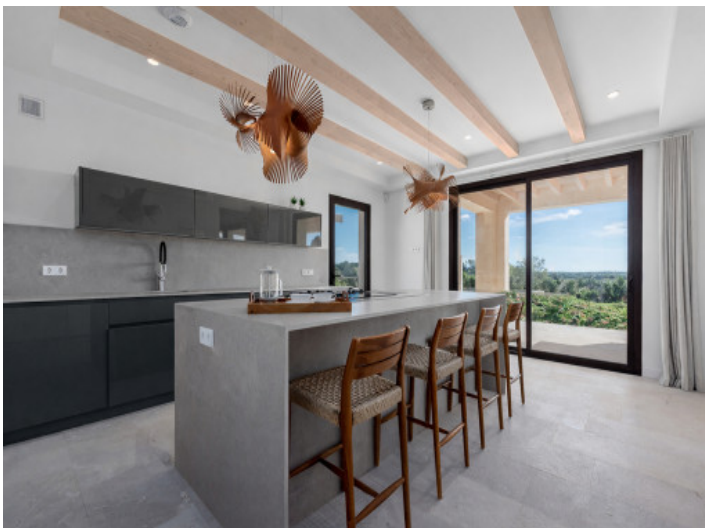
Cocina con isla