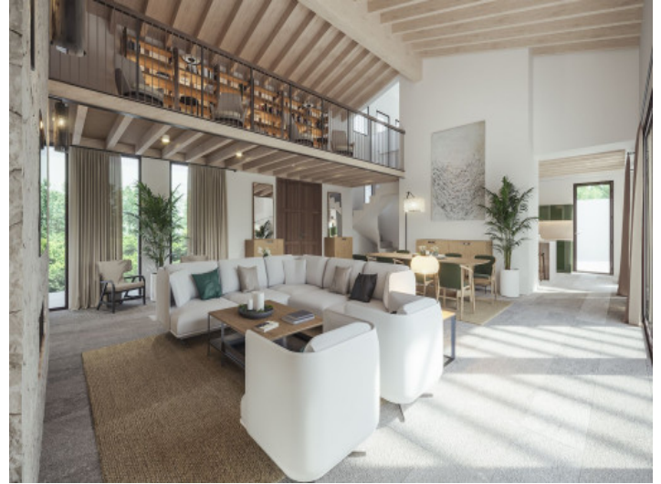
Salón comedor abierto