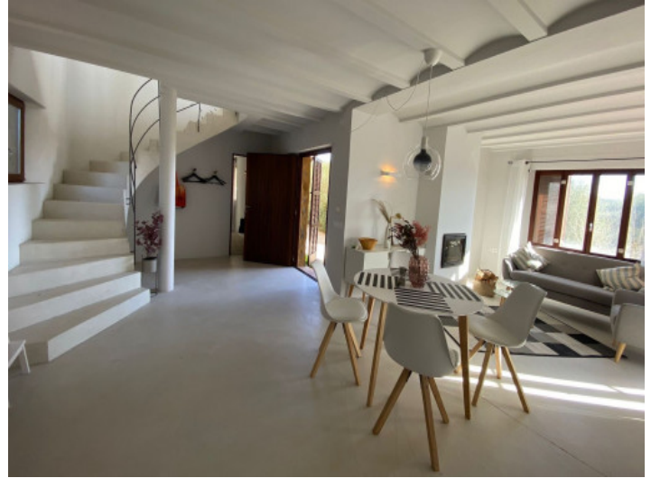
Salón luminoso comedor