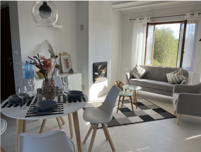
Salón luminoso comedor