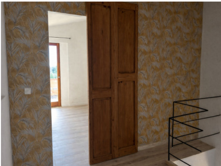
Tercer dormitorio en la planta superior con balcón privado