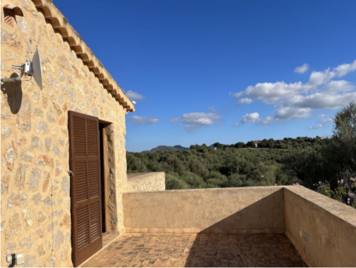
Balcón con una vista