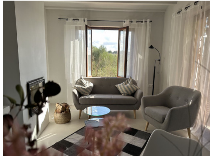
Salón con chimenea