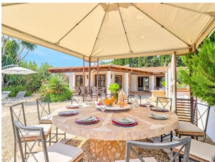
Comedor al aire libre