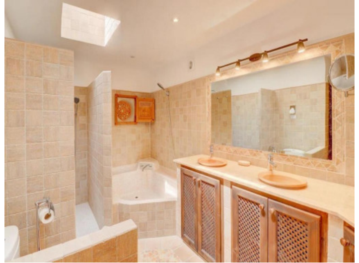
Uno de 5 baños