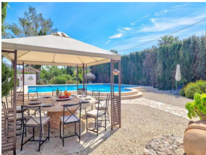
Preciosa zona de piscina