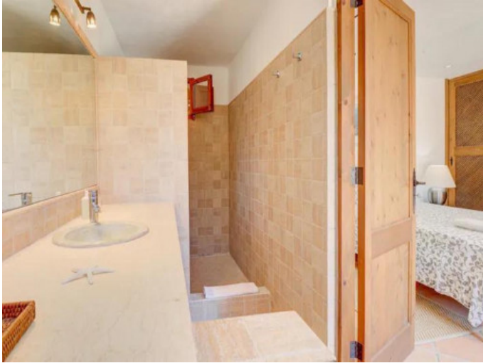
Uno de 5 baños