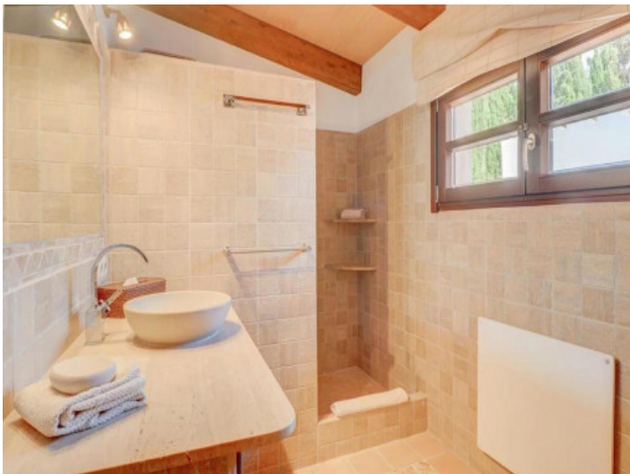
Uno de 5 baños