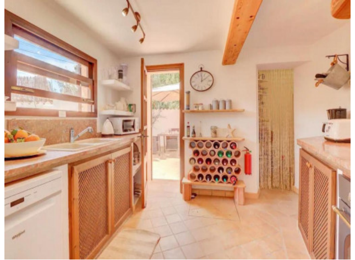
Cocina completamente equipada