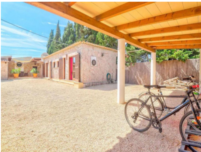
Apartamento de invitados

Toda la información como mejor se puede saber, salvo por error durante el periodo de venta. Sirva este documento como un informe previo, las bases legales solo serán válidas a través de un contrato de compra acordado ante Notario.