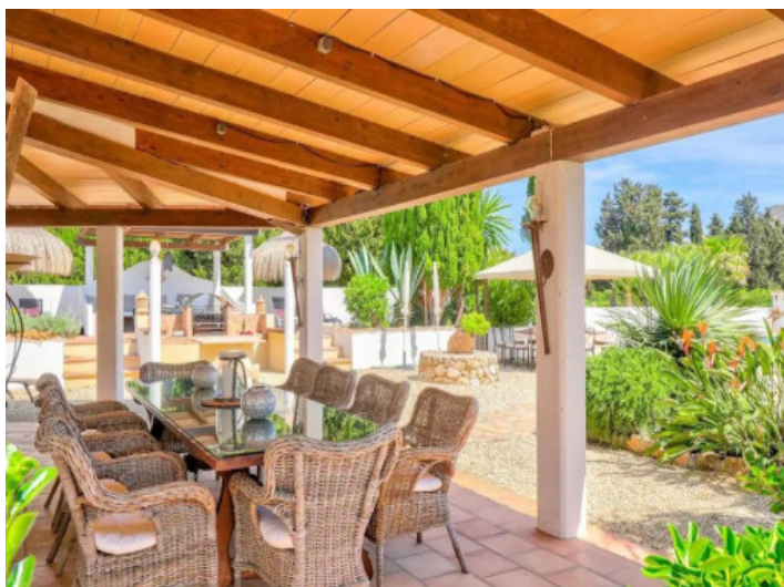
Terraza cubierta con comedor