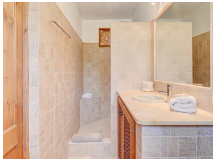
Uno de 5 baños

Toda la información como mejor se puede saber, salvo por error durante el periodo de venta. Sirva este documento como un informe previo, las bases legales solo serán válidas a través de un contrato de compra acordado ante Notario.