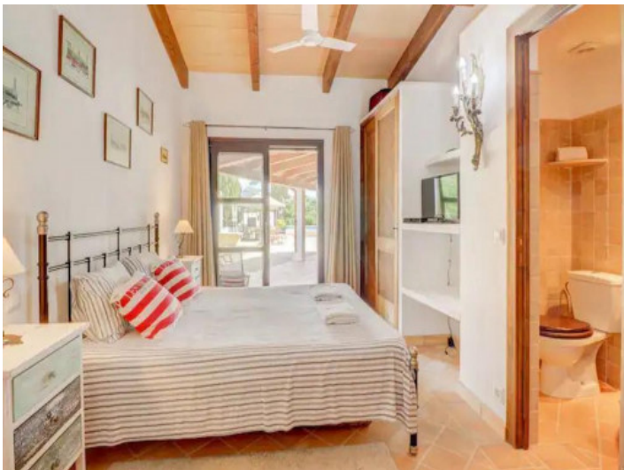
Uno de 5 dormitorios