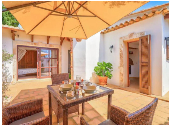
Terraza soleada con asientos