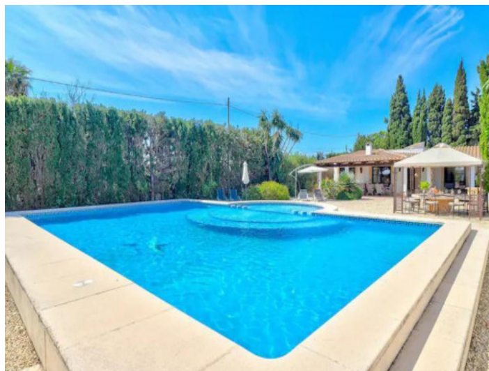
Piscina muy grande