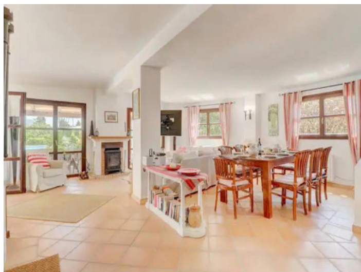
Espacioso salón-comedor con chimenea

Toda la información como mejor se puede saber, salvo por error durante el periodo de venta. Sirva este documento como un informe previo, las bases legales solo serán válidas a través de un contrato de compra acordado ante Notario.