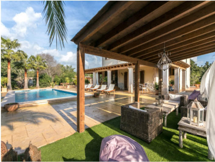
Cómoda zona de relax en el área de piscina