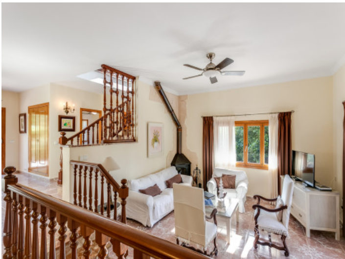
Encantadora área de estar con chimenea