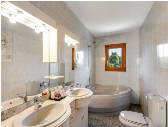
Uno de 3 baños