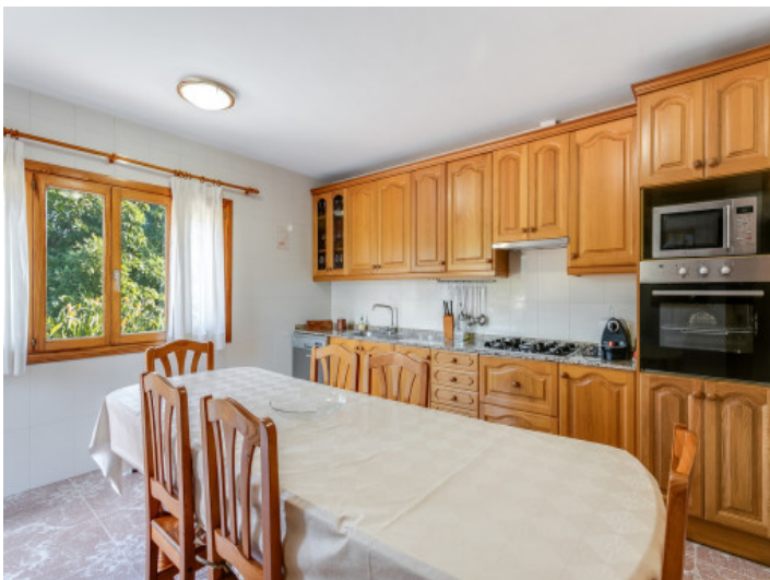
Otro comedor en la cocina