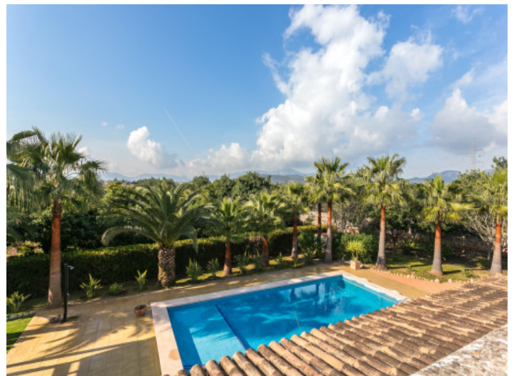
Magníficas vistas a la montaña

Toda la información como mejor se puede saber, salvo por error durante el periodo de venta. Sirva este documento como un informe previo, las bases legales solo serán válidas a través de un contrato de compra acordado ante Notario.