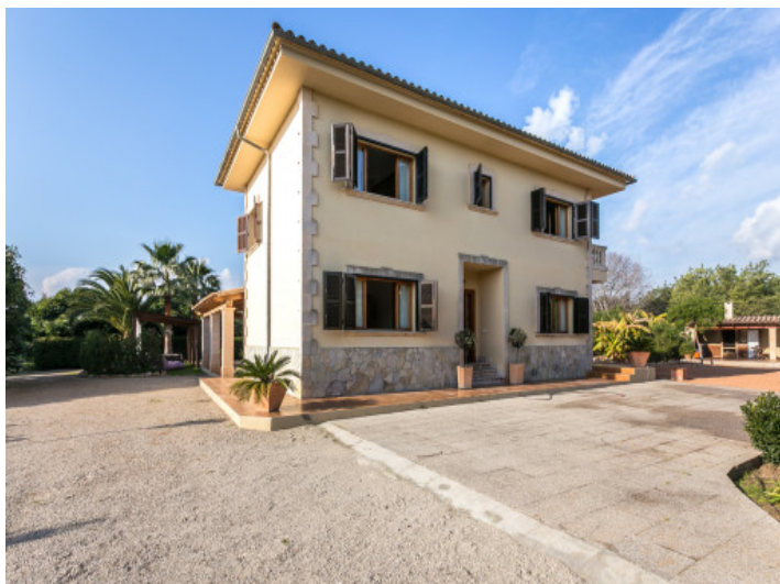
Vista exterior de la finca hermosa