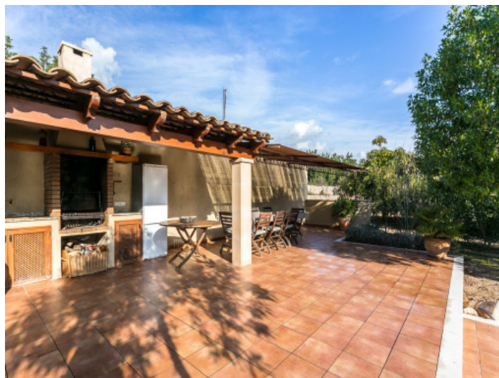
Zona de barbacoa al lado de la piscina