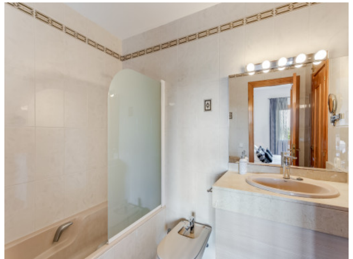
Uno de 3 baños