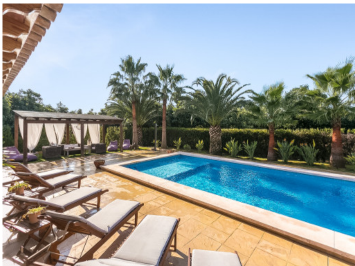
Espaciosa área de piscina soleada