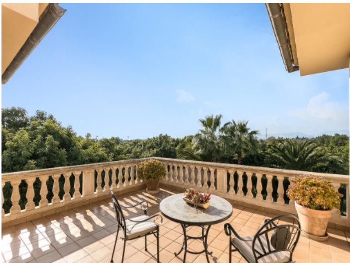
Precioso espacio para sentarse en la terraza superior