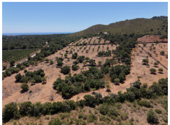
vista al mar

Toda la información como mejor se puede saber, salvo por error durante el periodo de venta. Sirva este documento como un informe previo, las bases legales solo serán validas a traves de un contrato de compra acordado ante Notario.