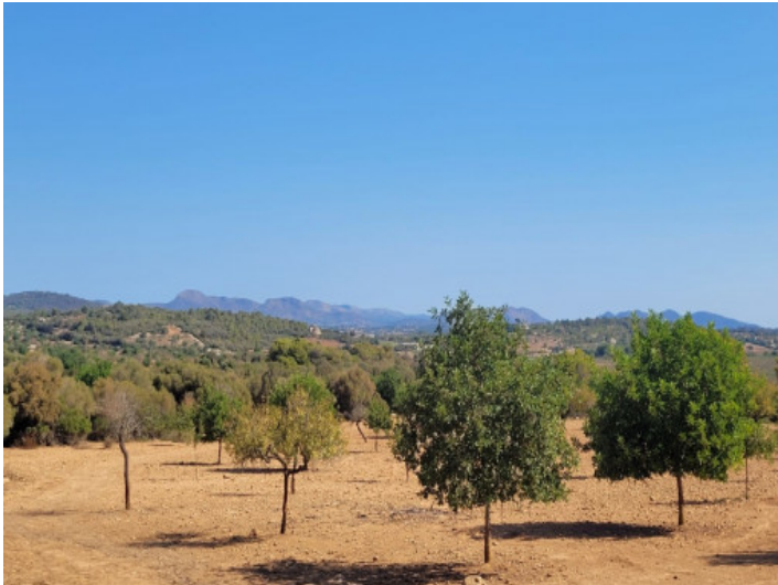
Solar con vistas