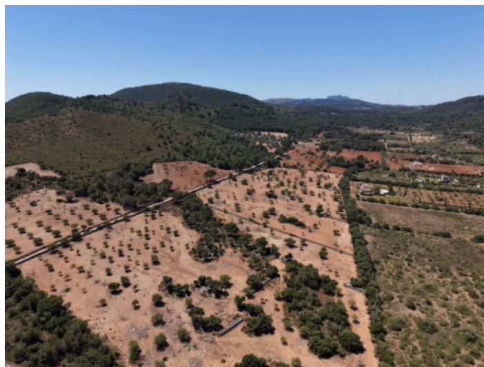
Vista al mar y montaña