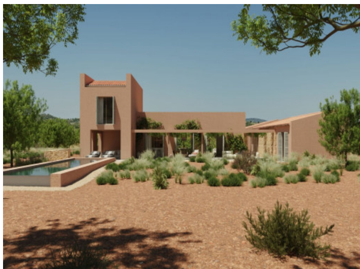
Gran parcela con gran proyecto cerca de Cala Mencia