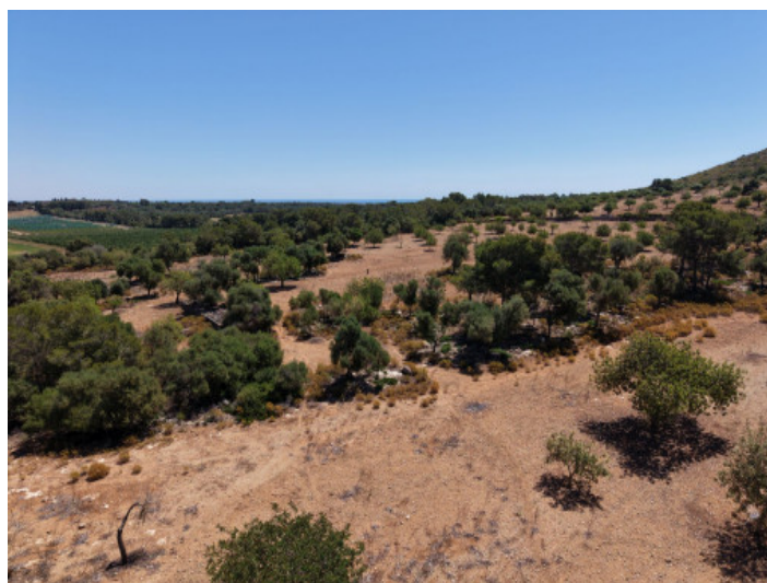
terreno a pie de montaña