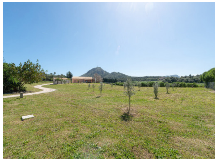
Vista panorámica del terreno con olivos, finca y garaje

Toda la información como mejor se puede saber, salvo por error durante el periodo de venta. Sirva este documento como un informe previo, las bases legales solo serán válidas a través de un contrato de compra acordado ante Notario.