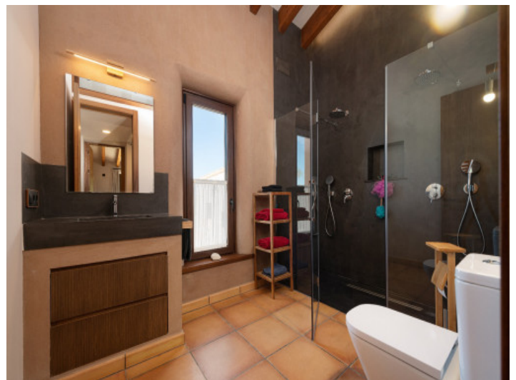
Baño de ducha en suite