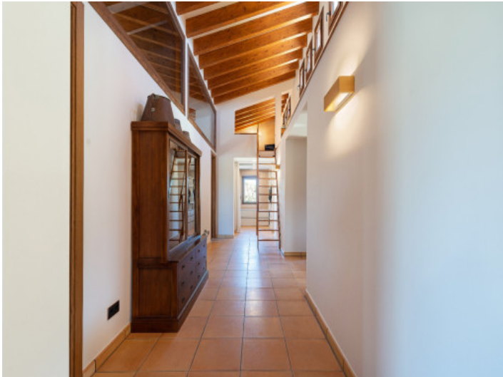
Pasillo luminoso hacia los dormitorios y altillo multifuncional ideal para