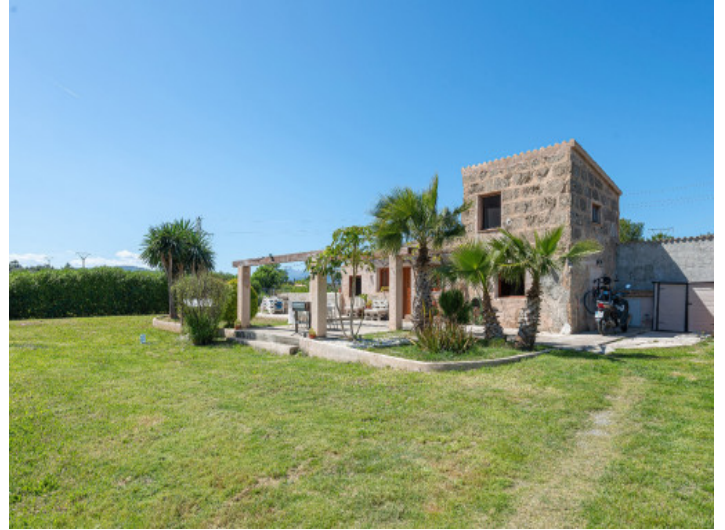
Casa de piedra con alma mallorquina