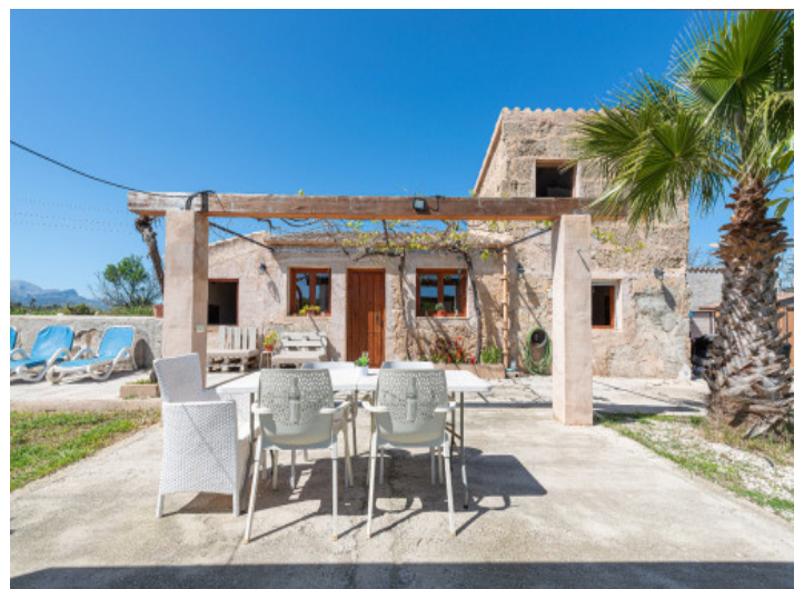
Casa de huéspedes con historia y terraza soleada

Toda la información como mejor se puede saber, salvo por error durante el periodo de venta. Sirva este documento como un informe previo, las bases legales solo serán válidas a través de un contrato de compra acordado ante Notario.