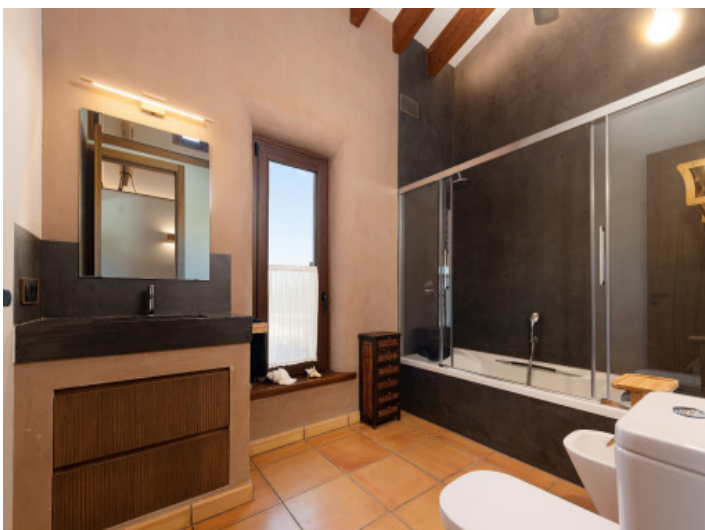
Baño individual separado con bañera