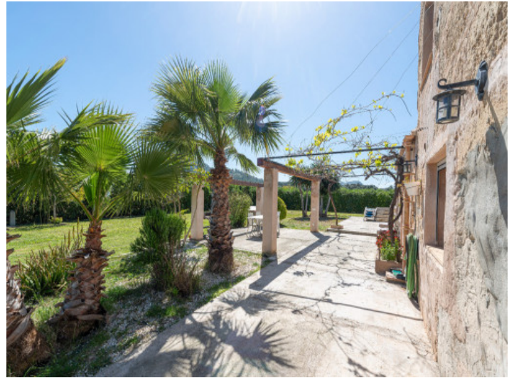
Terraza mediterránea junto a la casa de invitados