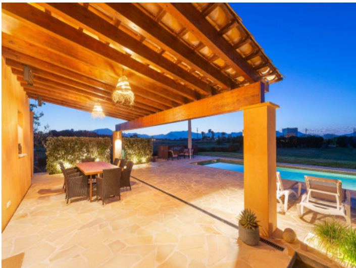
Atardeceres con vistas a la Tramuntana