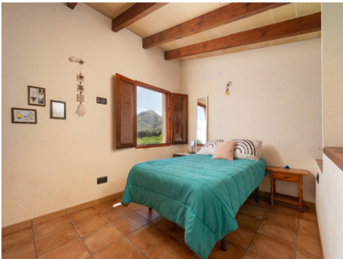
Dormitorio con encanto y vistas a la montaña