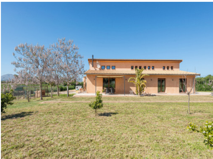
Casa sostenible con vistas y jardín en flor