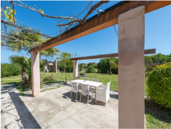
Comedor exterior con pérgola en plena naturaleza