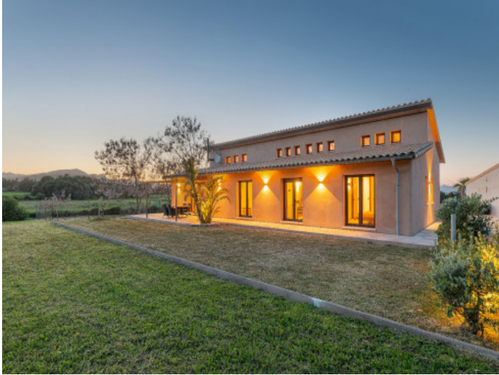
Luz natural y diseño ecológico en armonía