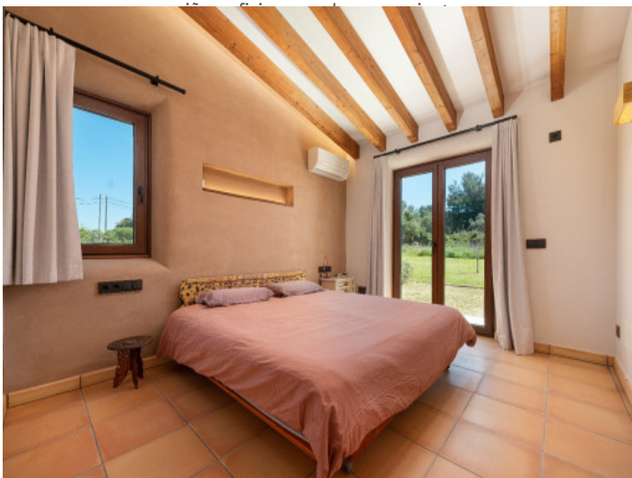
Dormitorio principal con acceso directo al jardín.