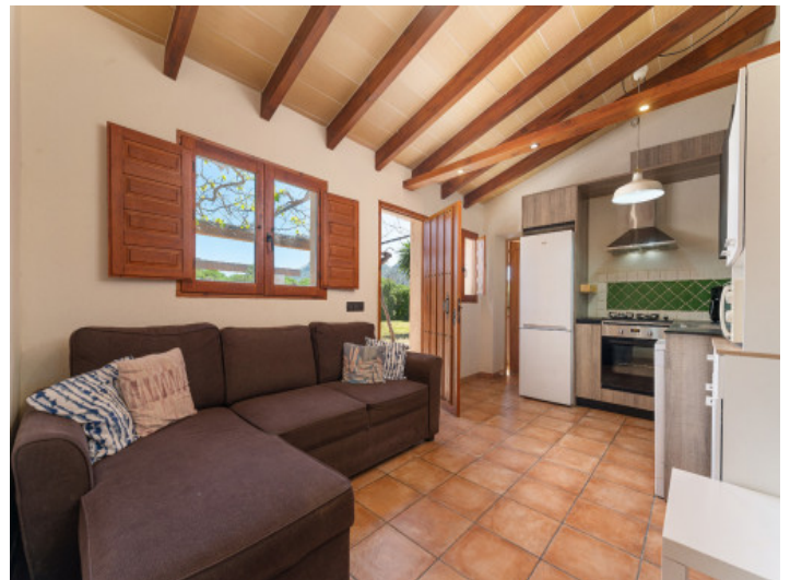
Baño con encanto rústico y vistas al jardín