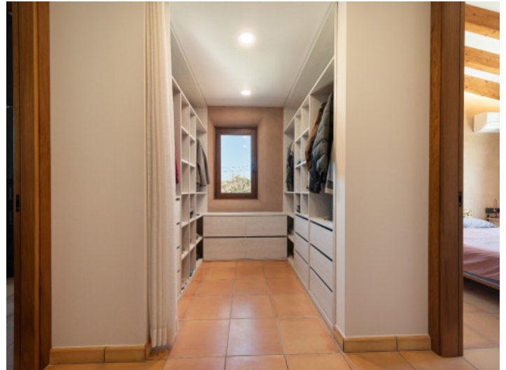
Vestidor amplio y luminoso con ventana al exterior.