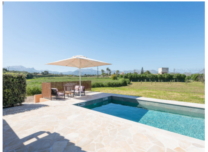
Piscina con vistas a la calma rural