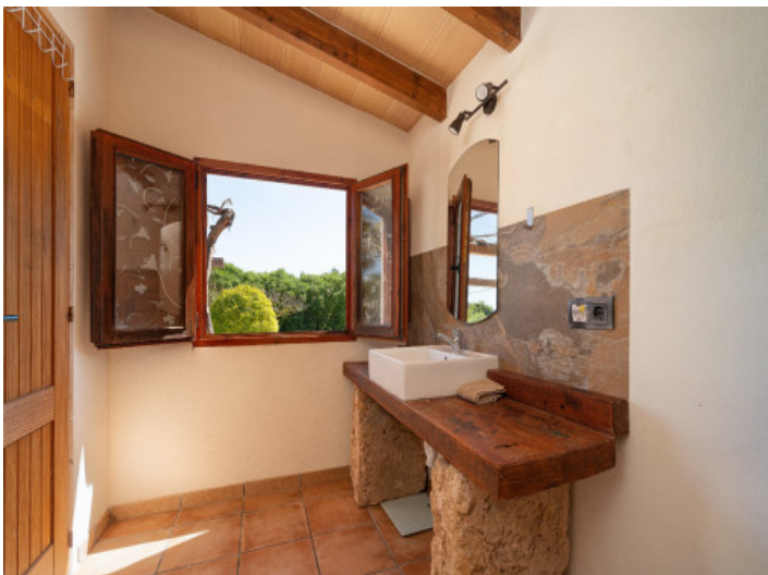
Baño con encanto rústico y vistas al jardín