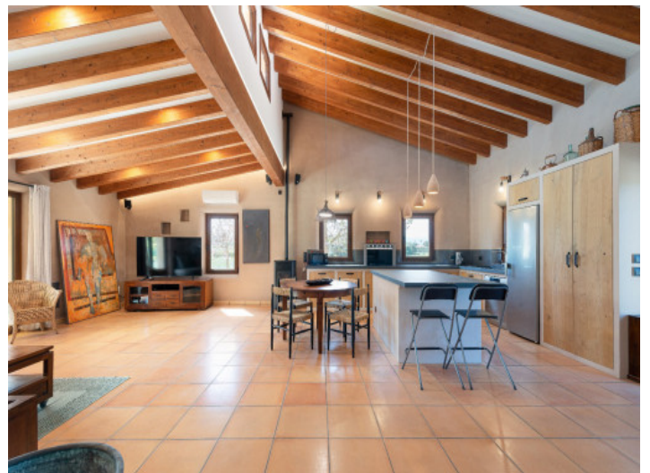
Cocina abierta y calidez natural

Toda la información como mejor se puede saber, salvo por error durante el periodo de venta. Sirva este documento como un informe previo, las bases legales solo serán válidas a través de un contrato de compra acordado ante Notario.