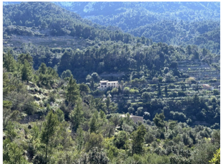
En la mitad de naturaleza