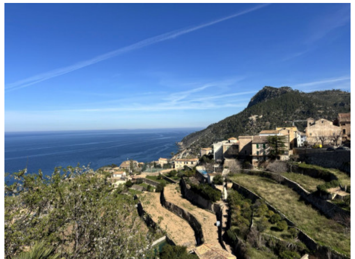
Pueblo de montaña - Banyalbufar

Toda la información como mejor se puede saber, salvo por error durante el periodo de venta. Sirva este documento como un informe previo, las bases legales solo serán válidas a través de un contrato de compra acordado ante Notario.