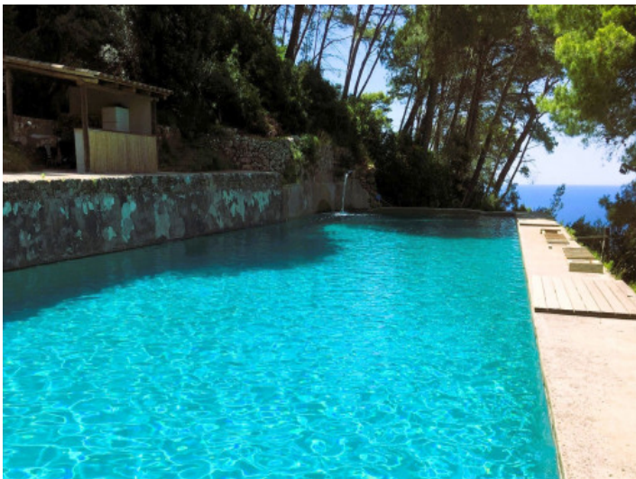
Sa freig - aufgrund der Gegebenheiten nicht für kleine Kinder geeignet ist