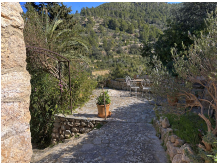
Terrazas con vistas a las montañas