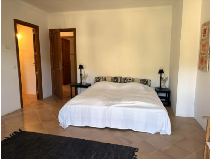
Dormitorio principal con baño en suite