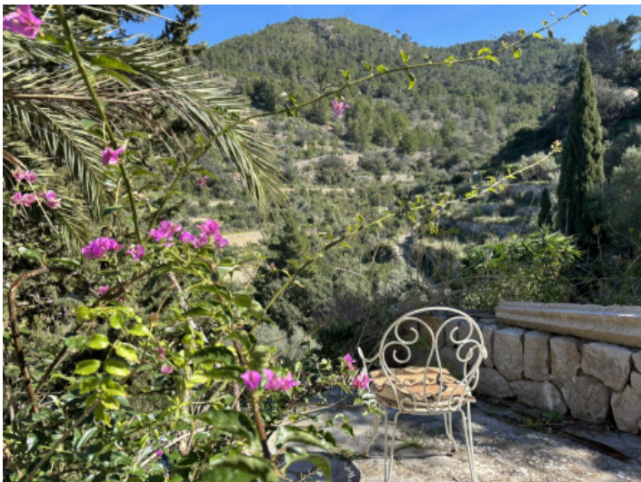
Terrazas con vistas a las montañas