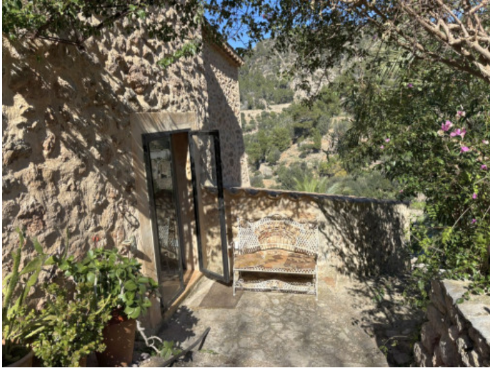
Entrada principal al finca anex