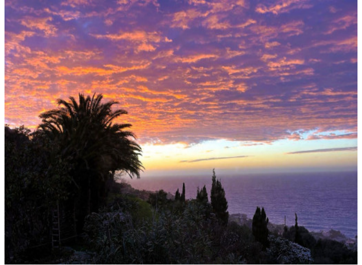
Sa freig - Meerblick