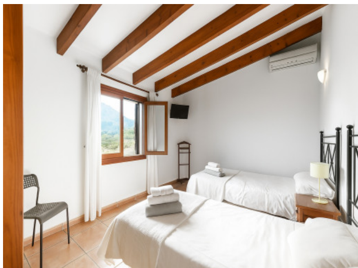
Segundo dormitorio en la planta superior