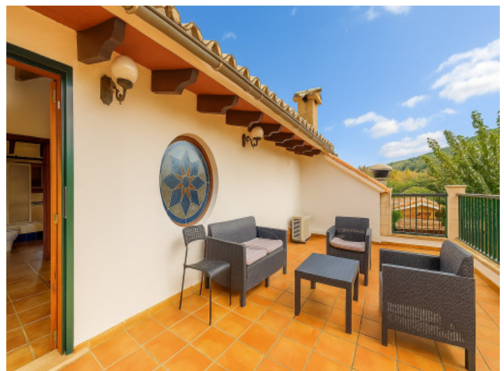
Terraza con zona de estar en la planta superior

Toda la información como mejor se puede saber, salvo por error durante el periodo de venta. Sirva este documento como un informe previo, las bases legales solo serán válidas a través de un contrato de compra acordado ante Notario.