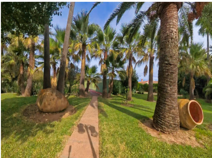
Jardín de palmeras