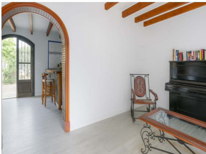
Zona de entrada