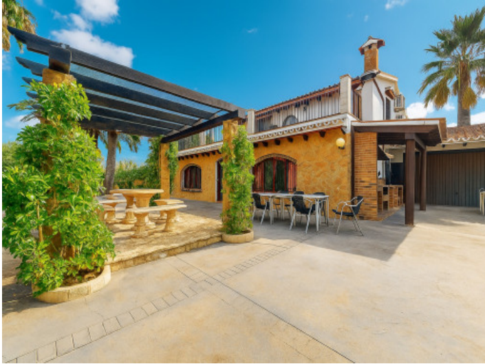
Vista de la casa y terrazas