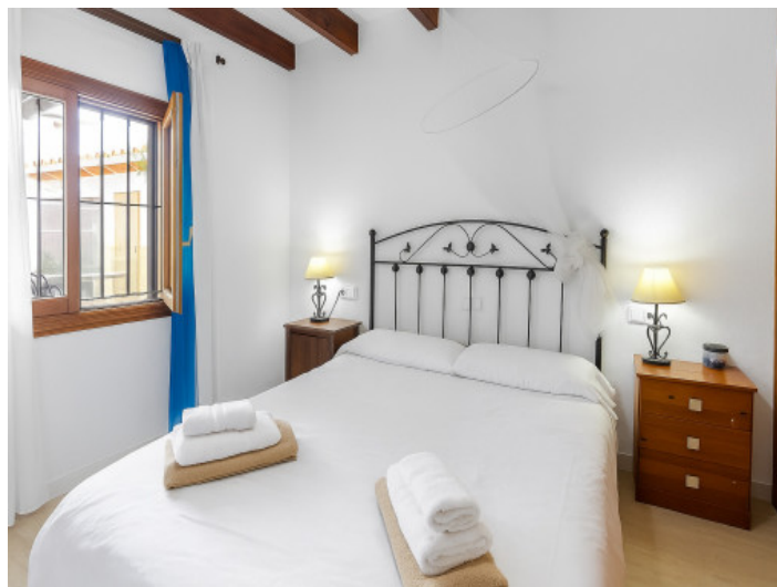
Segundo dormitorio en la planta baja