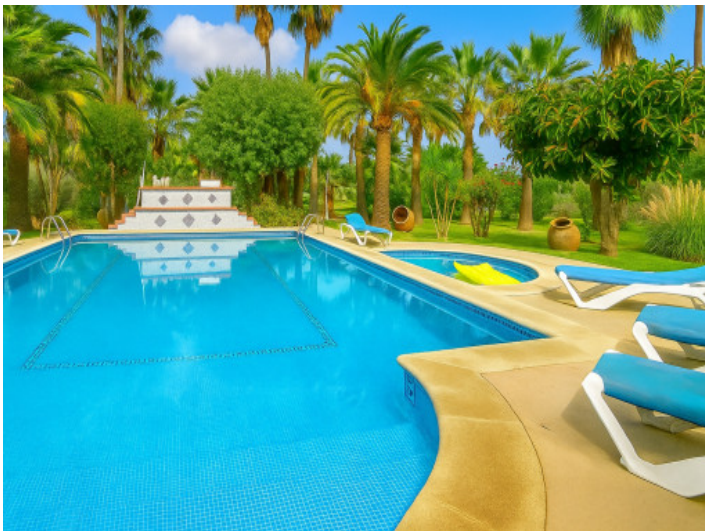
Piscina y terrazas para tomar el sol