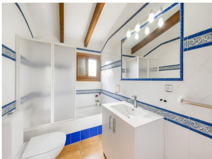
Baño con ducha en la planta superior