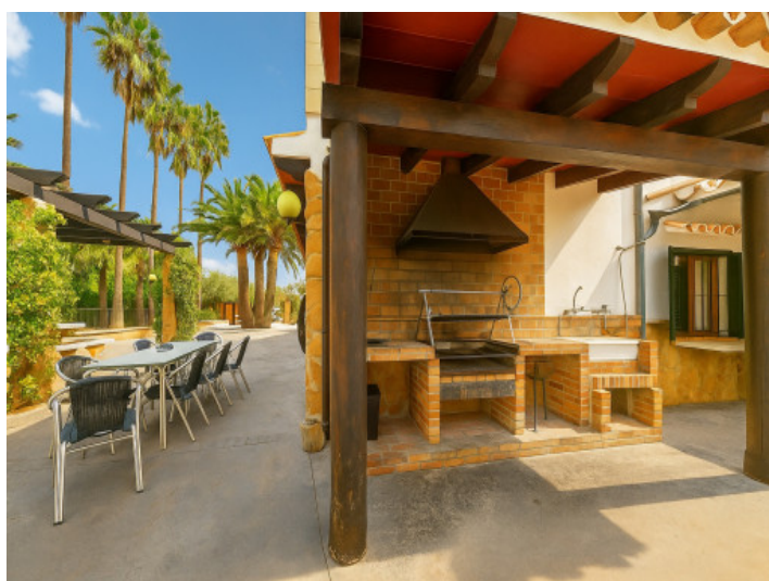
Zona de barbacoa y terraza

Toda la información como mejor se puede saber, salvo por error durante el periodo de venta. Sirva este documento como un informe previo, las bases legales solo serán válidas a través de un contrato de compra acordado ante Notario.