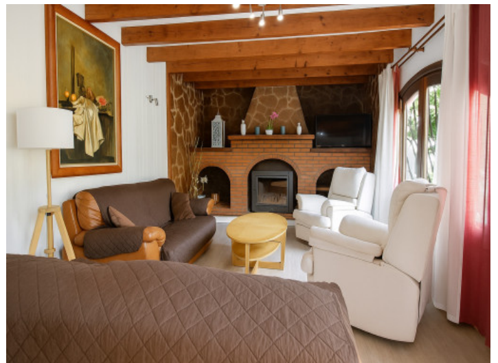
Acogedor salón con chimenea

Toda la información como mejor se puede saber, salvo por error durante el periodo de venta. Sirva este documento como un informe previo, las bases legales solo serán válidas a través de un contrato de compra acordado ante Notario.