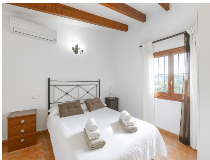
Segundo dormitorio en la planta baja