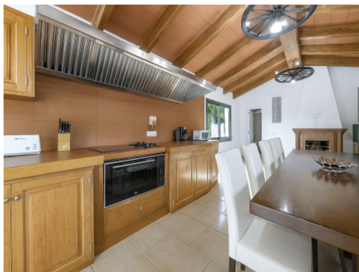
Cocina con salón de banquetes en el anexo