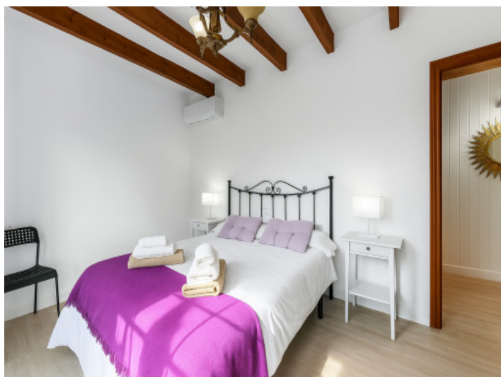
Primer dormitorio en la planta baja