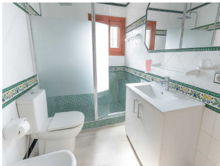
Baño en la planta baja

Toda la información como mejor se puede saber, salvo por error durante el periodo de venta. Sirva este documento como un informe previo, las bases legales solo serán válidas a través de un contrato de compra acordado ante Notario.