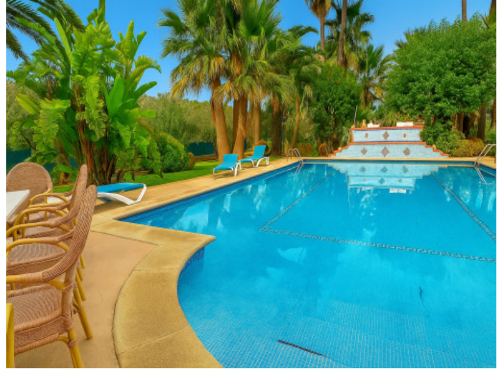
Piscina y zona de estar