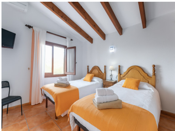
Tercer dormitorio en la planta superior