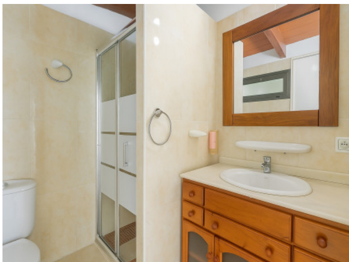
Baño del anexo