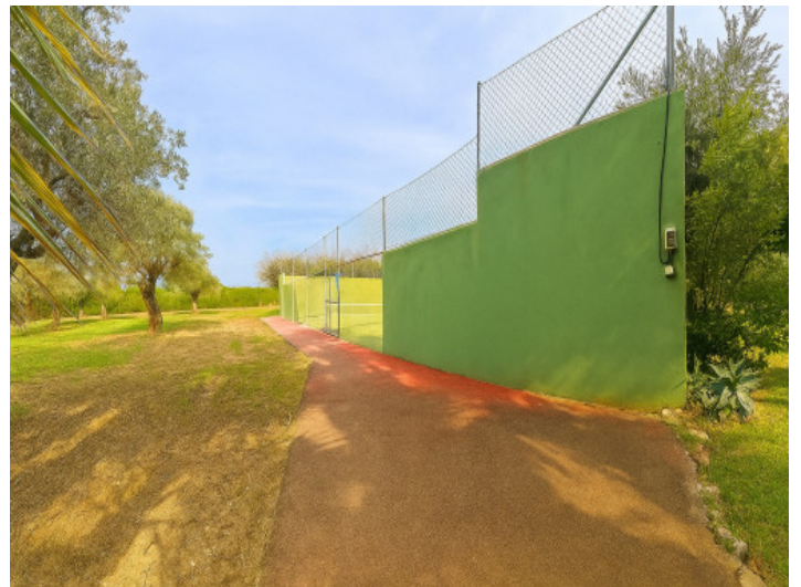
Pista de tenis