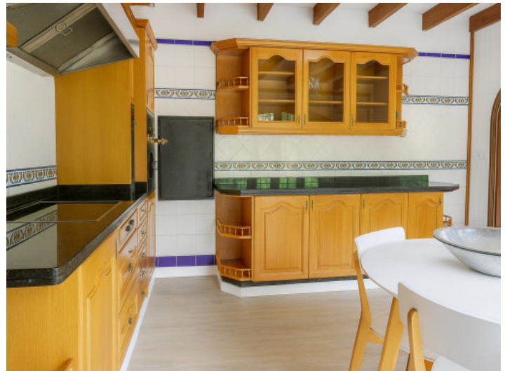
Cocina totalmente equipada