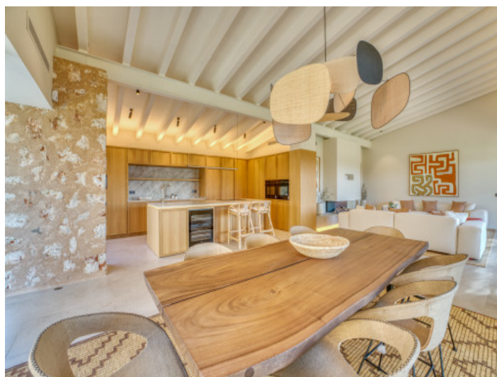
Salón y cocina