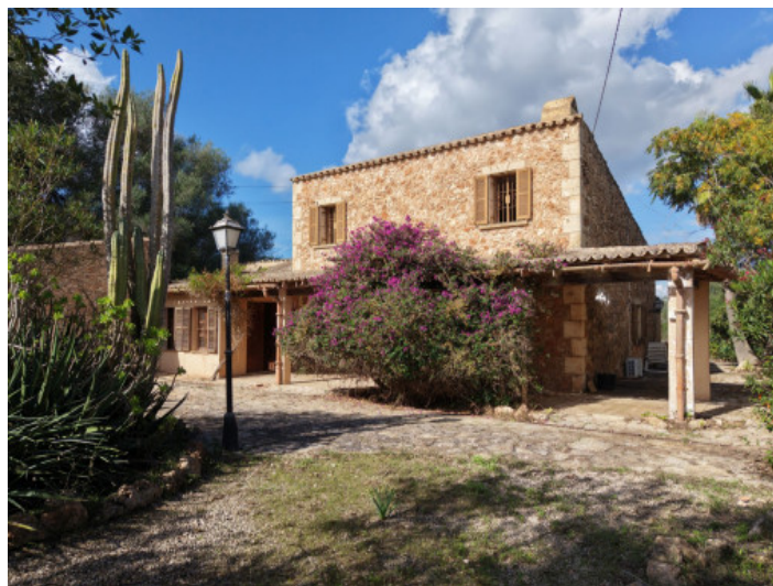
Construido de Piedras