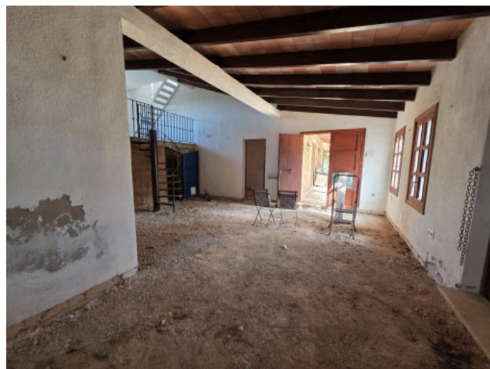
Zona de entrada

Toda la información como mejor se puede saber, salvo por error durante el periodo de venta. Sirva este documento como un informe previo, las bases legales solo serán válidas a través de un contrato de compra acordado ante Notario.