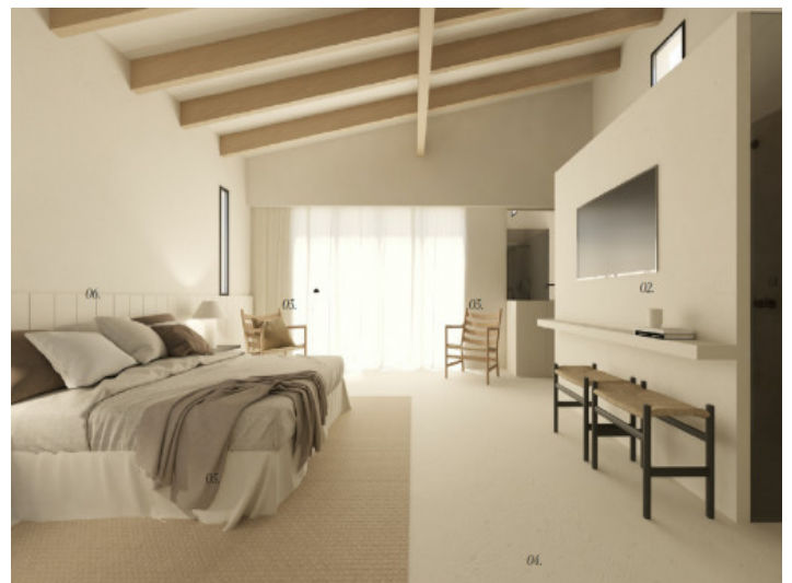
Proyeccion dormitorio principal