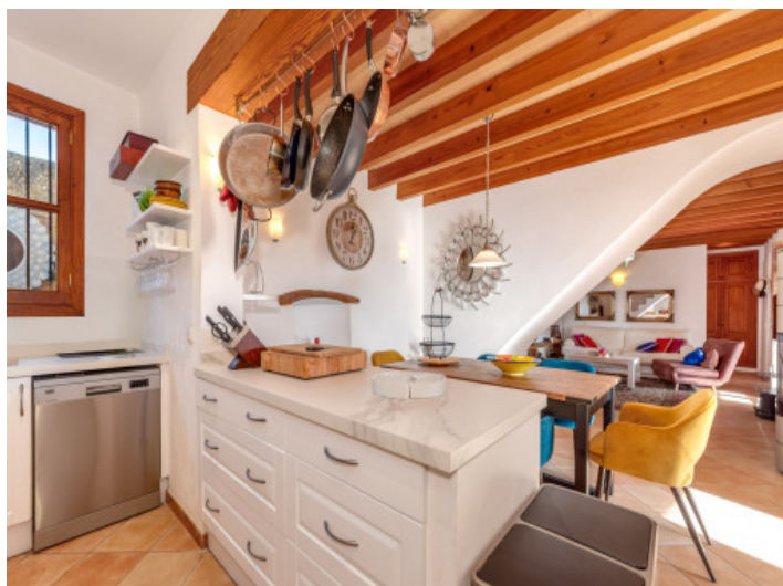
Moderna cocina abierta