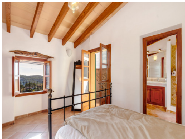
Dormitorio con baño en suite