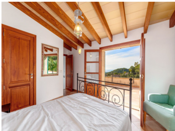
Dormitorio con acceso a la terraza