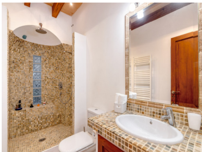
Baño con ducha