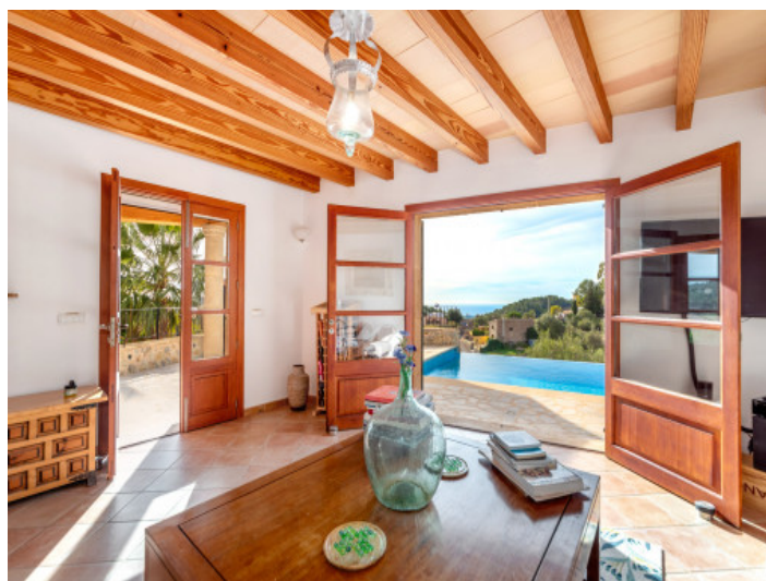
Salon con mucha luz