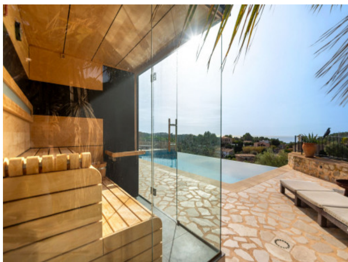
Sauna en el area de la piscina