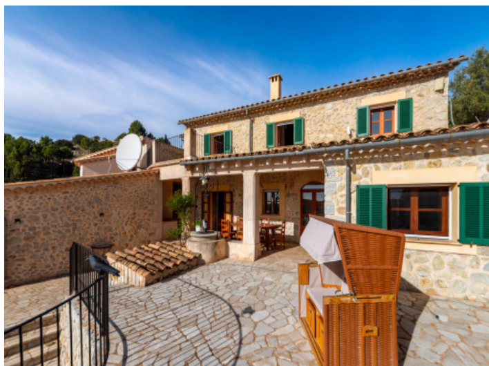
Casa típica mallorquina