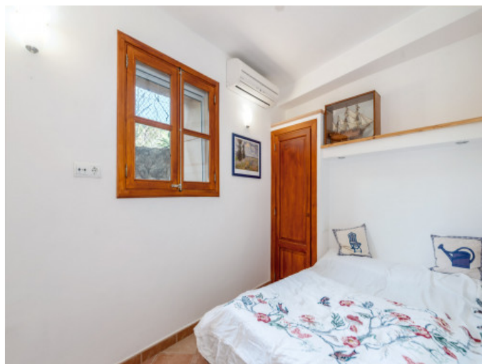
Dormitorio con aire acondicionado

Toda la información como mejor se puede saber, salvo por error durante el periodo de venta. Sirva este documento como un informe previo, las bases legales solo serán validas a traves de un contrato de compra acordado ante Notario.