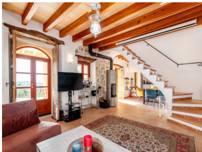
Salón con chimenea

Toda la información como mejor se puede saber, salvo por error durante el periodo de venta. Sirva este documento como un informe previo, las bases legales solo serán validas a traves de un contrato de compra acordado ante Notario.