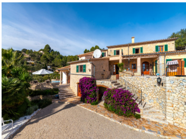
Casa mallorquina con piscina y vistas