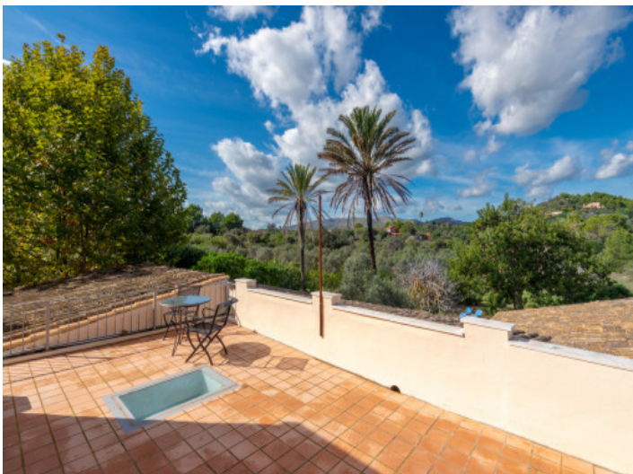
Terraza con vistas directas al mar