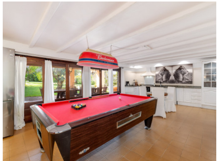
Cocina abierta en la planta inferior con mesa de billar