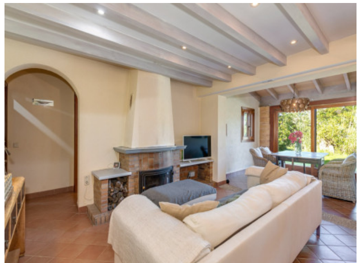
Acogedor salón con chimenea

Toda la información como mejor se puede saber, salvo por error durante el periodo de venta. Sirva este documento como un informe previo, las bases legales solo serán válidas a través de un contrato de compra acordado ante Notario.