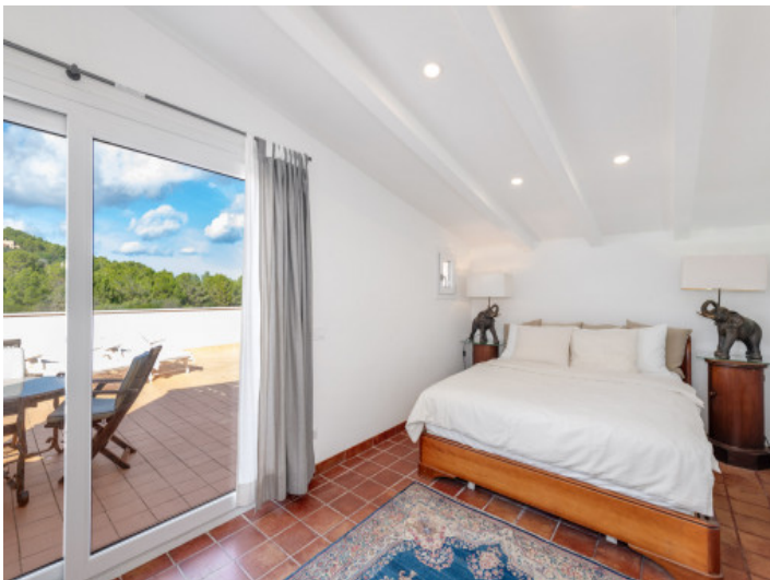
Dormitorio en la planta superior con un ambiente luminoso