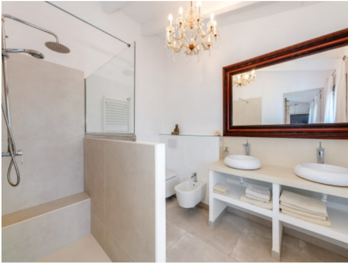
Baño en suite