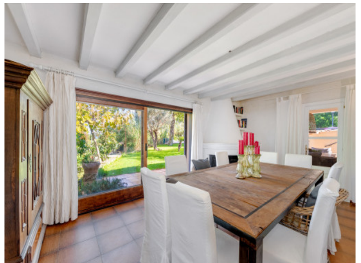
Comedor luminoso con conexión al jardín

Toda la información como mejor se puede saber, salvo por error durante el periodo de venta. Sirva este documento como un informe previo, las bases legales solo serán válidas a través de un contrato de compra acordado ante Notario.