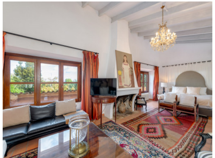
Master suite con zona de estar y vistas a las terrazas