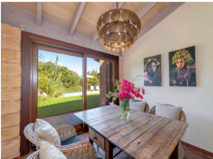
Comedor con acceso al jardín