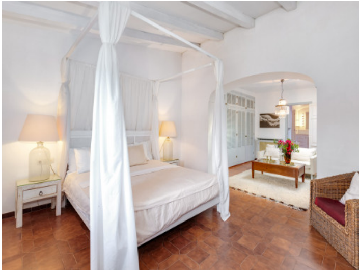
Dormitorio con vestidor y baño en suite