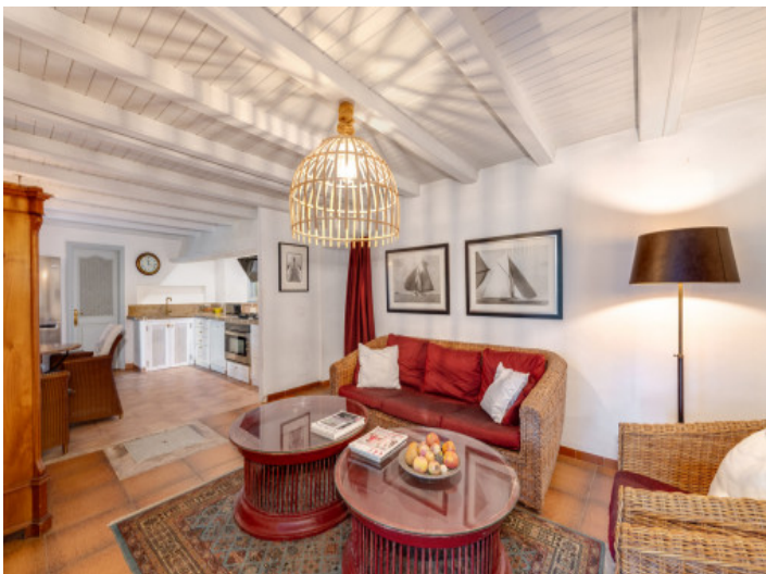
Zona de estar acogedora con un ambiente cálido