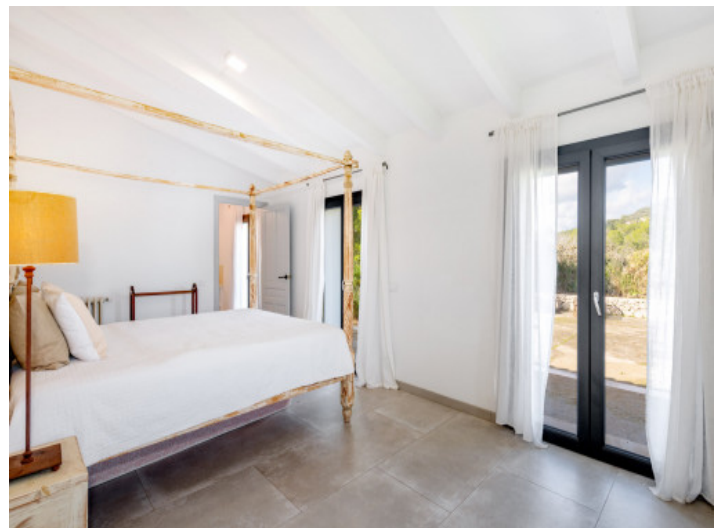
Suite con acceso directo al jardín y un ambiente tranquilo

Toda la información como mejor se puede saber, salvo por error durante el periodo de venta. Sirva este documento como un informe previo, las bases legales solo serán válidas a través de un contrato de compra acordado ante Notario.