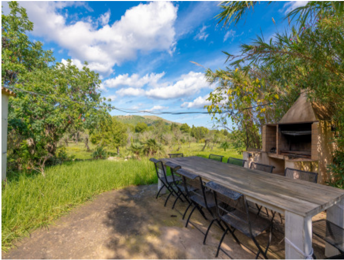
Zona de barbacoa en el jardín