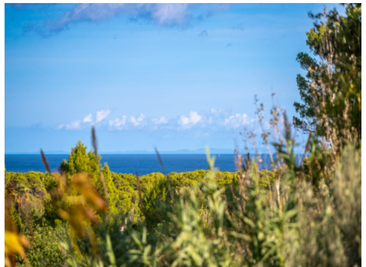
Terraza con vistas directas al mar

Toda la información como mejor se puede saber, salvo por error durante el periodo de venta. Sirva este documento como un informe previo, las bases legales solo serán válidas a través de un contrato de compra acordado ante Notario.