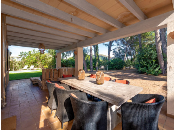
Espacio de comedor en terraza cubierta