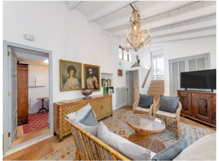
Zona de estar en el ala india con un ambiente cálido