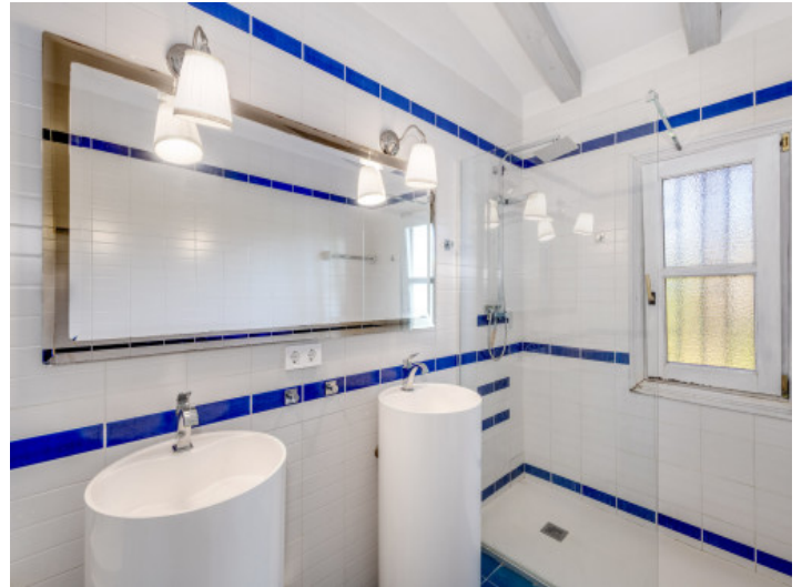
Baño con líneas limpias y definidas