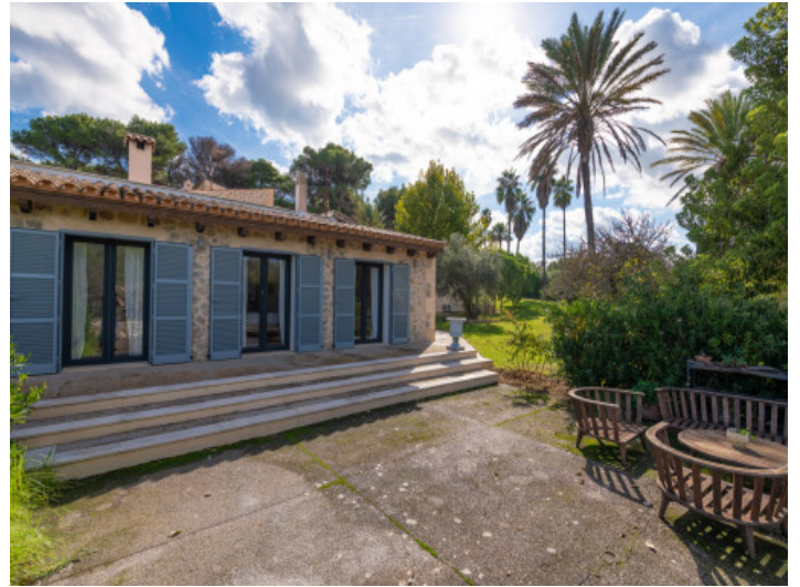
Ala india vista desde el lado del jardín