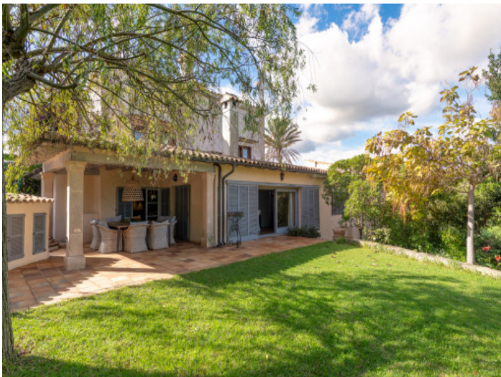
Gran jardín con sombra natural y tranquilidad