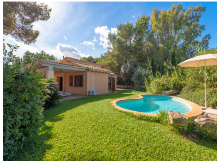
Bungalow con zona de piscina