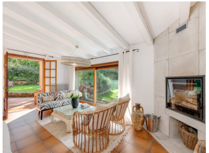
Salón con mucha luz y vistas al jardín