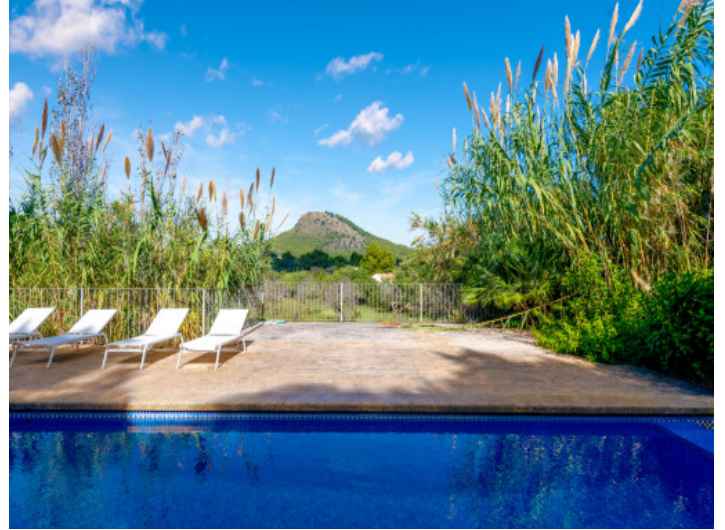
Piscina con mucho sol y un ambiente relajado