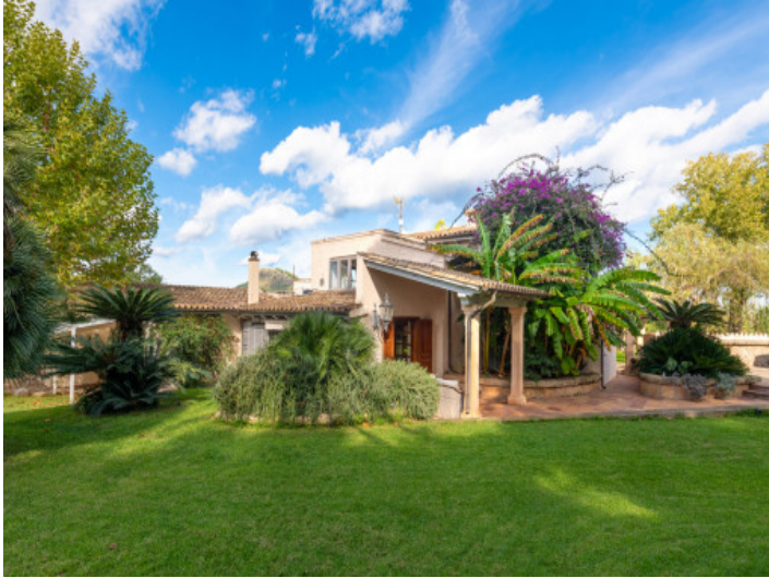
Casa principal: Vista mediterránea de la finca en un entorno natural