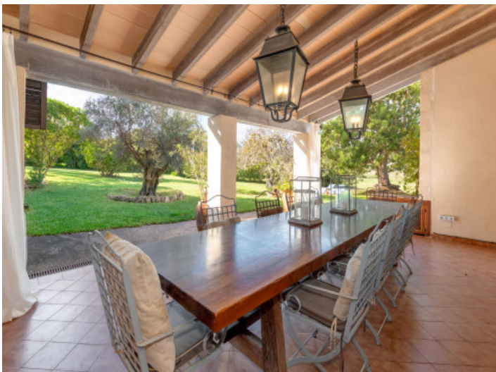
Porche cubierto con vistas al jardín