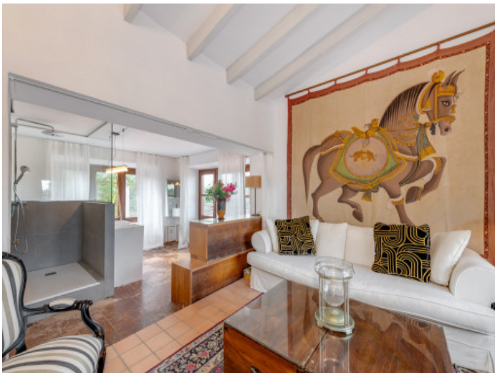
Master suite con ambiente cálido