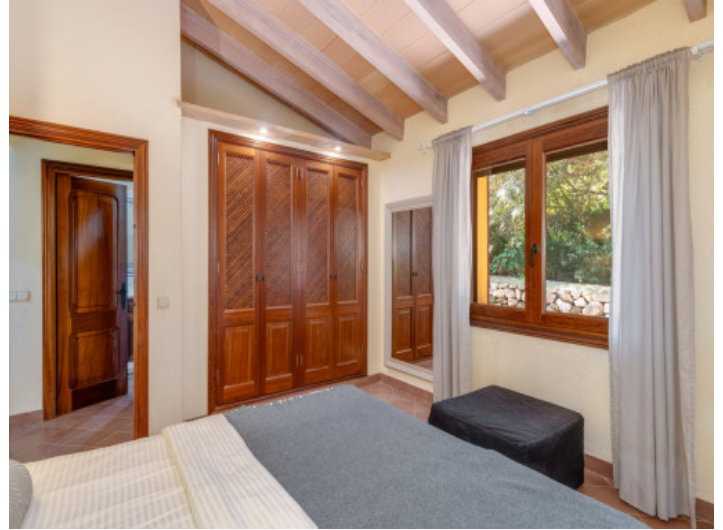
Dormitorio con armario empotrado