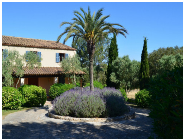
Vista exterior de la finca