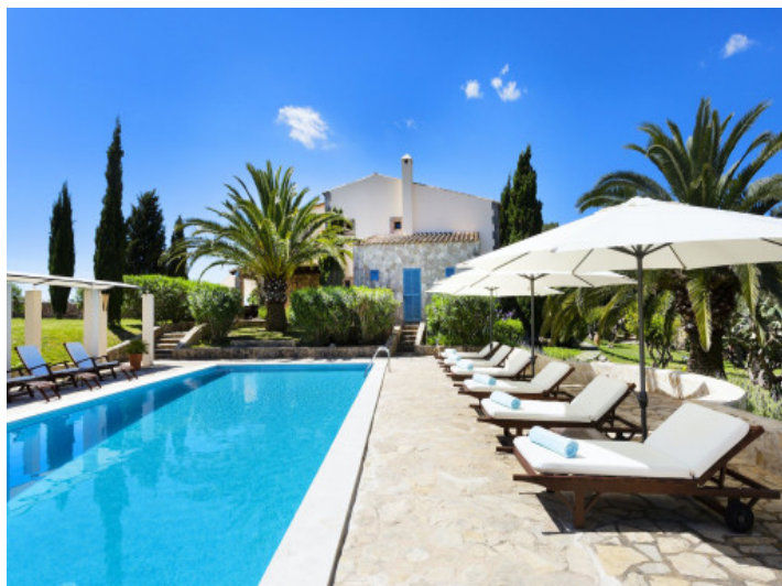
Piscina atractiva con tumbonas