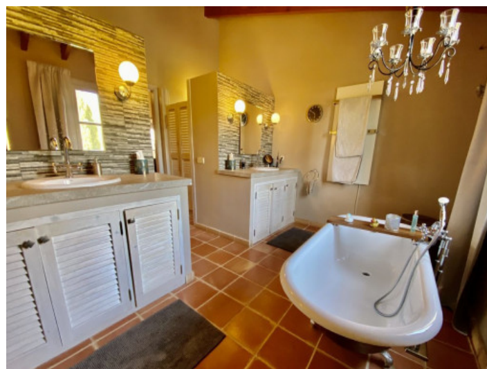
Baño con bañera