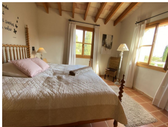
Uno de 11 dormitorios