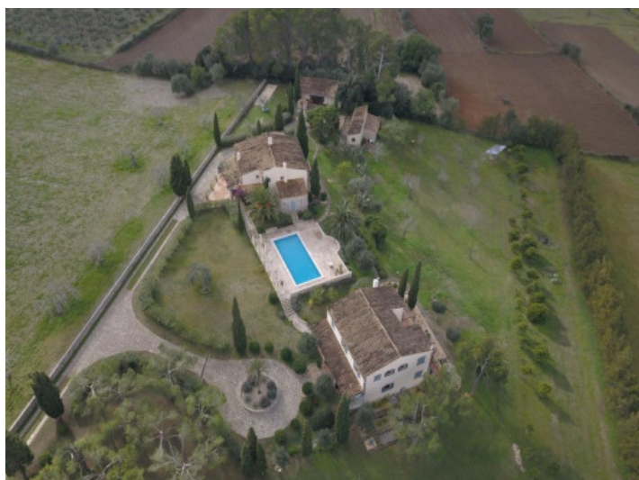
Finca a vista de pájaro