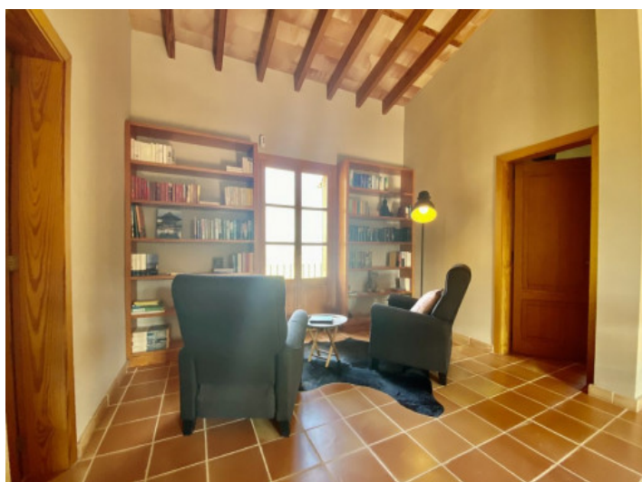
Zona de estar