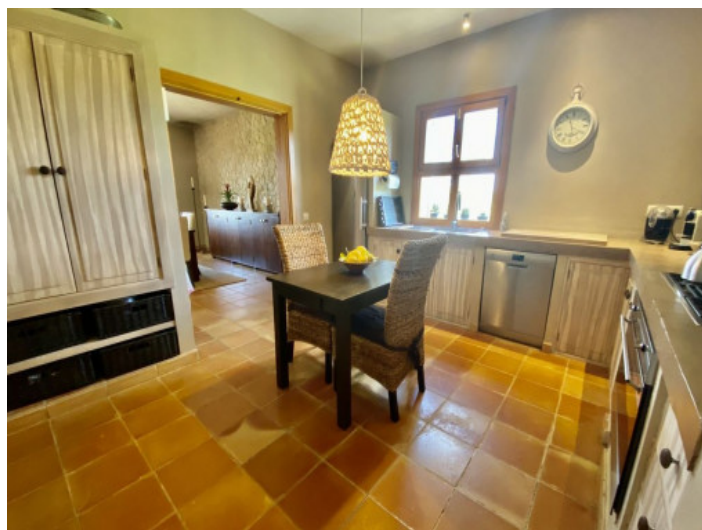
Vista a la cocina con comedor

Toda la información como mejor se puede saber, salvo por error durante el periodo de venta. Sirva este documento como un informe previo, las bases legales solo serán válidas a través de un contrato de compra acordado ante Notario.