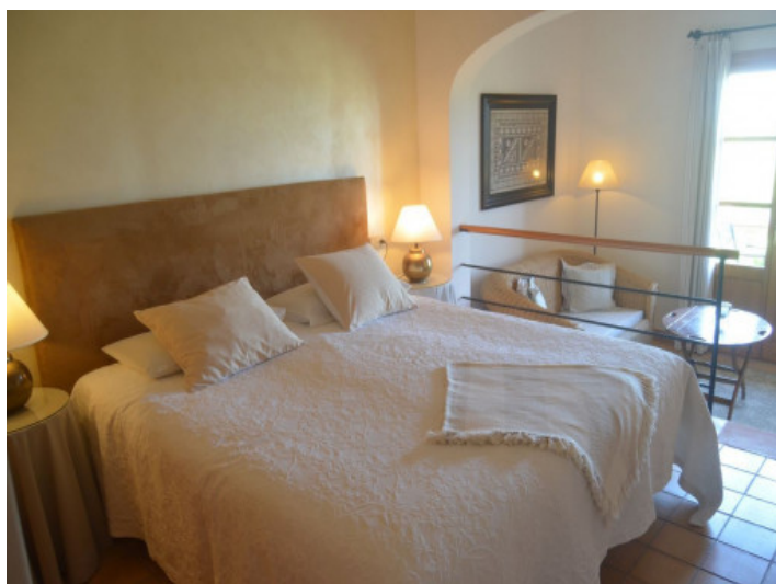
Uno de 11 dormitorios