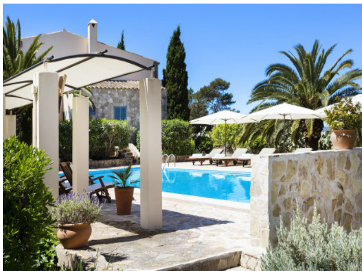
Vista alternativa a la piscina