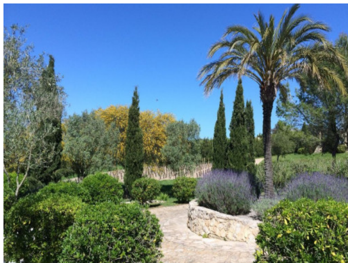
Vista al jardín