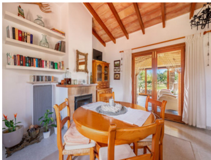
zona de asientos con invernadero acristalado

Toda la información como mejor se puede saber, salvo por error durante el periodo de venta. Sirva este documento como un informe previo, las bases legales solo serán válidas a través de un contrato de compra acordado ante Notario.