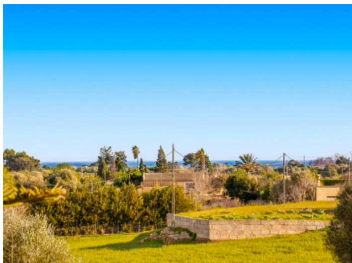
vista al mar

Toda la información como mejor se puede saber, salvo por error durante el periodo de venta. Sirva este documento como un informe previo, las bases legales solo serán validas a traves de un contrato de compra acordado ante Notario.