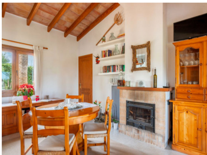
comedor con chimenea