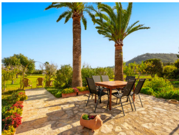
Finca Costa de los Pinos8