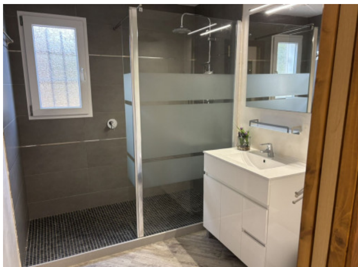
Baño con ducha