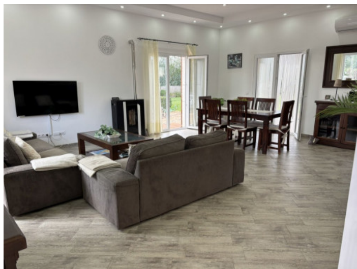
Salón-comedor de concepto abierto

Toda la información como mejor se puede saber, salvo por error durante el periodo de venta. Sirva este documento como un informe previo, las bases legales solo serán válidas a través de un contrato de compra acordado ante Notario.