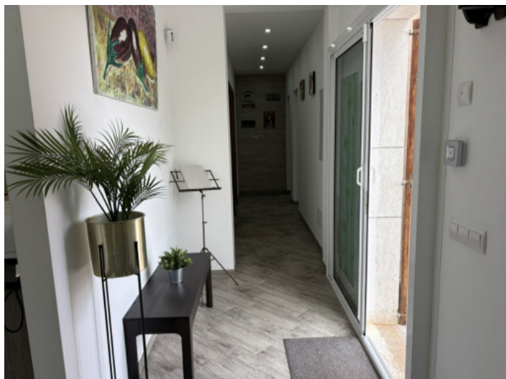
Luminoso hall de entrada