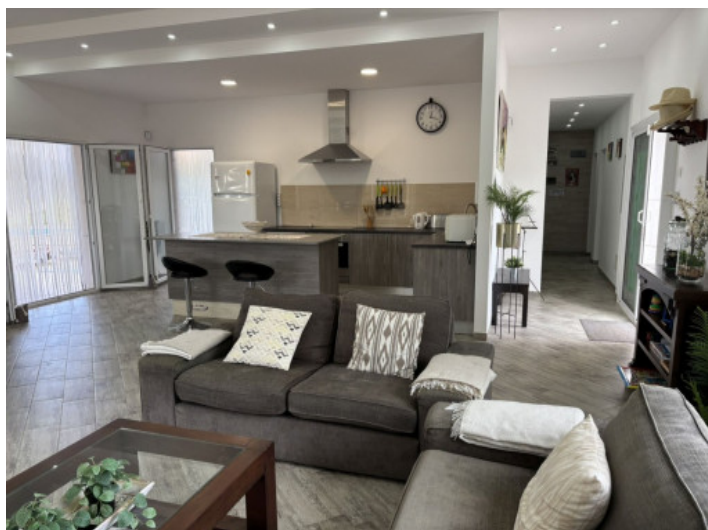
Cocina abierta y salón