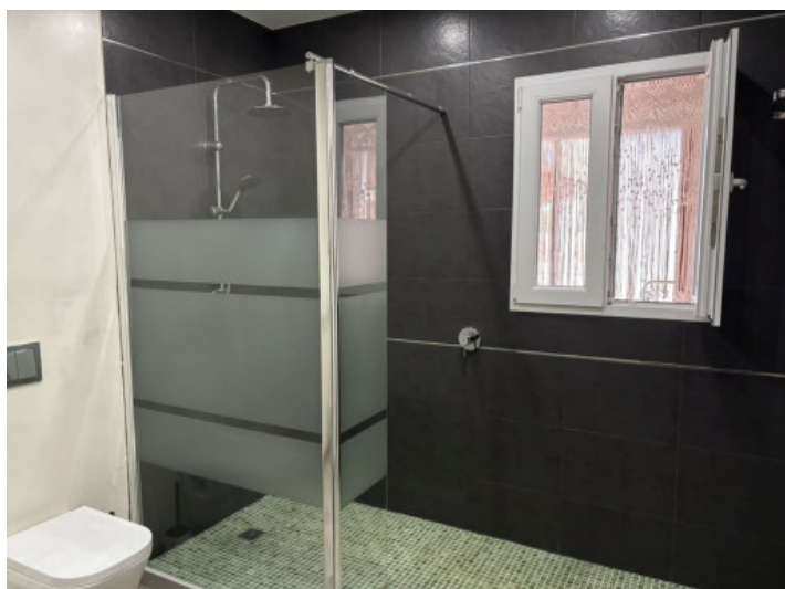
Amplio baño con ducha