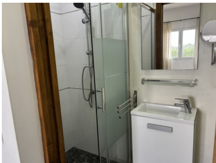
Baño en suite