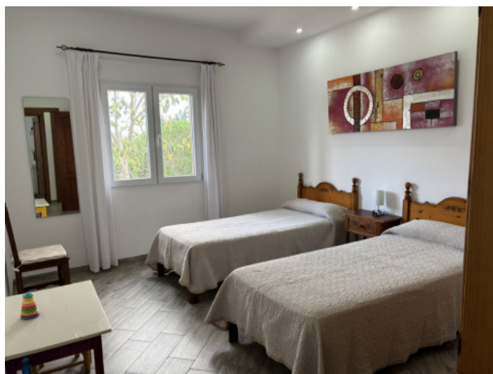
Dormitorio con dos camas individuales