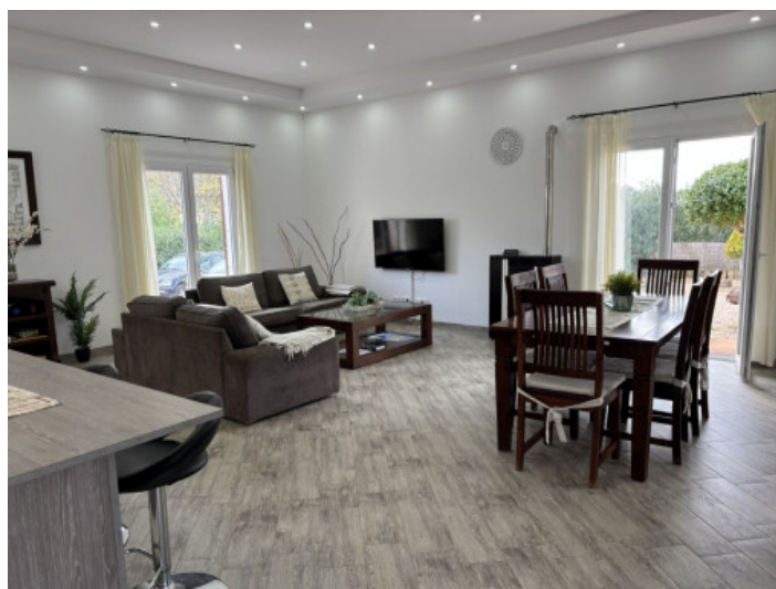
Amplio salón-comedor con acceso a la terraza