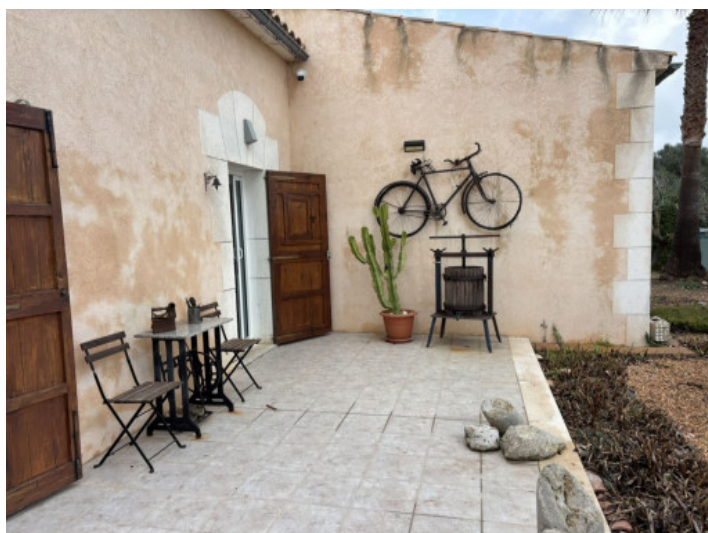
Terraza con zona de estar