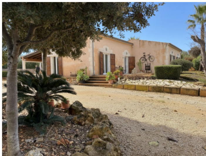
Fachada de la casa con acceso para vehículos