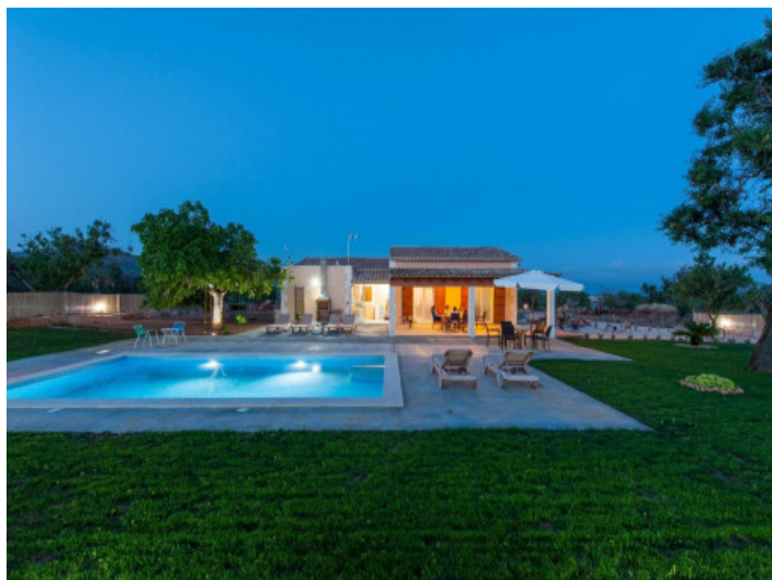
Vista exterior con piscina de noche