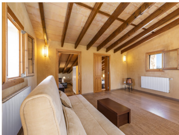
Salón en la planta superior