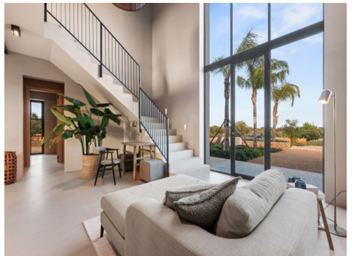
Entrada con escaleras

Toda la información como mejor se puede saber, salvo por error durante el periodo de venta. Sirva este documento como un informe previo, las bases legales solo serán válidas a través de un contrato de compra acordado ante Notario.