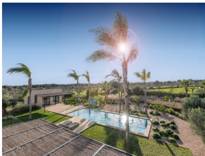
Vistas hacia la piscina