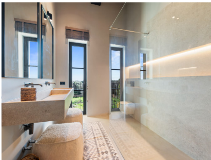
Baño con ducha

Toda la información como mejor se puede saber, salvo por error durante el periodo de venta. Sirva este documento como un informe previo, las bases legales solo serán válidas a través de un contrato de compra acordado ante Notario.