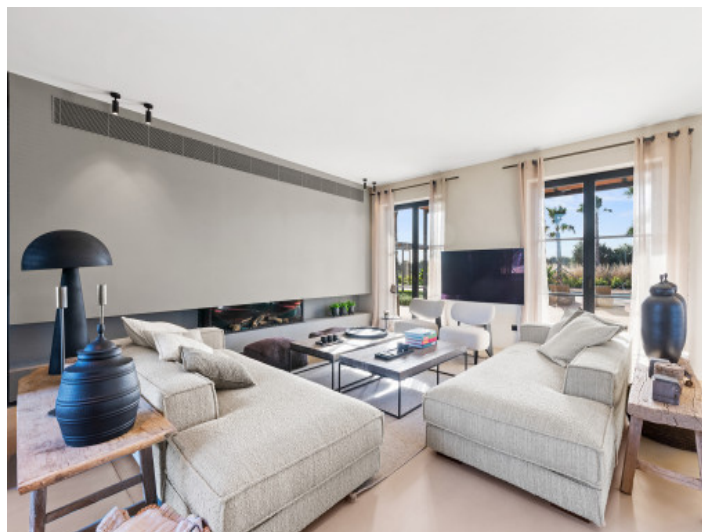
Salón con muebles