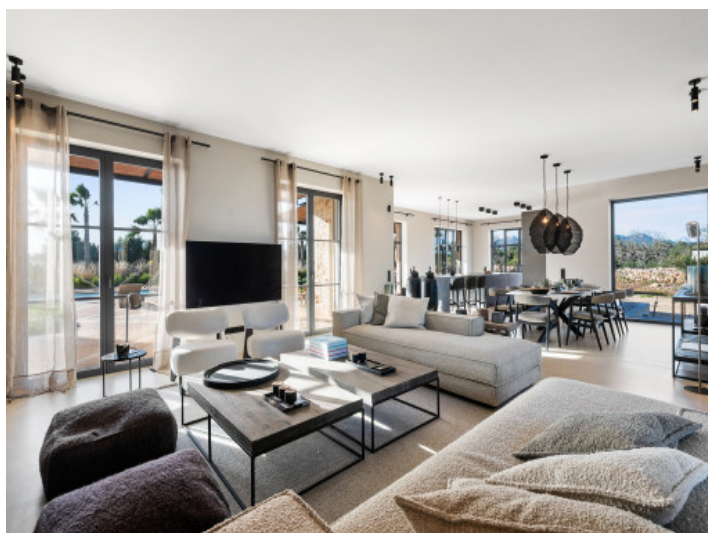
Salón con vistas hacia la piscina