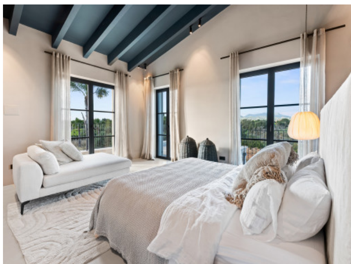
Dormitorio principal primera planta