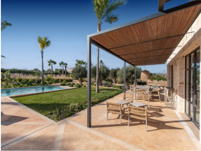
Terraza con pergola