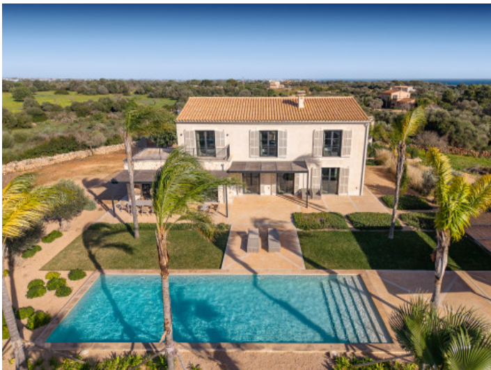
Jardín bellamente diseñado