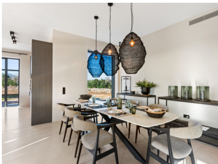
Comedor mesa y sillas