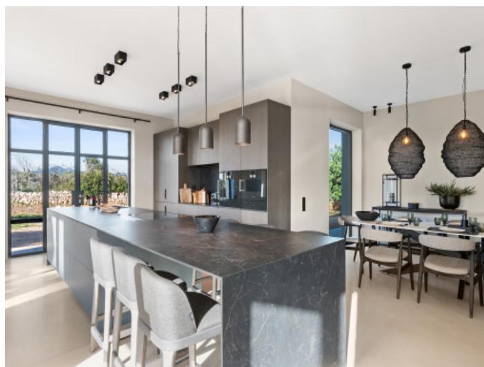
Cocina con comedor en isla