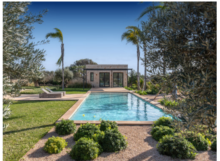
Piscina muy grande con agua salina