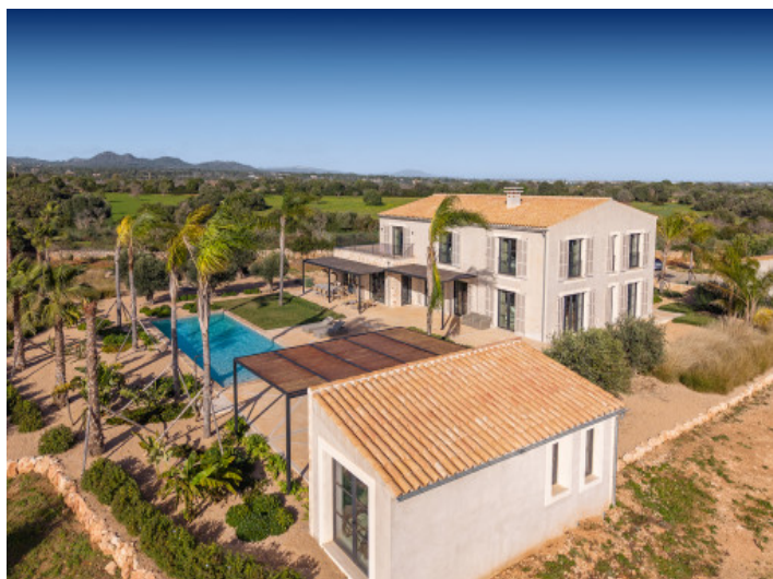
Casita de piscina