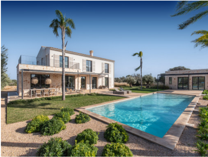
Casa con piscina