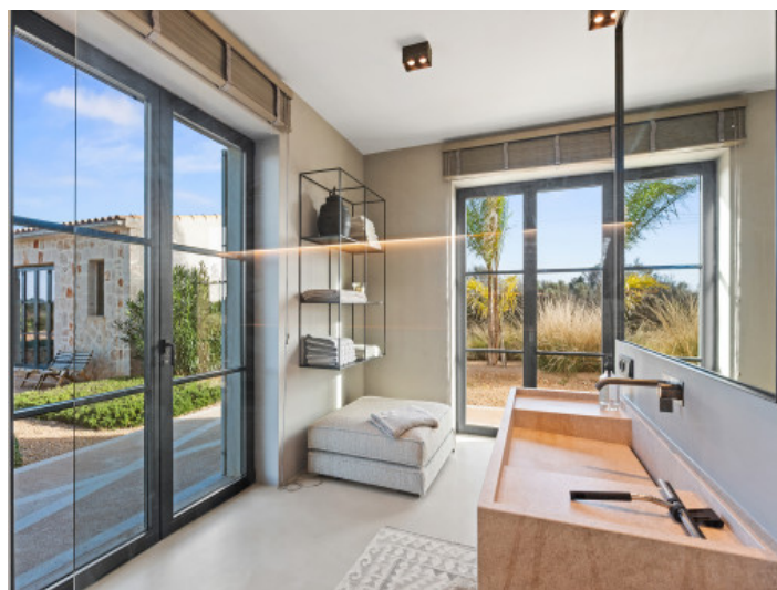
Baño principal planta baja