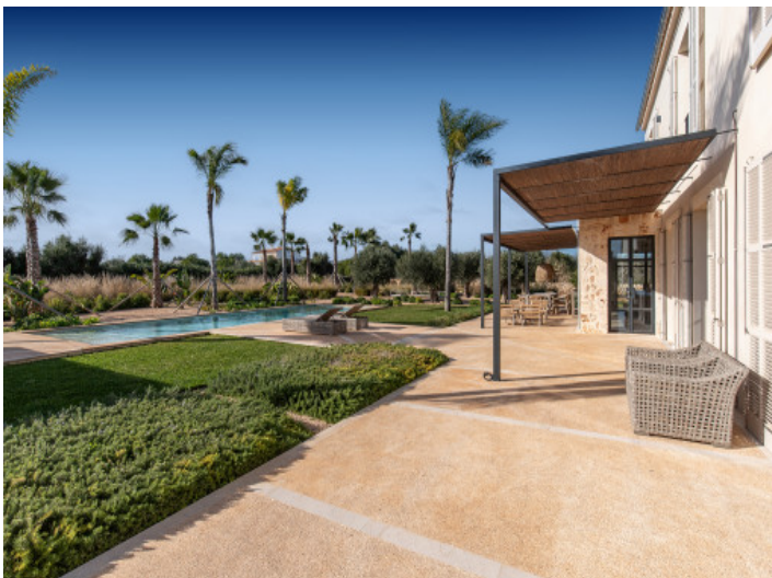
Terraza muy amplia