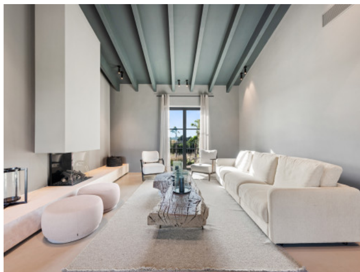
Salón con chimenea primera planta

Toda la información como mejor se puede saber, salvo por error durante el periodo de venta. Sirva este documento como un informe previo, las bases legales solo serán válidas a través de un contrato de compra acordado ante Notario.