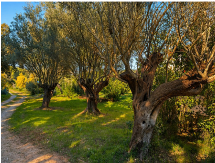
Acceso con olivos

Toda la información como mejor se puede saber, salvo por error durante el periodo de venta. Sirva este documento como un informe previo, las bases legales solo serán válidas a través de un contrato de compra acordado ante Notario.