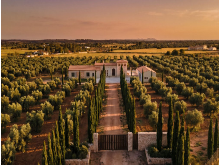
Elegante entrada a la exclusiva finca