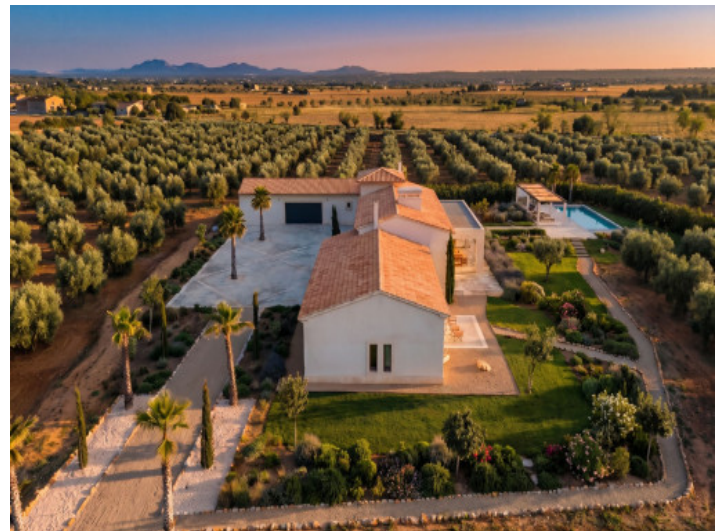
Vista aérea al atardecer sobre la finca con piscina y olivar