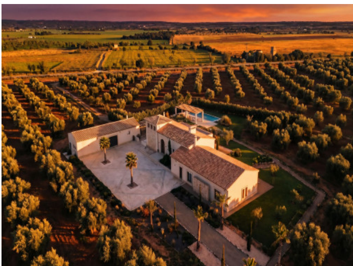
Imagen con dron al atardecer sobre el jardín y la propiedad