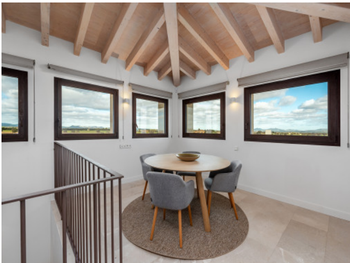
Habitación torre con vistas panorámicas