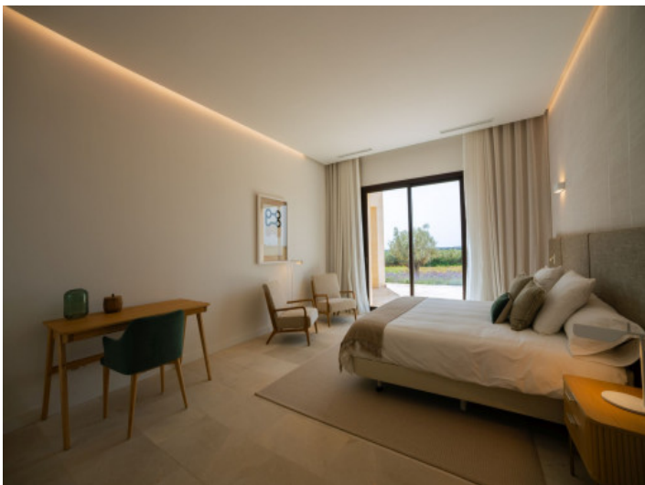
Elegante suite principal con vistas al paisaje mediterráneo