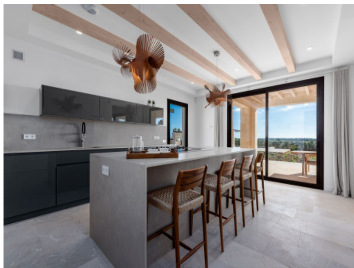
Cocina de diseño de alta calidad con electrodomésticos Gaggenau

Toda la información como mejor se puede saber, salvo por error durante el periodo de venta. Sirva este documento como un informe previo, las bases legales solo serán válidas a través de un contrato de compra acordado ante Notario.