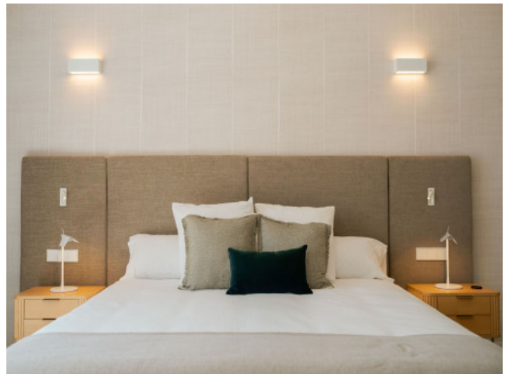
Suite principal de diseño armonioso