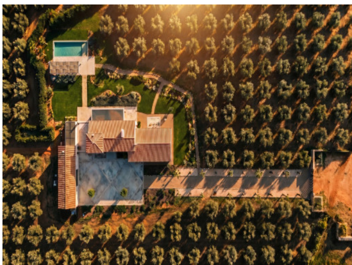
Impresionante vista aérea de la propiedad