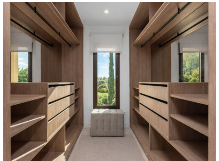
Vestidor con amplio espacio de almacenamiento

Toda la información como mejor se puede saber, salvo por error durante el periodo de venta. Sirva este documento como un informe previo, las bases legales solo serán válidas a través de un contrato de compra acordado ante Notario.