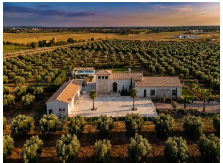
Vista aérea de la finca con jardín mediterráneo, piscina y olivar

Toda la información como mejor se puede saber, salvo por error durante el periodo de venta. Sirva este documento como un informe previo, las bases legales solo serán válidas a través de un contrato de compra acordado ante Notario.