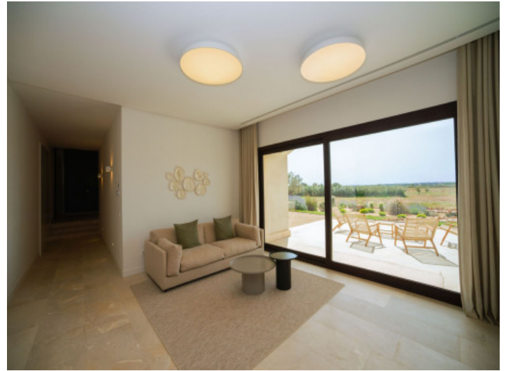
Acogedora lounge en la zona de invitados con terraza