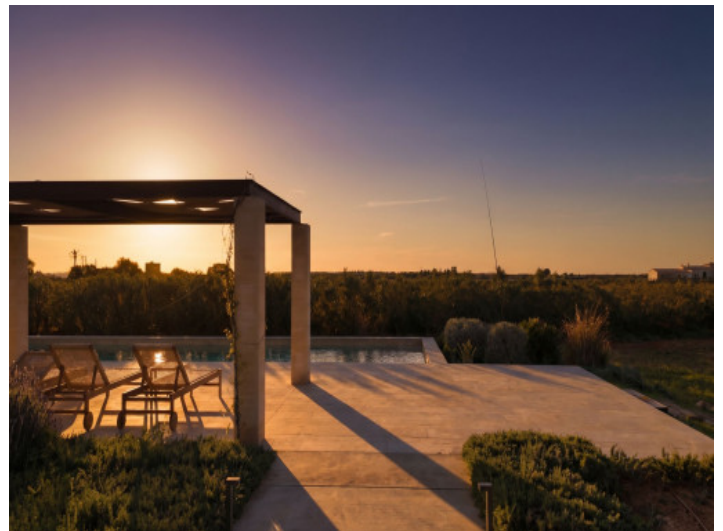
Acceso a la exclusiva y tranquila terraza de la piscina

Toda la información como mejor se puede saber, salvo por error durante el periodo de venta. Sirva este documento como un informe previo, las bases legales solo serán válidas a través de un contrato de compra acordado ante Notario.