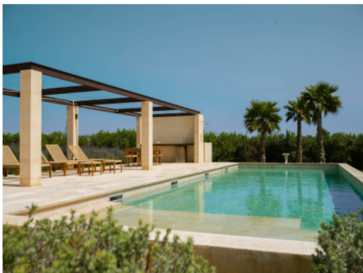
Exclusiva piscina de agua salada en un entorno elegante