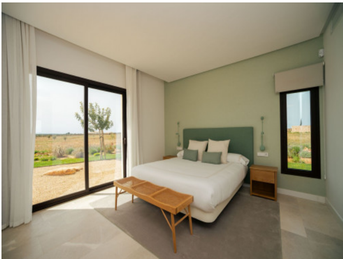
Tres amplios dormitorios de invitados