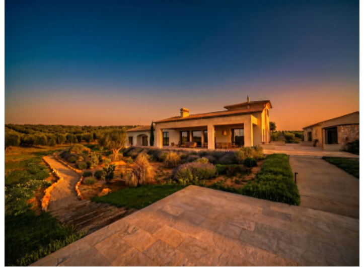
Terraza en una espectacular atmósfera al atardecer