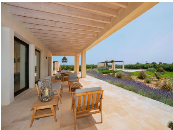
Elegante terraza con vistas al jardín mediterráneo y la piscina