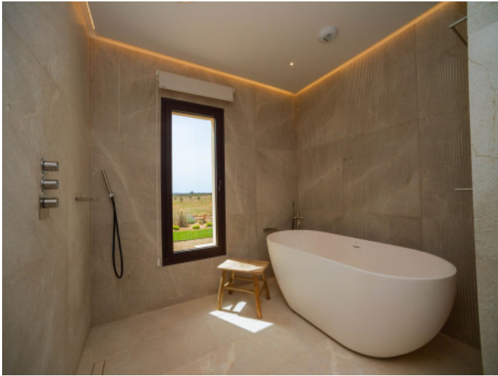
Baño principal de lujo con piedra natural y elegante bañera