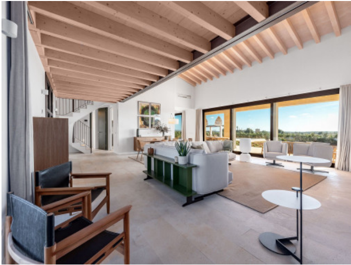
Salón-comedor de concepto abierto