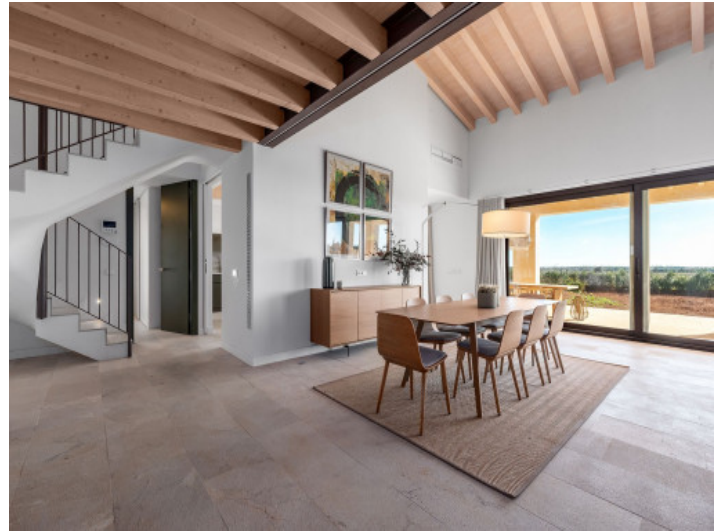
Comedor integrado en el espacio abierto del salón