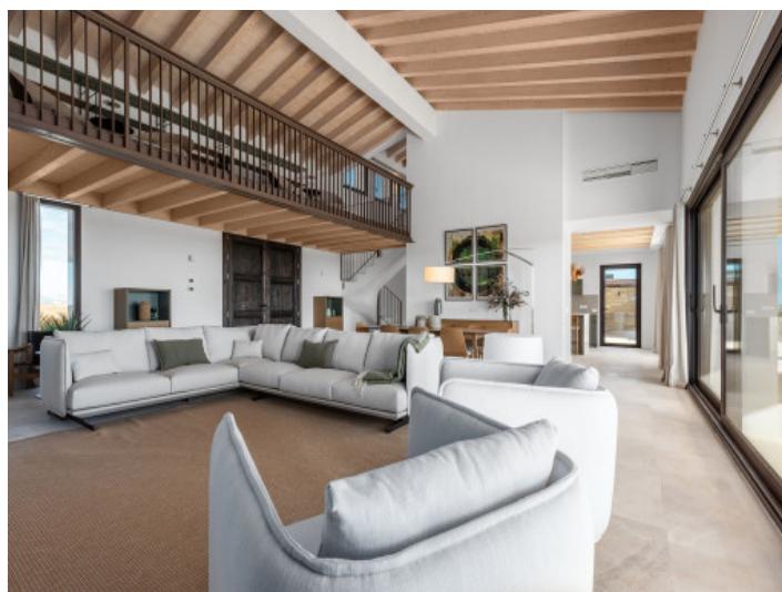
Luminoso salón con galería