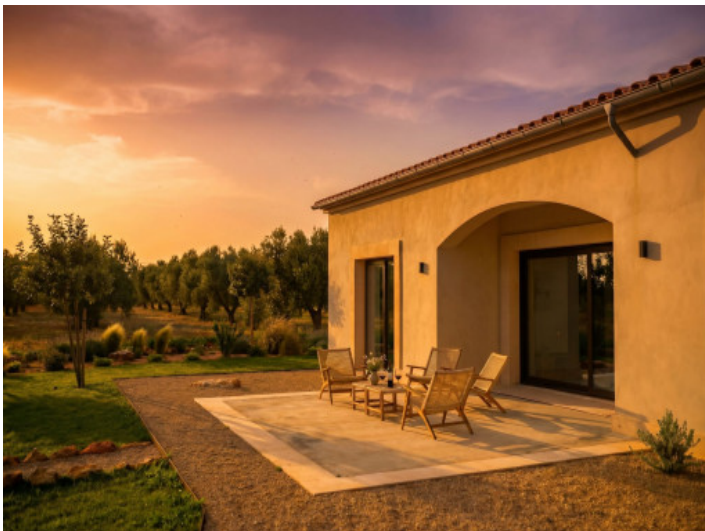
erraza en la luz cálida