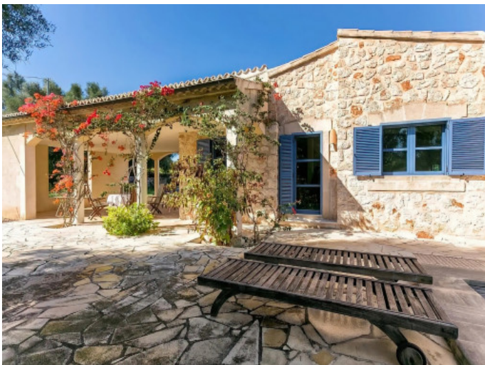
Vista de la casa desde la zona de la piscina