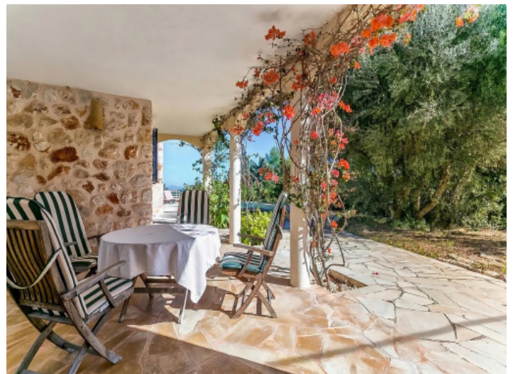
Zonas de estar cubiertas

Toda la información como mejor se puede saber, salvo por error durante el periodo de venta. Sirva este documento como un informe previo, las bases legales solo serán válidas a través de un contrato de compra acordado ante Notario.