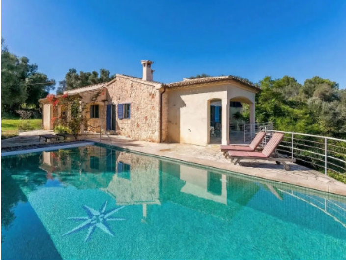
Vista principal de la finca