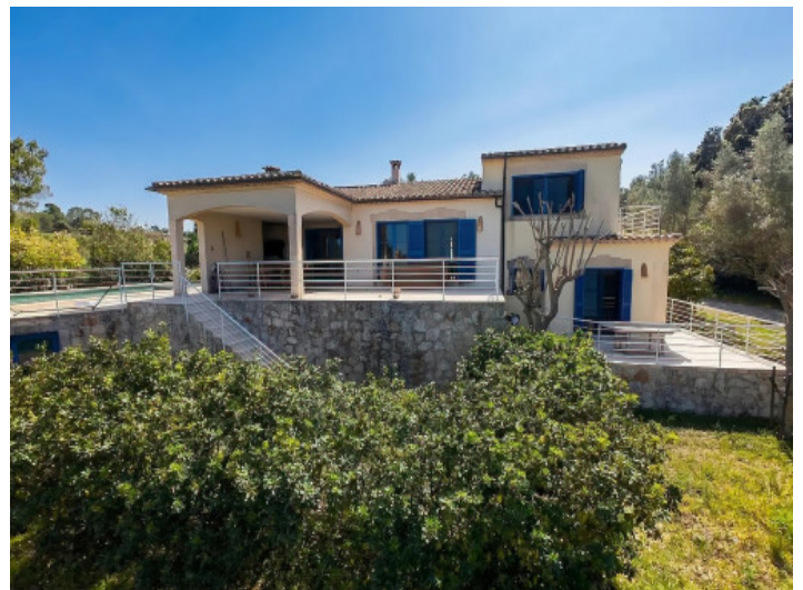
Vista de la casa desde el jardín

Toda la información como mejor se puede saber, salvo por error durante el periodo de venta. Sirva este documento como un informe previo, las bases legales solo serán válidas a través de un contrato de compra acordado ante Notario.