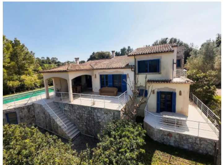
Vista general de la finca