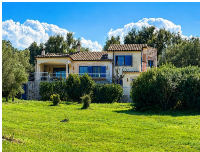
Vista de la casa desde la parte baja de la parcela