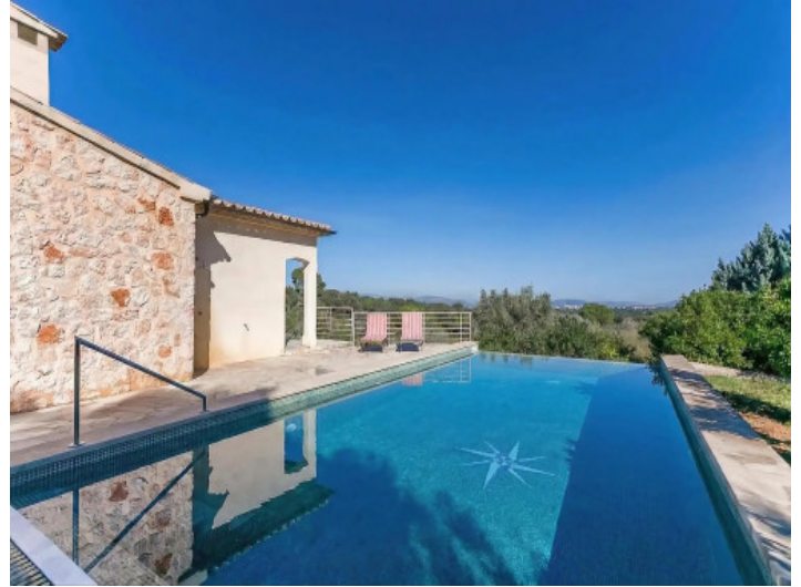
Piscina con vistas sobre Muro hasta Alcúdia