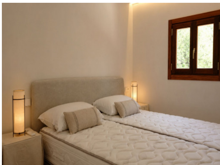
Segundo dormitorio con cama doble