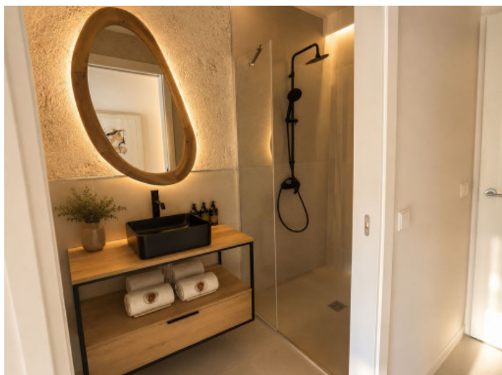
Baño del segundo dormitorio