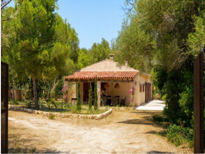
Acceso a la finca