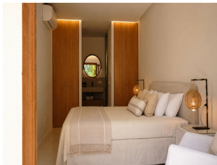
Master-bedroom with bathroom en-suite