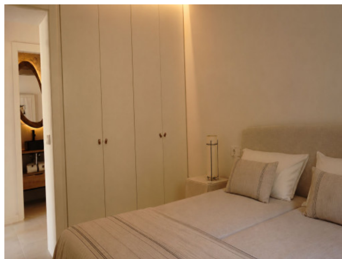
Segundo dormitorio con cama doble