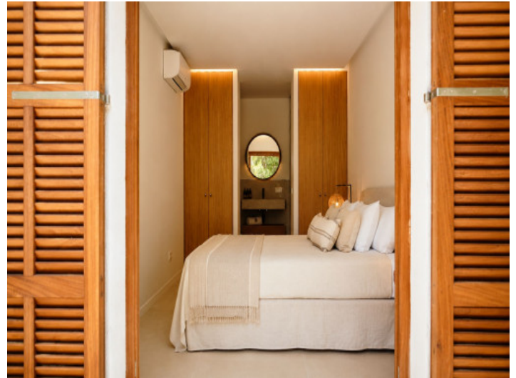
Dormitorio principal con baño en suite