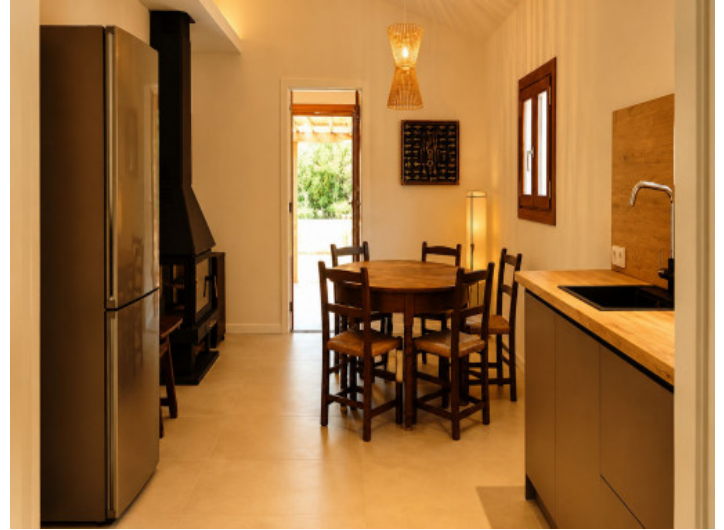
Área de comer y cocinar con chimenea