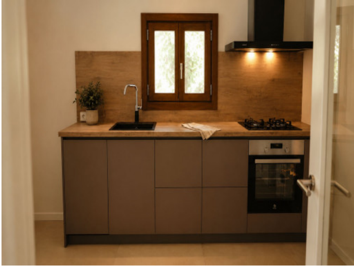
Cocina moderna y completamente equipada