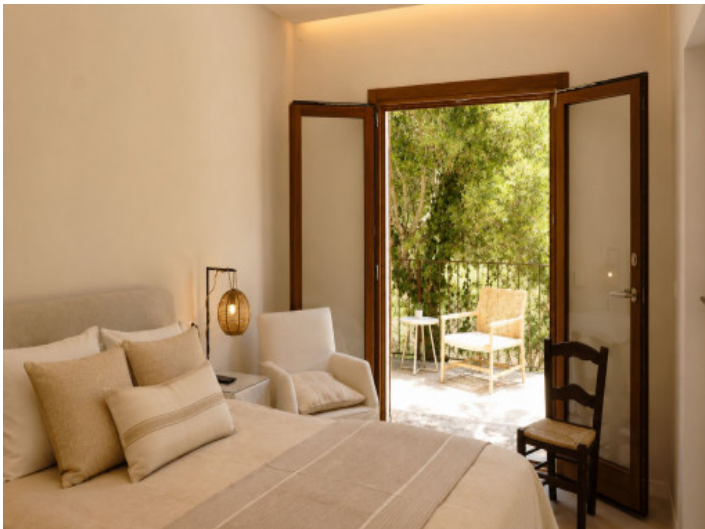
Dormitorio con acceso al exterior