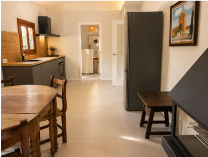
Área de comer y cocinar con chimenea