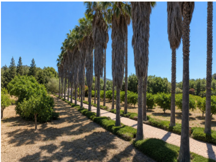
Camino bordeado de árboles con paisaje de jardín