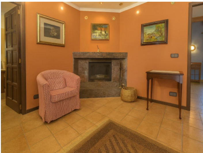
Acogedor pasillo con chimenea y sillón