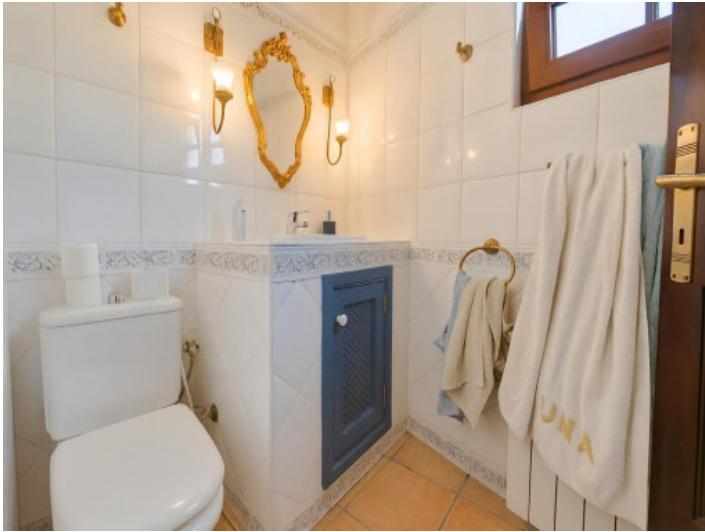
Baño pequeño con espejo decorativo