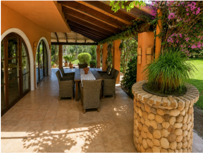
Terraza cubierta con comedor y vista al jardín