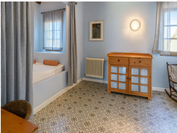
Acogedor dormitorio en planta baja con área de estar