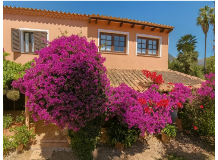
Fachada de casa con jardín florido