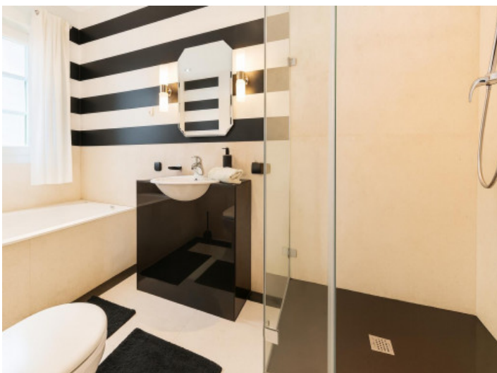
Baño moderno en suite con ducha