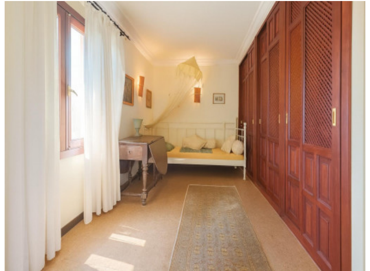
Dormitorio luminoso con armario grande