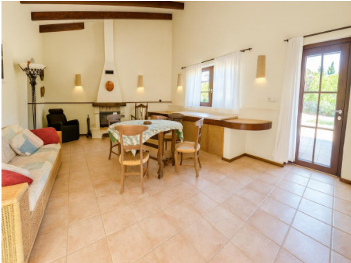
Área para invitados con salón comedor y cocina