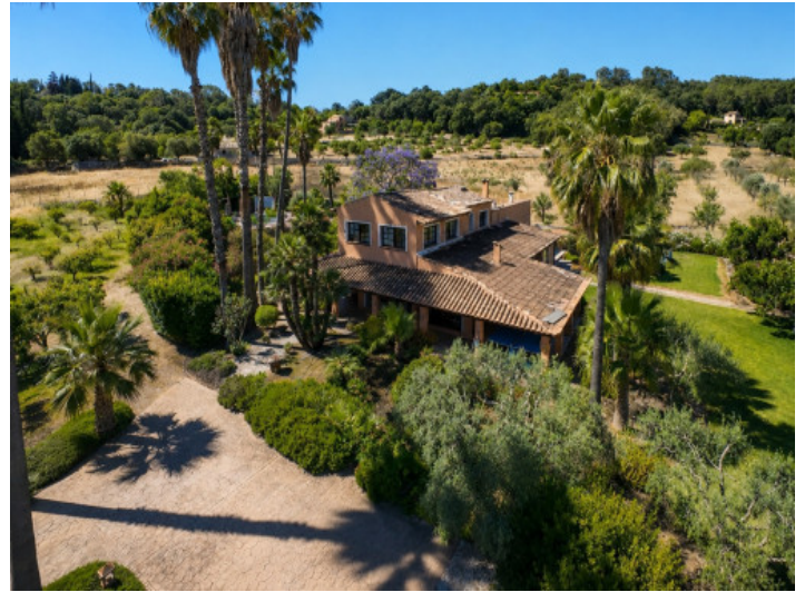
Vista aérea de villa grande con jardín