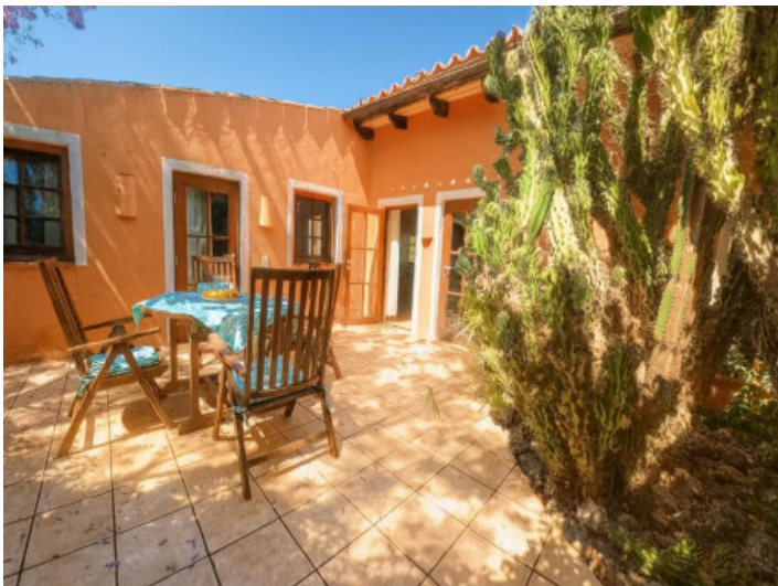
Terraza soleada con jardín de cactus