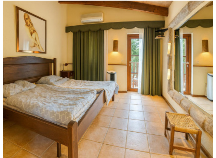
Dormitorio doble de invitados con acceso al balcón