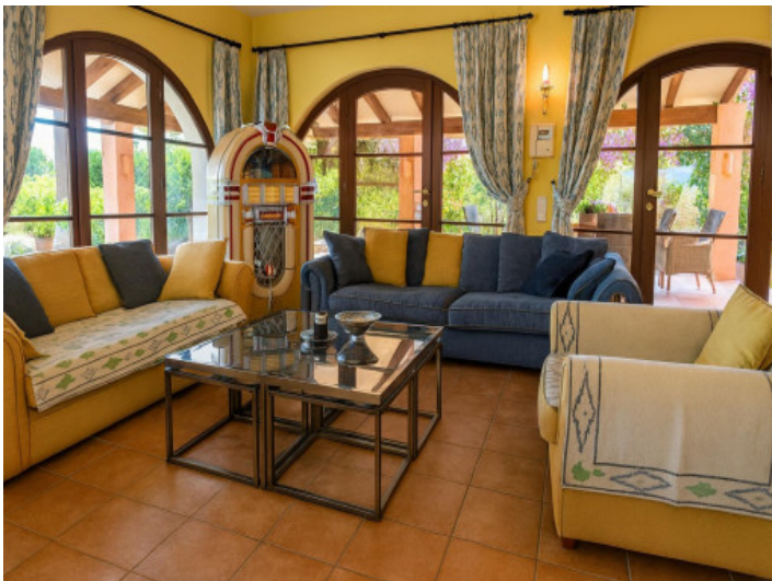
Acogedora sala con jukebox y vista exterior