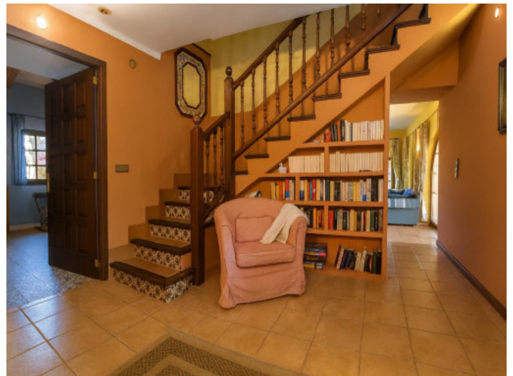
Acogedor recibidor con escalera y estantería