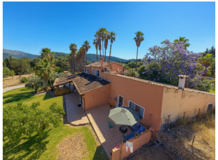
Propiedad espaciosa con jardín y patio