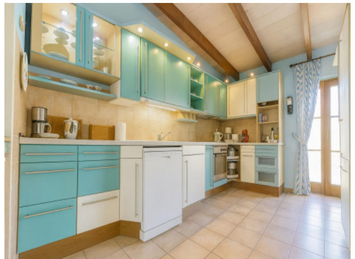
Cocina luminosa con armarios azules

Toda la información como mejor se puede saber, salvo por error durante el periodo de venta. Sirva este documento como un informe previo, las bases legales solo serán válidas a través de un contrato de compra acordado ante Notario.