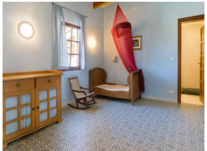
Dormitorio rústico con suelo decorativo

Toda la información como mejor se puede saber, salvo por error durante el periodo de venta. Sirva este documento como un informe previo, las bases legales solo serán válidas a través de un contrato de compra acordado ante Notario.