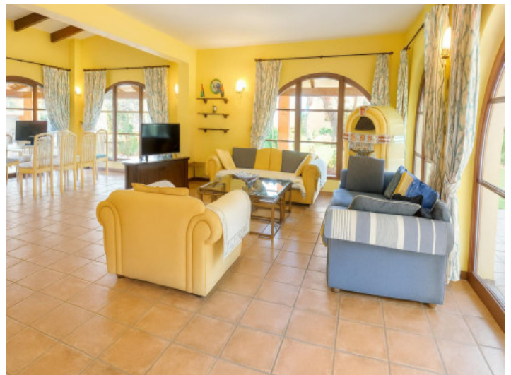
Amplio salón comedor con televisor