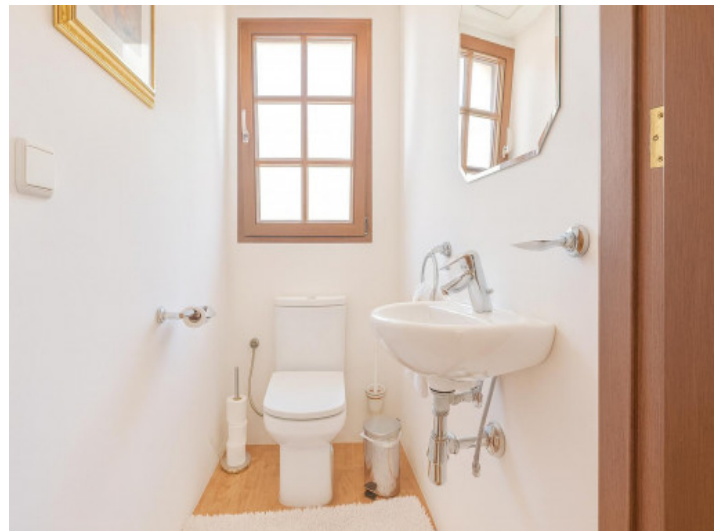
Pequeño cuarto de baño para invitados luminoso