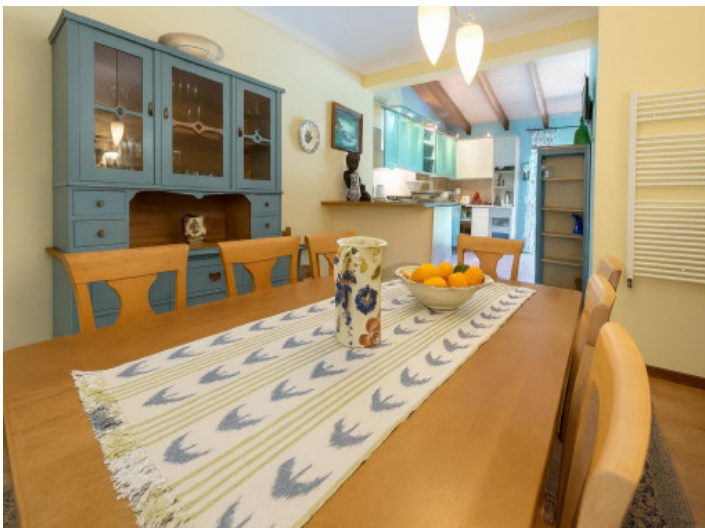
Zona de comedor con jarrones decorativos