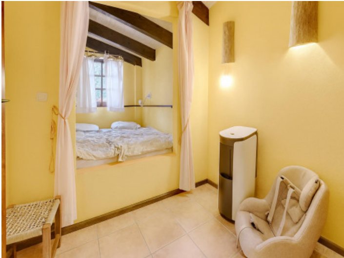
Dormitorio de invitados con iluminación acogedora