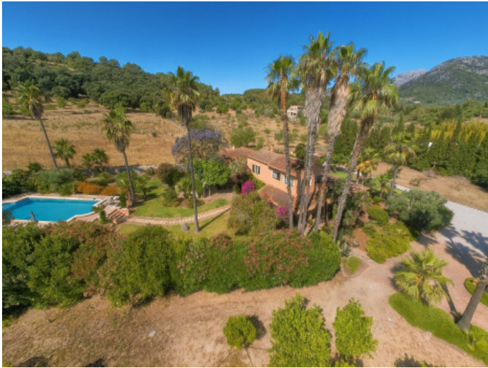
Vista aérea de propiedad con piscina y jardín