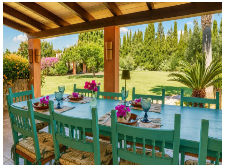
Terraza cubierta con mesa de comedor y vista al jardín

Toda la información como mejor se puede saber, salvo por error durante el periodo de venta. Sirva este documento como un informe previo, las bases legales solo serán válidas a través de un contrato de compra acordado ante Notario.