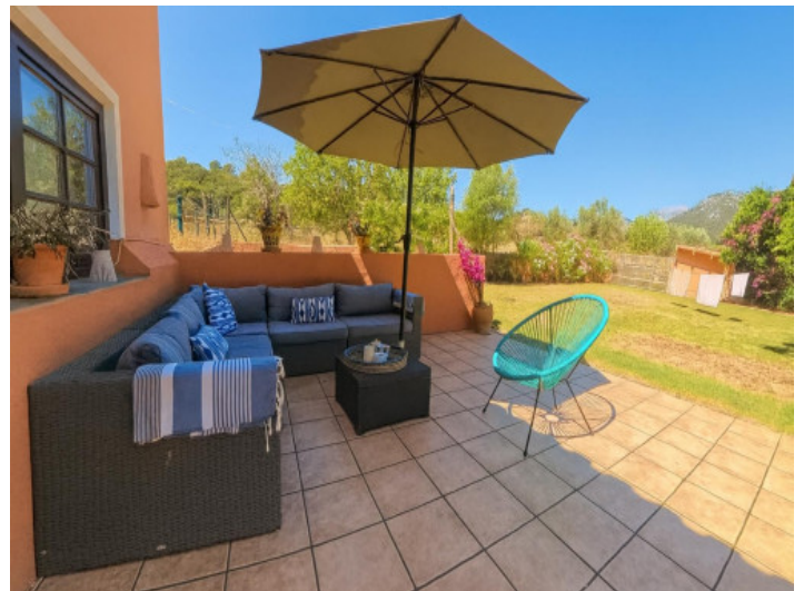
Terraza acogedora con vistas al jardín