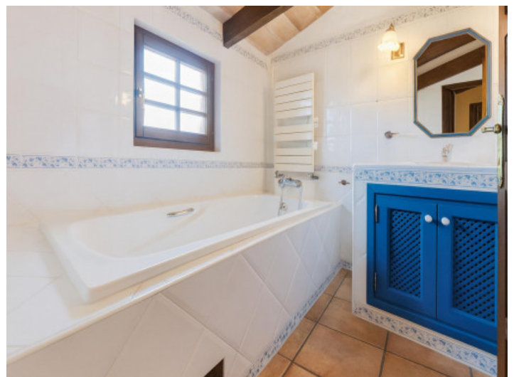
Baño con bañera y armario azul

Toda la información como mejor se puede saber, salvo por error durante el periodo de venta. Sirva este documento como un informe previo, las bases legales solo serán válidas a través de un contrato de compra acordado ante Notario.