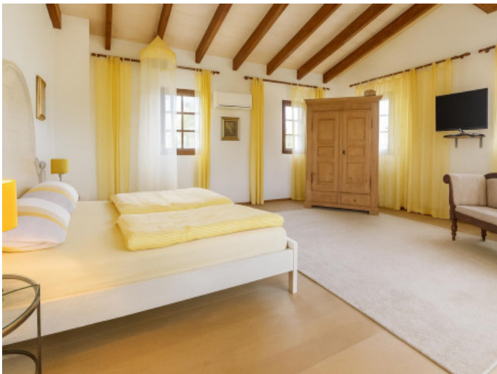
Dormitorio principal amplio y luminoso