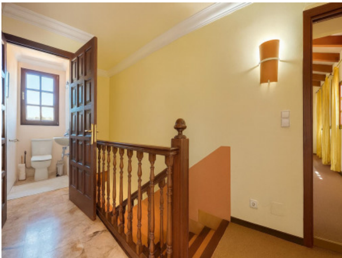
Distribuidor en primera planta con acceso a baño