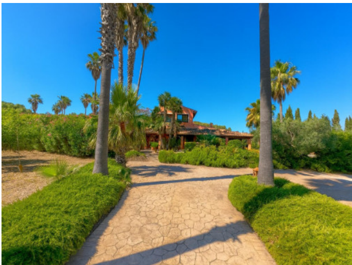
Entrada a casa con palmeras