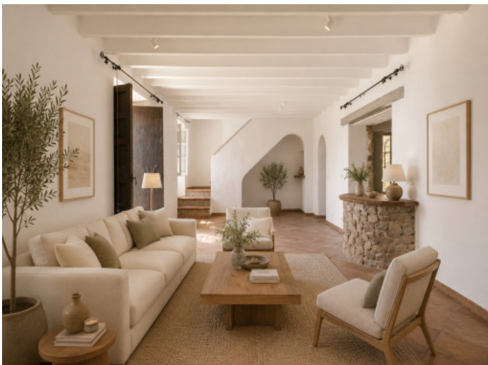
Imagen conceptual (IA)