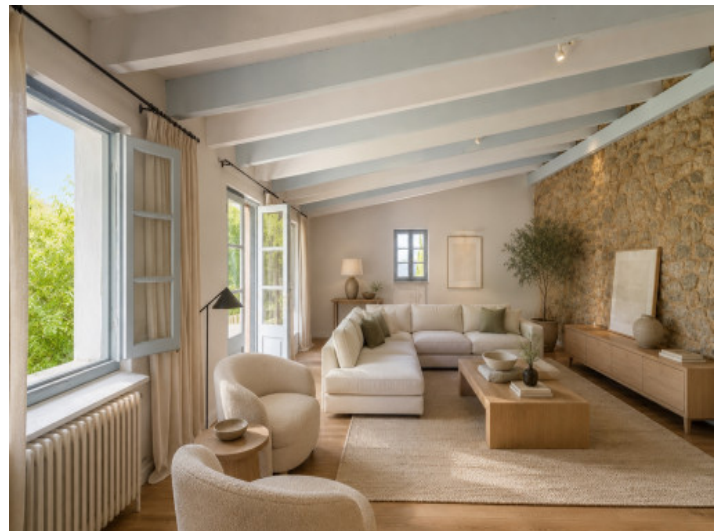
Imagen conceptual (IA)