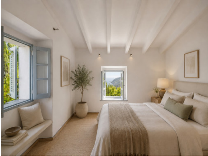
Imagen conceptual (IA)