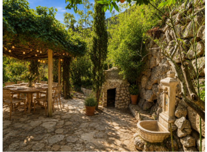
Imagen conceptual (IA)