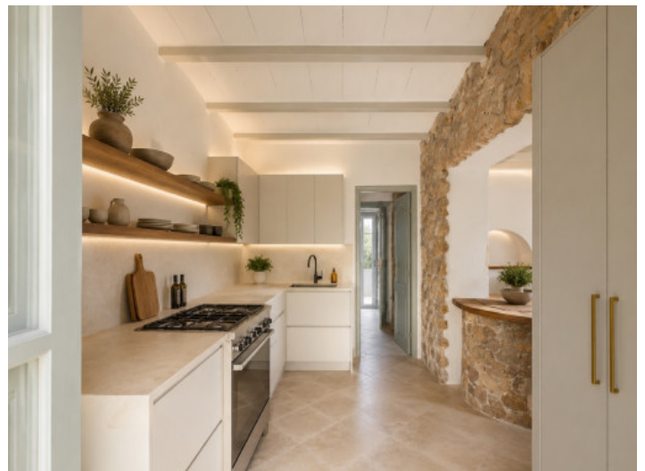
Imagen conceptual (IA)

Toda la información como mejor se puede saber, salvo por error durante el periodo de venta. Sirva este documento como un informe previo, las bases legales solo serán válidas a través de un contrato de compra acordado ante Notario.