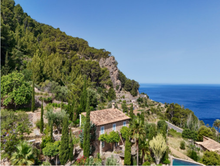
Terreno y vistas