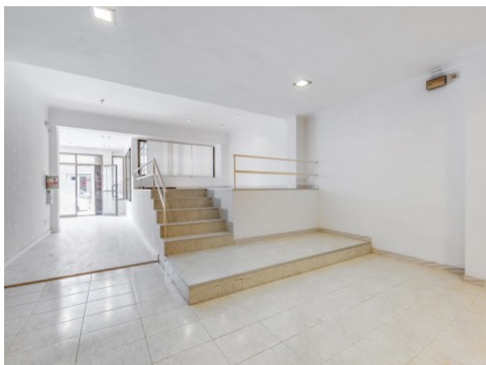
Entrada y vista interior