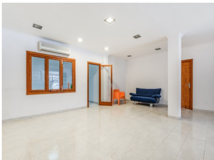
Acceso a otro cuarto