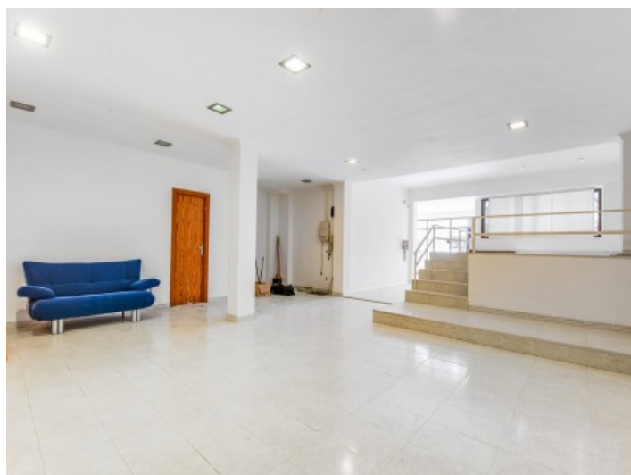
Superficie de 100 mq