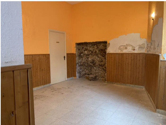
Sala de venta