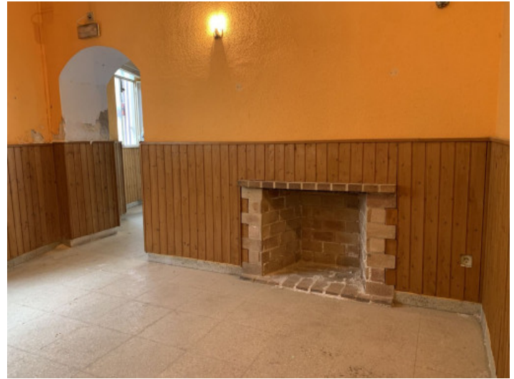
Sala de venta