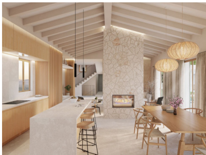
Cocina y comedor

Toda la información como mejor se puede saber, salvo por error durante el periodo de venta. Sirva este documento como un informe previo, las bases legales solo serán validas a traves de un contrato de compra acordado ante Notario.