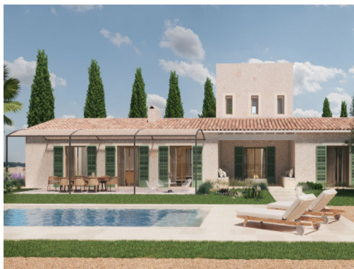
Vista al jardín