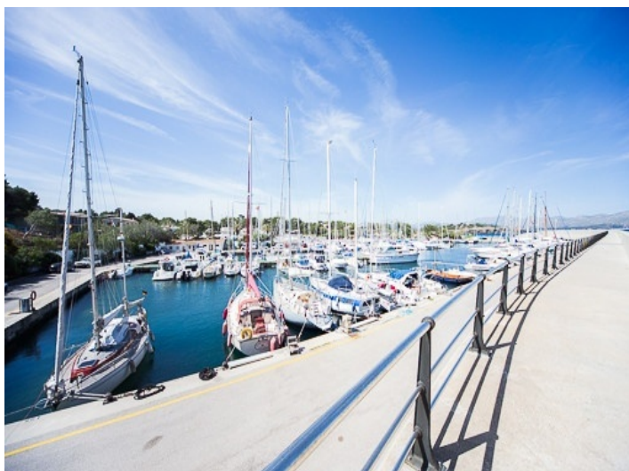
Solar para edificar de 1000 metros cuadrados