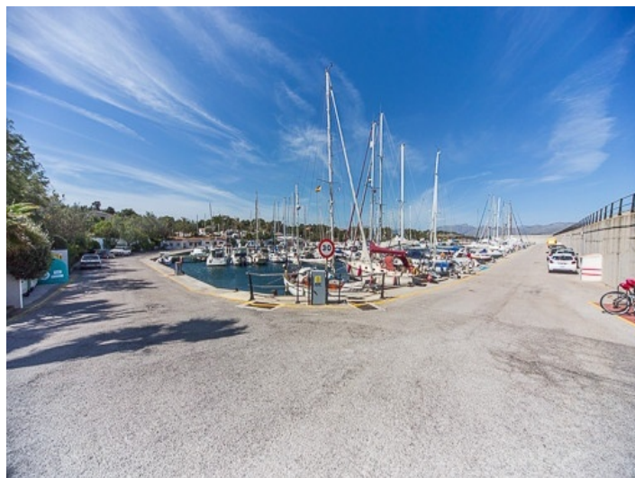
Terreno elevado con vistas al mar