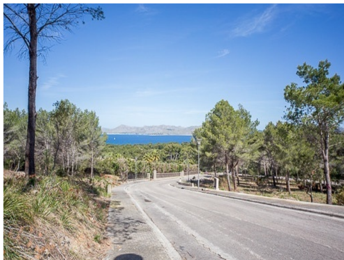
Espacioso solar en la urbanización de Bonaire