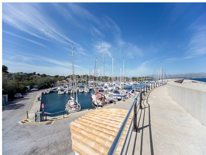
Puerto de Bonaire

Toda la información como mejor se puede saber, salvo por error durante el periodo de venta. Sirva este documento como un informe previo, las bases legales solo serán válidas a través de un contrato de compra acordado ante Notario.