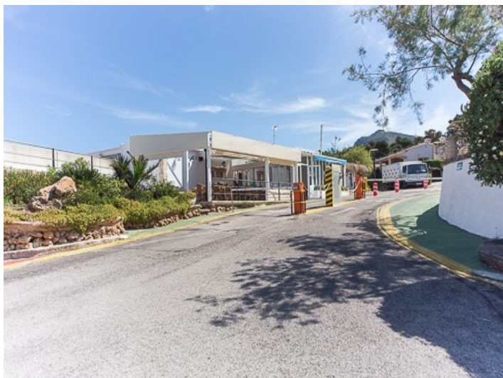
Acceso a la urbanización