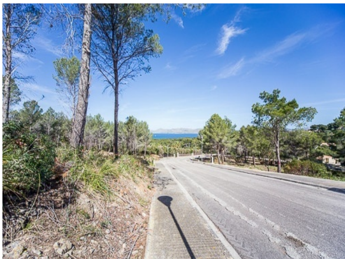
Impresionantes vistas al mar