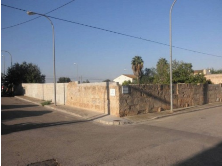
Vistas a la calle