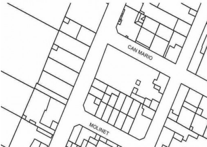
Vistas al terreno