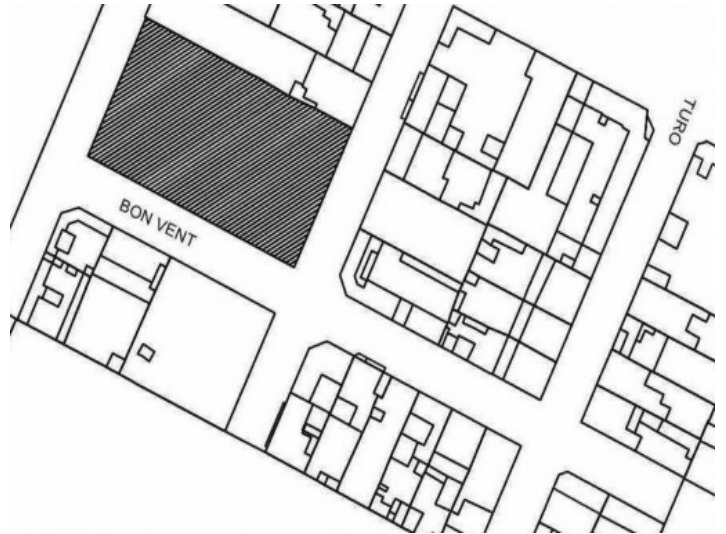
Plano del terreno