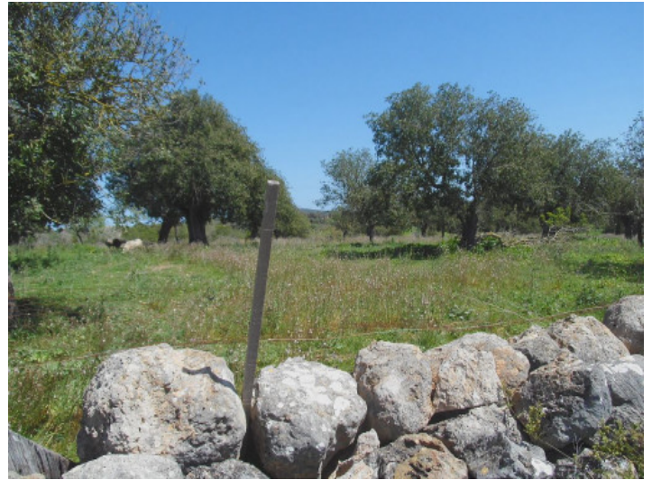
El terreno está situado en una bonita zona residencial