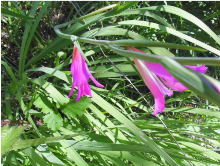
Hay varias plantas en el terreno