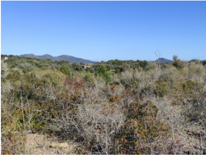
El terreno consta de 3 parcelas