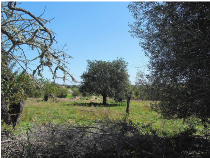
El terreno está situado en una ubicación tranquila