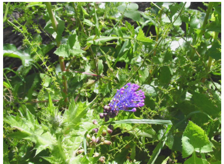
Terreno maravilloso y verde

Toda la información como mejor se puede saber, salvo por error durante el periodo de venta. Sirva este documento como un informe previo, las bases legales solo serán válidas a través de un contrato de compra acordado ante Notario.