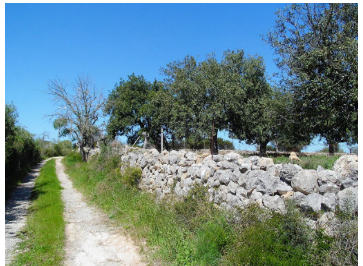
El terreno tiene un tamaño total de 19.500 metros cuadrados