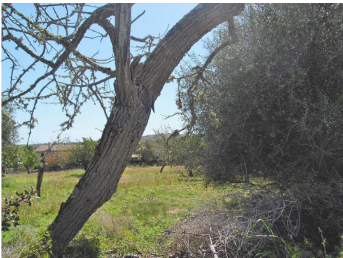
Se puede construir una casa familiar con 400 metros cuadrados