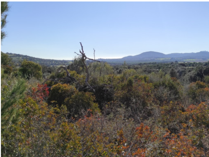
El terreno está rodeado por naturaleza