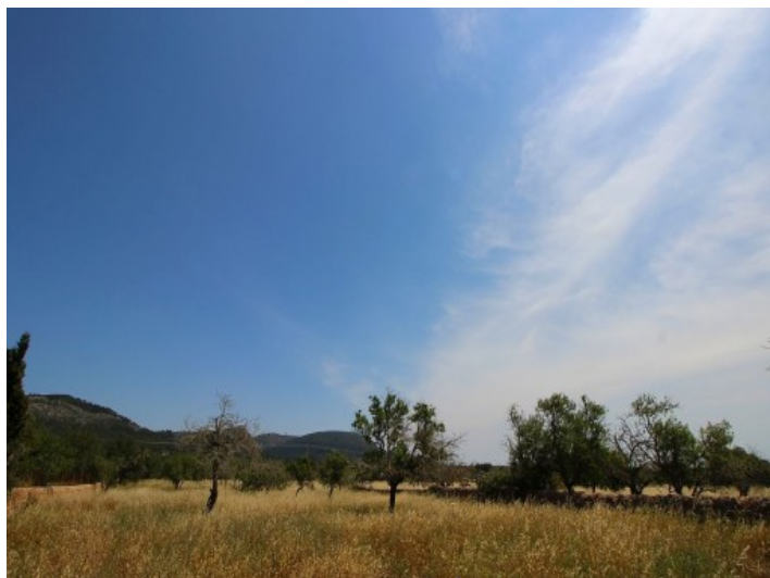
Vistas al Puig de Randa