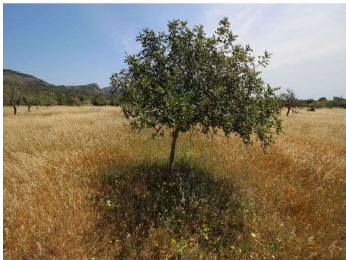
El solar tiene varios arboles de almendros y algarrobos