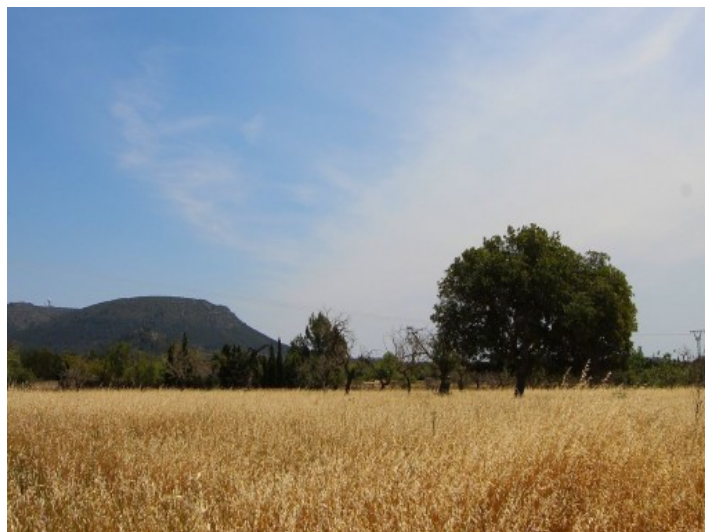
Terreno de 21.800 metros cuadrados