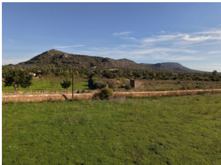
Vista a la montaña