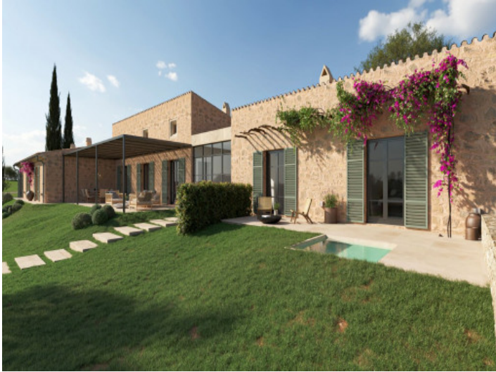
Finca de obra nueva proyectada en estilo mallorquín