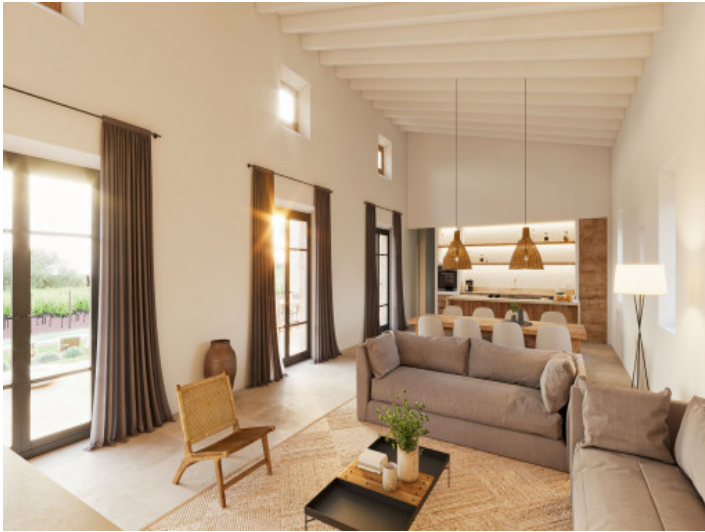
Salón con chimenea y acceso a la zona exterior