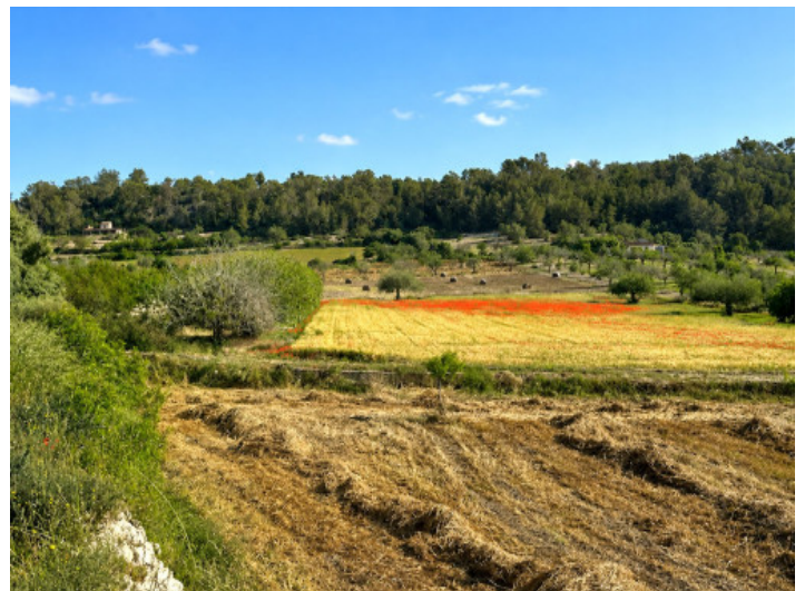
Amplio terreno de 15.900 qm con arbolado maduro

Toda la información como mejor se puede saber, salvo por error durante el periodo de venta. Sirva este documento como un informe previo, las bases legales solo serán válidas a través de un contrato de compra acordado ante Notario.