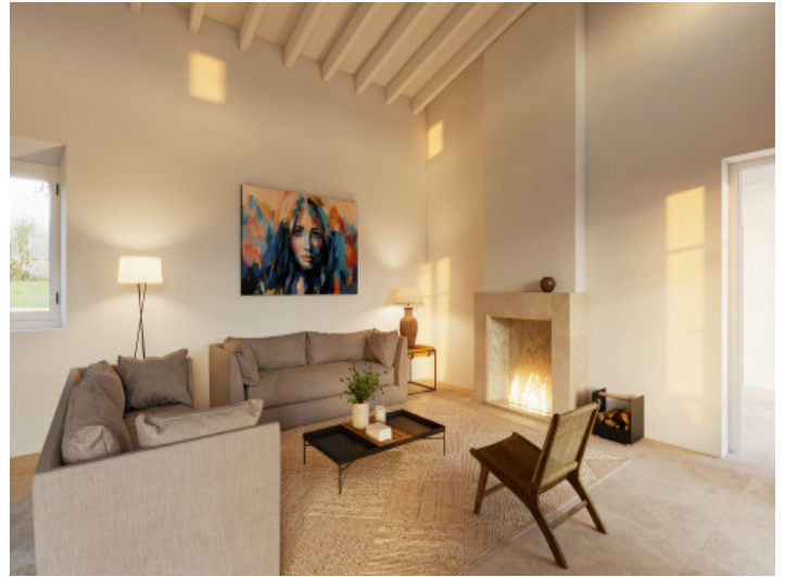
Salón con chimenea y acceso a la zona exterior