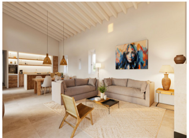
Luminoso salón con ambiente mediterráneo

Toda la información como mejor se puede saber, salvo por error durante el periodo de venta. Sirva este documento como un informe previo, las bases legales solo serán válidas a través de un contrato de compra acordado ante Notario.