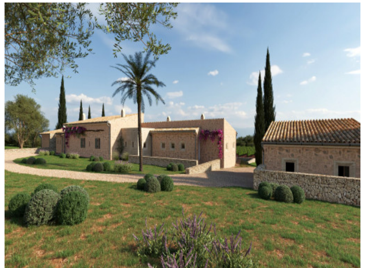
Vista exterior de la finca proyectada con jardín