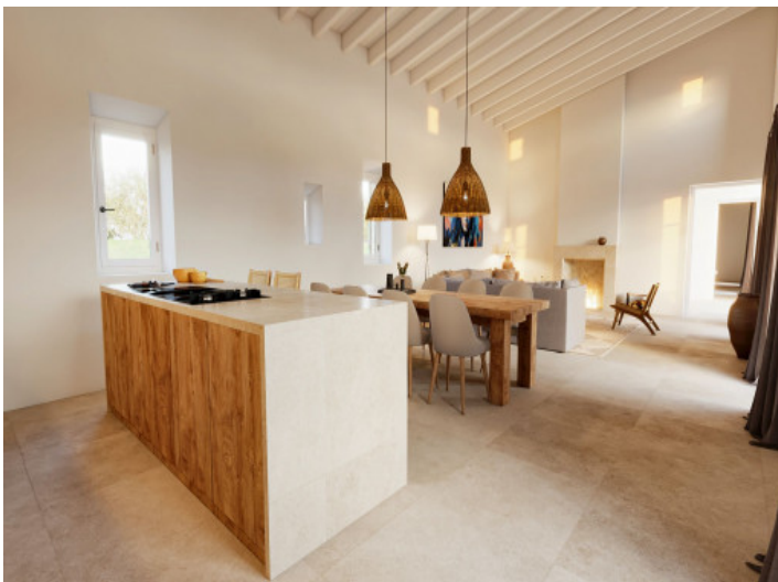
Cocina moderna con concepto abierto