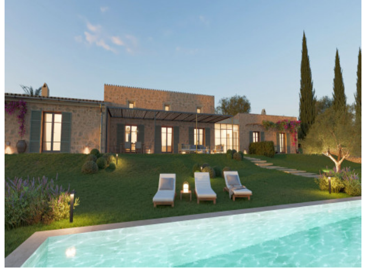
Proyecto de finca con piscina y jardín mediterráneo