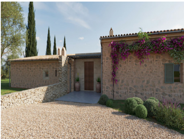
Acceso y zona de entrada del proyecto de finca