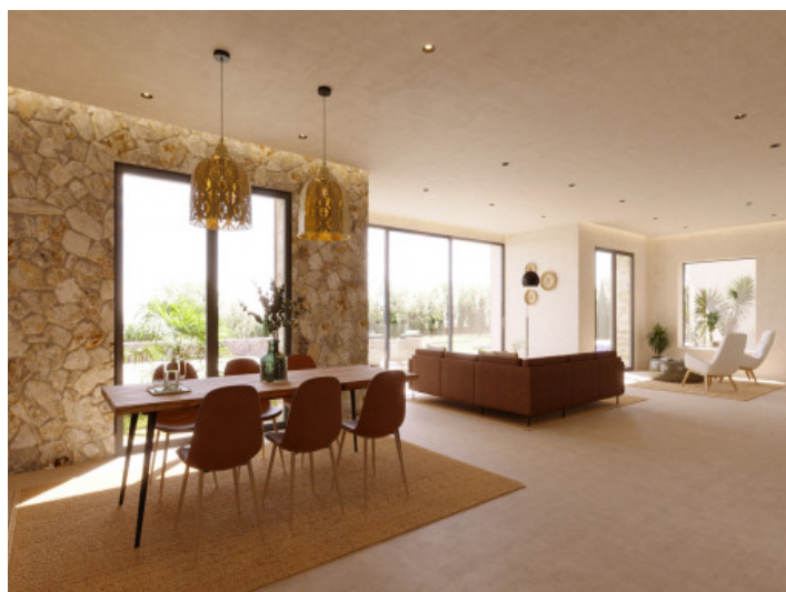
Visualizaciones interior y exterior