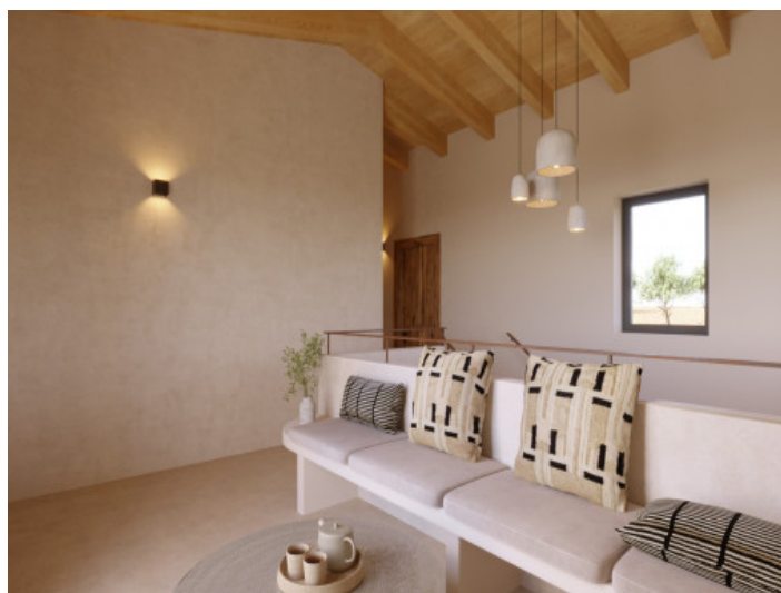
Visualizaciones interior y exterior