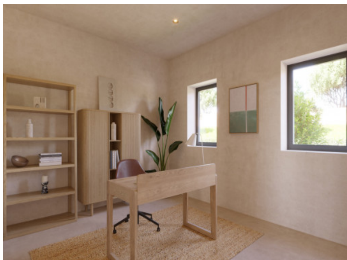
Visualizaciones interior y exterior