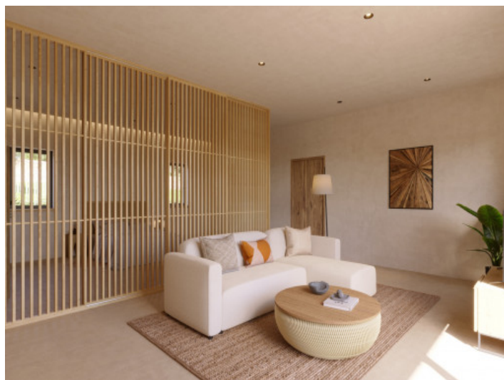
Visualizaciones interior y exterior

Toda la información como mejor se puede saber, salvo por error durante el periodo de venta. Sirva este documento como un informe previo, las bases legales solo serán válidas a través de un contrato de compra acordado ante Notario.