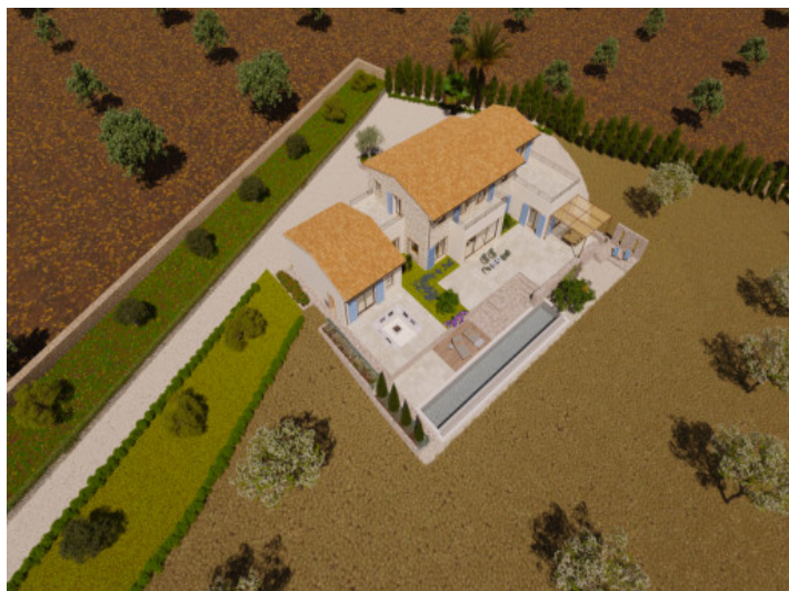
Visualications Inside and outside