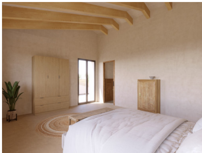
Visualizaciones interior y exterior