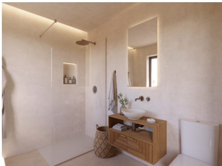
Visualizaciones interior y exterior