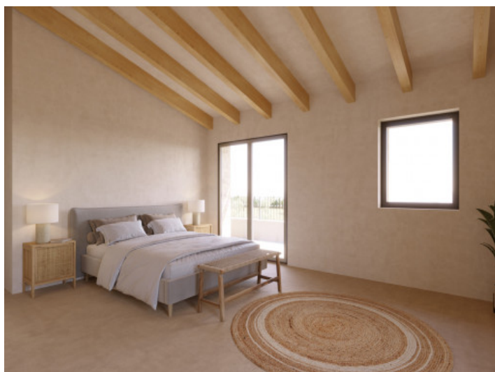
Visualizaciones interior y exterior