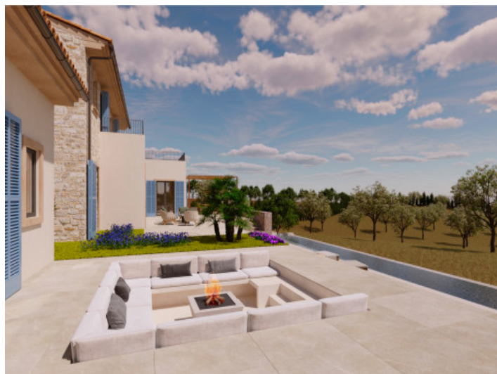
Visualizaciones interior y exterior