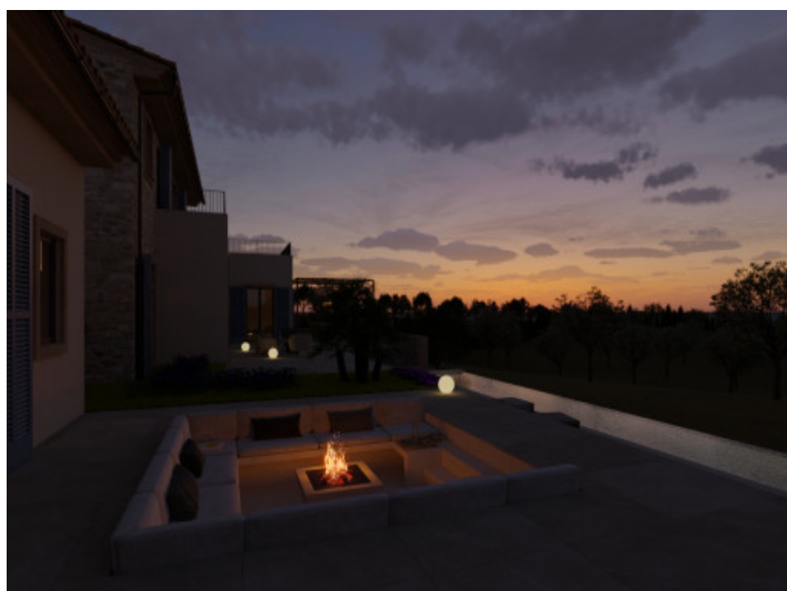
Visualizaciones interior y exterior