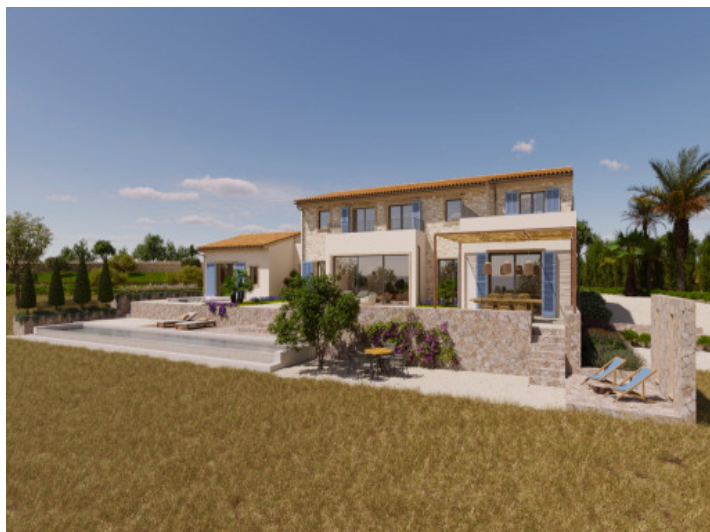
Visualizaciones interior y exterior