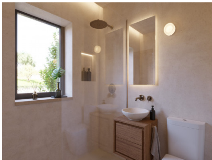
Visualizaciones interior y exterior

Toda la información como mejor se puede saber, salvo por error durante el periodo de venta. Sirva este documento como un informe previo, las bases legales solo serán válidas a través de un contrato de compra acordado ante Notario.