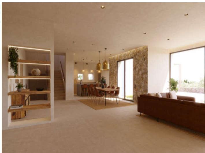
Visualizaciones interior y exterior