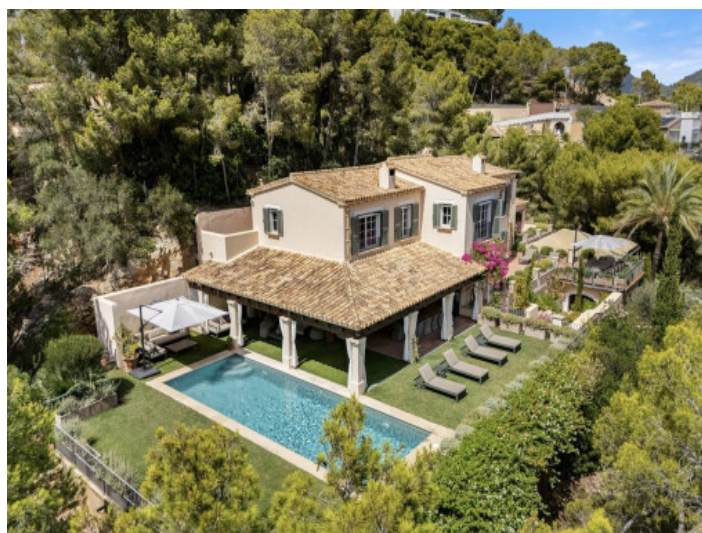
Vista exterior de la villa