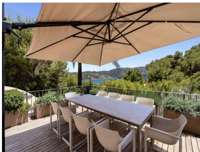
Terraza con vistas al mar