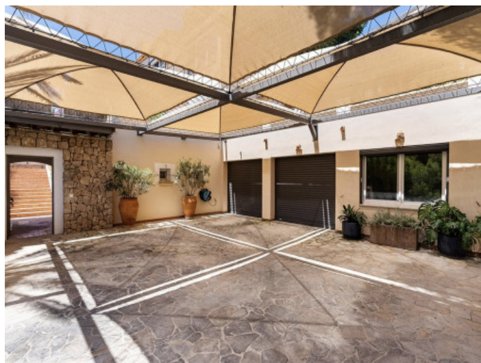
Entrada y garajes

Toda la información como mejor se puede saber, salvo por error durante el periodo de venta. Sirva este documento como un informe previo, las bases legales solo serán válidas a través de un contrato de compra acordado ante Notario.