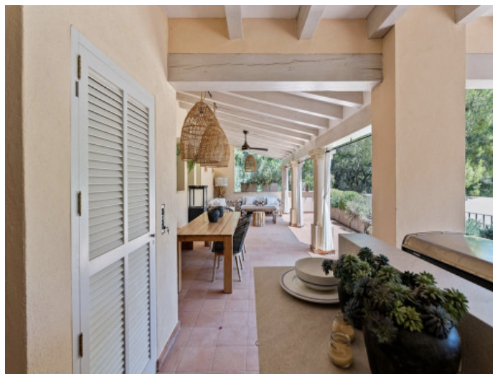
Una de las numerosas terrazas