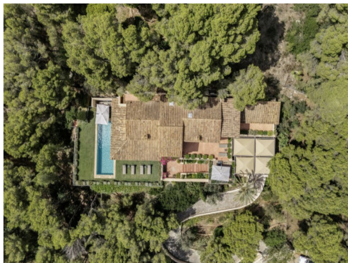
Vista aérea de la finca