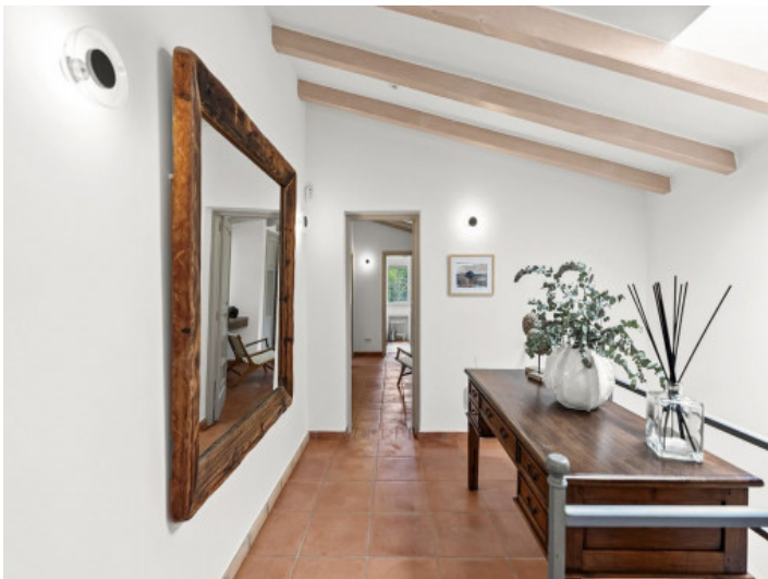
Pasillo de la planta superior