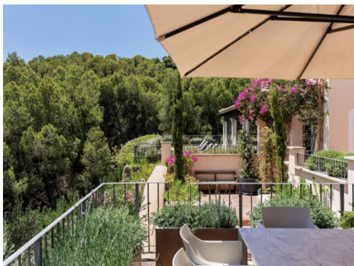
Vistas al entorno natural y privacidad