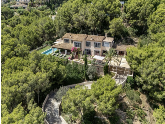
Vista exterior de la villa