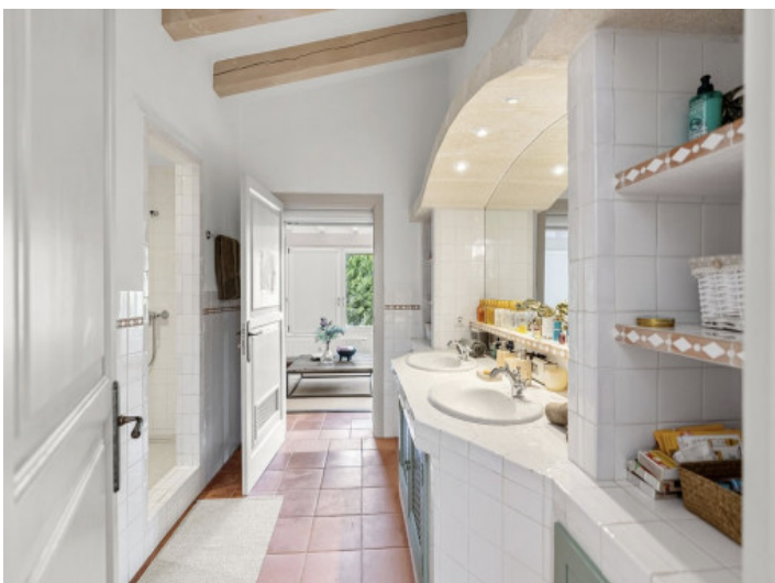
Uno de los cuatro baños