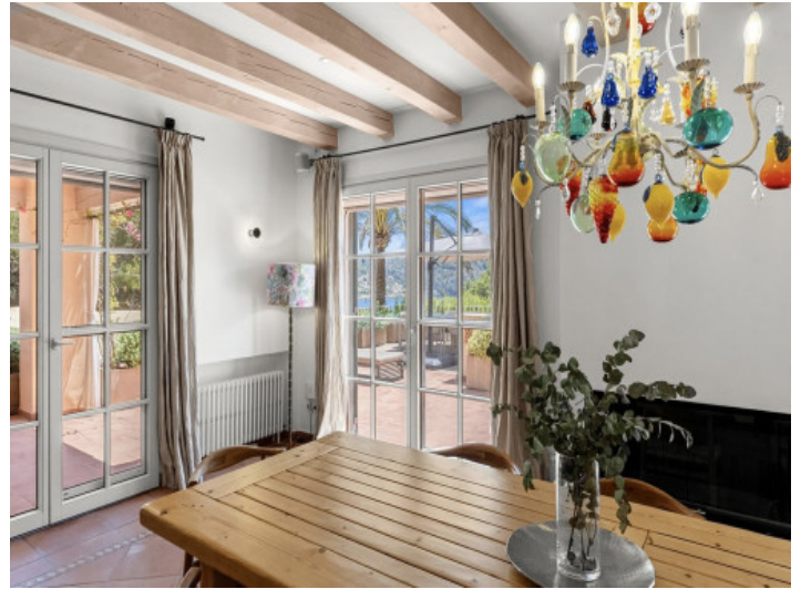
Comedor con vistas