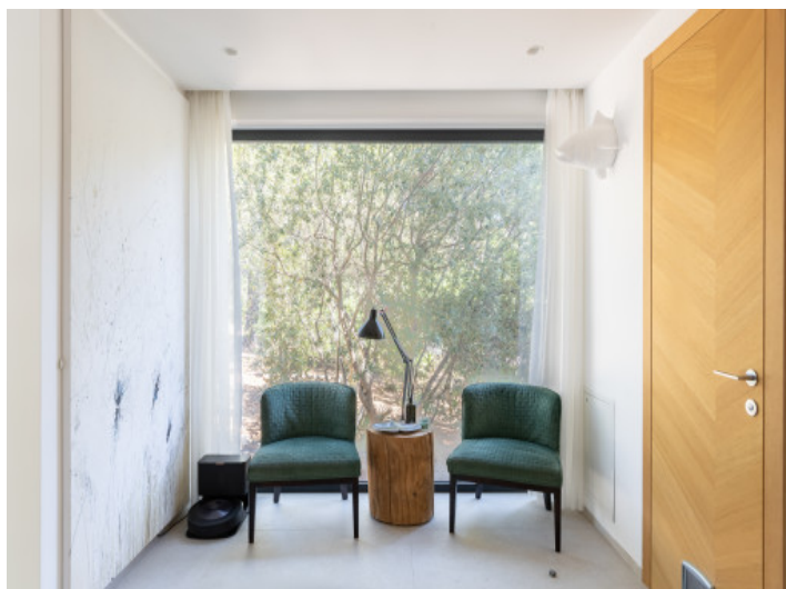
Área de estar acogedora