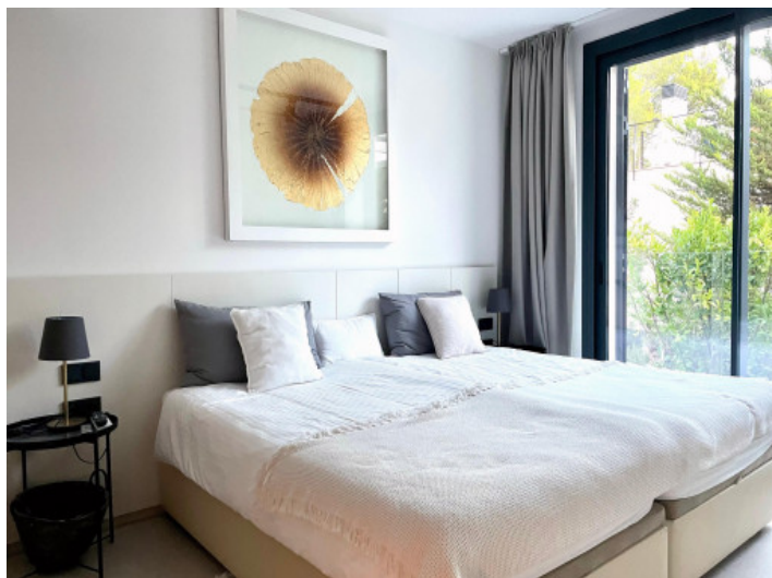
Casa de invitados