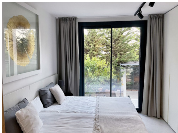
Casa de invitados

Toda la información como mejor se puede saber, salvo por error durante el periodo de venta. Sirva este documento como un informe previo, las bases legales solo serán válidas a través de un contrato de compra acordado ante Notario.