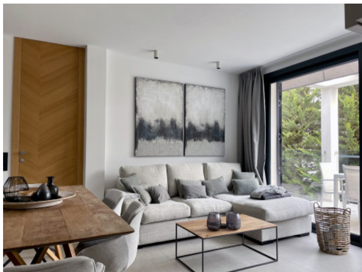
Oasis de jardín acogedor