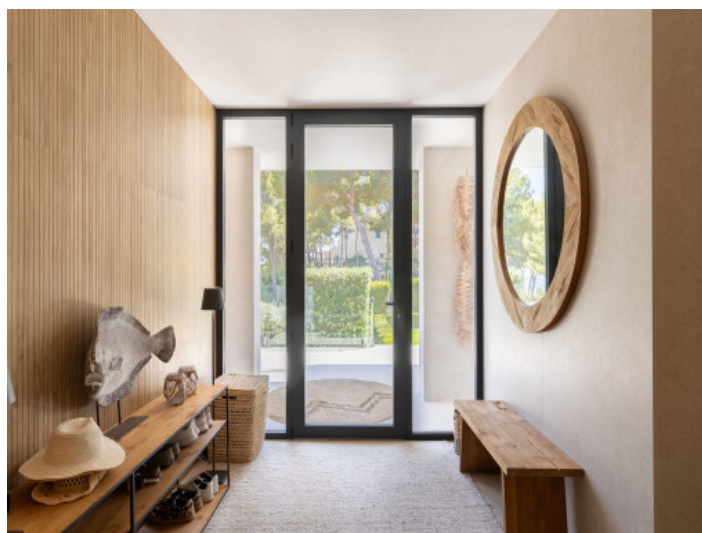
Zona de entrada