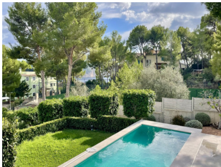
Casa de invitados