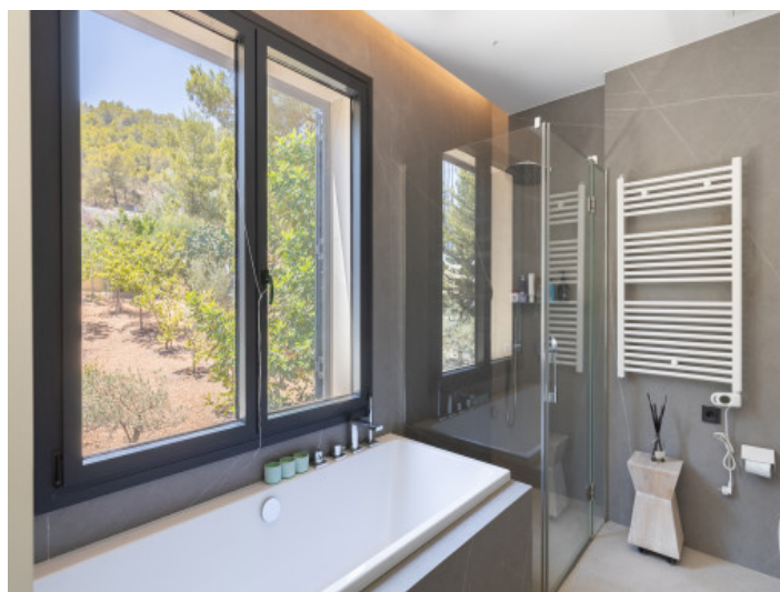
Baño moderno con bañera