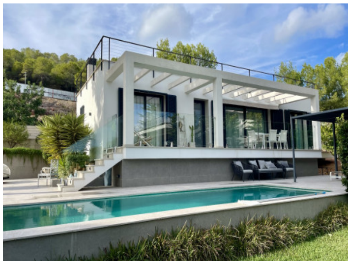
Casa de invitados