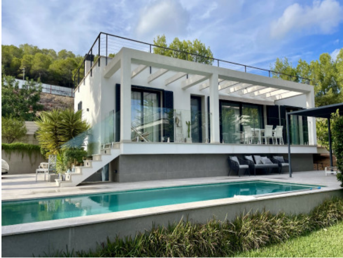
Sala de estar y comedor