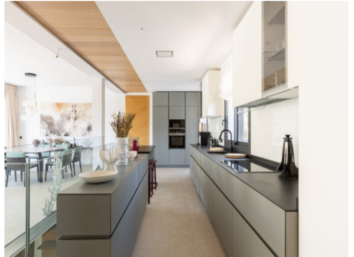
Cocina de alta calidad