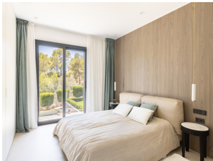
Uno de los 5 dormitorios de la casa principal