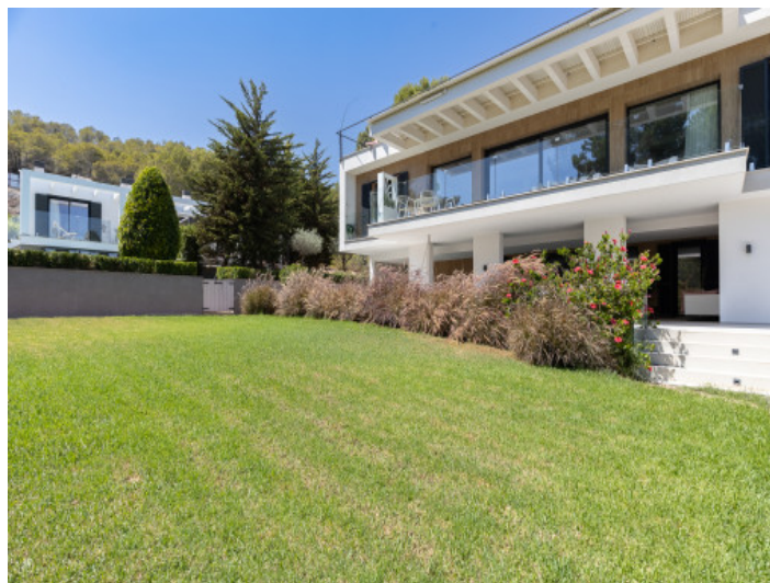
Jardín bien cuidado