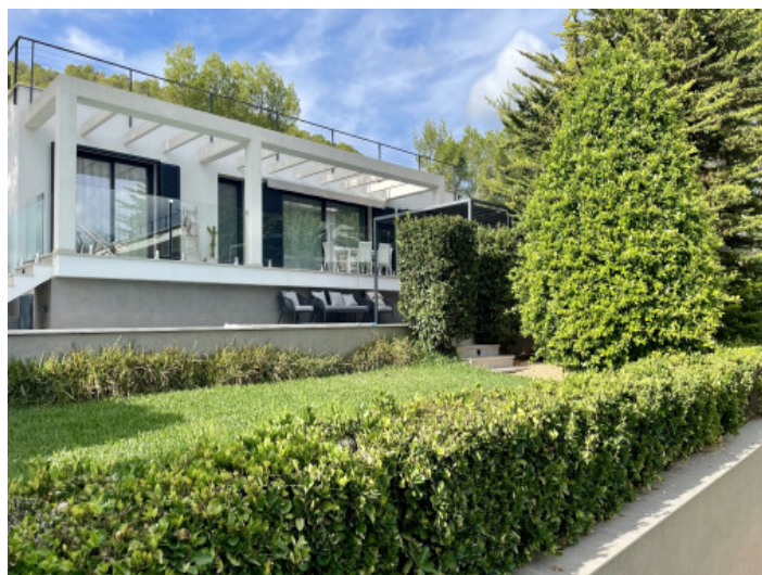
Casa de invitados

Toda la información como mejor se puede saber, salvo por error durante el periodo de venta. Sirva este documento como un informe previo, las bases legales solo serán válidas a través de un contrato de compra acordado ante Notario.