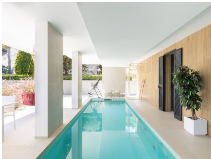
Piscina cubierta casa principal