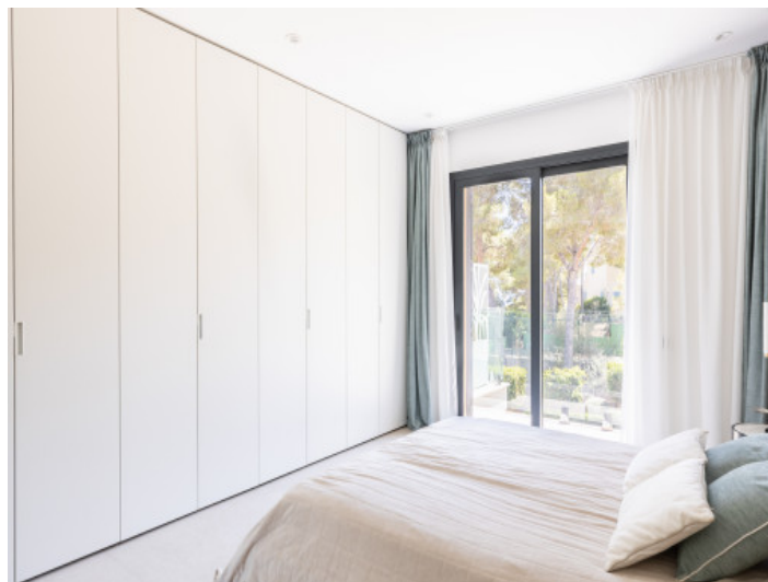
Uno de los dormitorios con armarios empotrados