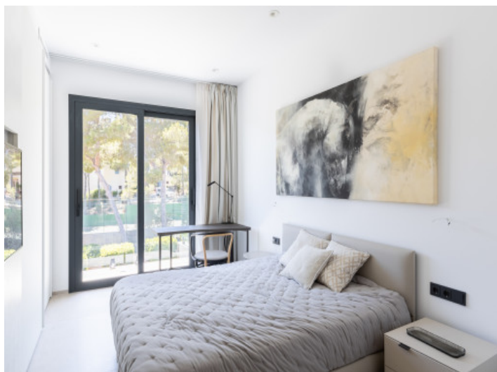
Uno de los dormitorios