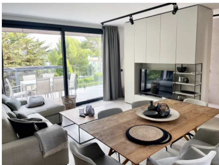
Casa de invitados