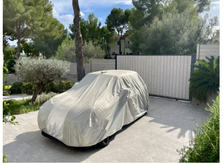
Cocina integrada con sala de estar