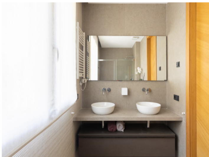
Aseo de invitados