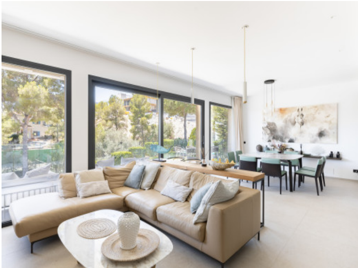
Sala de estar luminosa con ventanas de suelo a techo