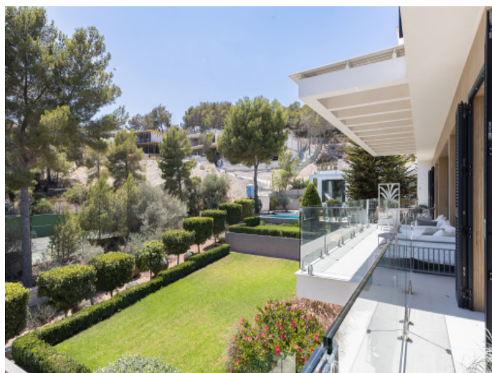
Jardín bien cuidado