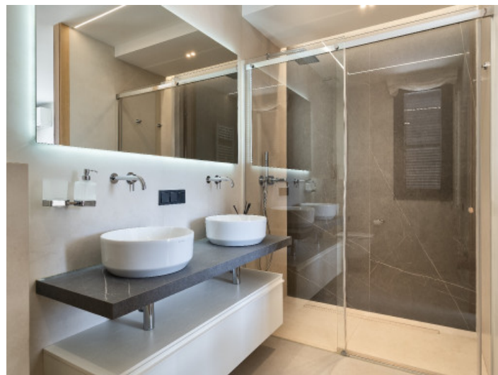
Casa de invitados