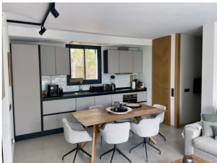
Casa de invitados