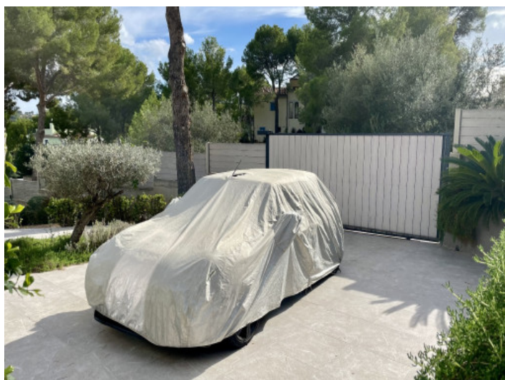
Casa de invitados

Toda la información como mejor se puede saber, salvo por error durante el periodo de venta. Sirva este documento como un informe previo, las bases legales solo serán válidas a través de un contrato de compra acordado ante Notario.