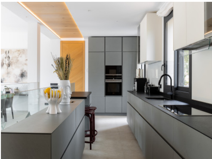
Cocina abierta de diseño