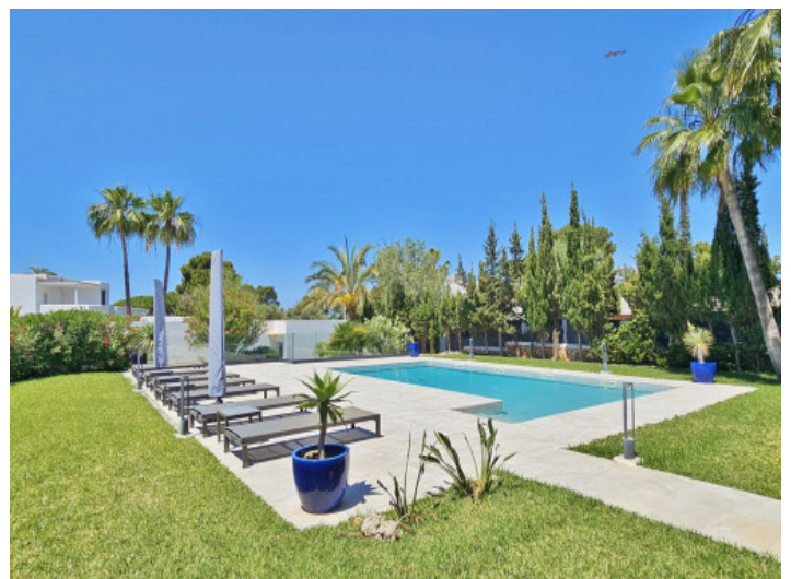
Piscina y Jardín

Toda la información como mejor se puede saber, salvo por error durante el periodo de venta. Sirva este documento como un informe previo, las bases legales solo serán válidas a través de un contrato de compra acordado ante Notario.