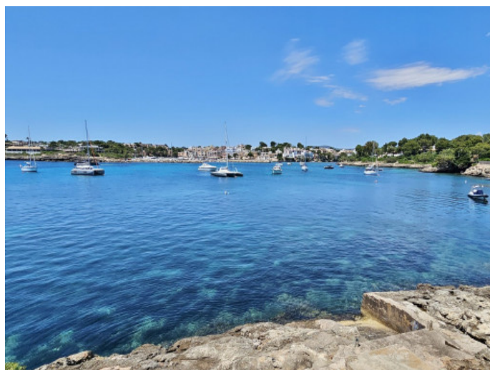
El mar está a solo unos metros de distancia