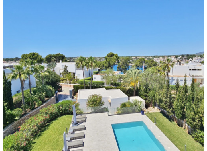
Piscina y Jardín