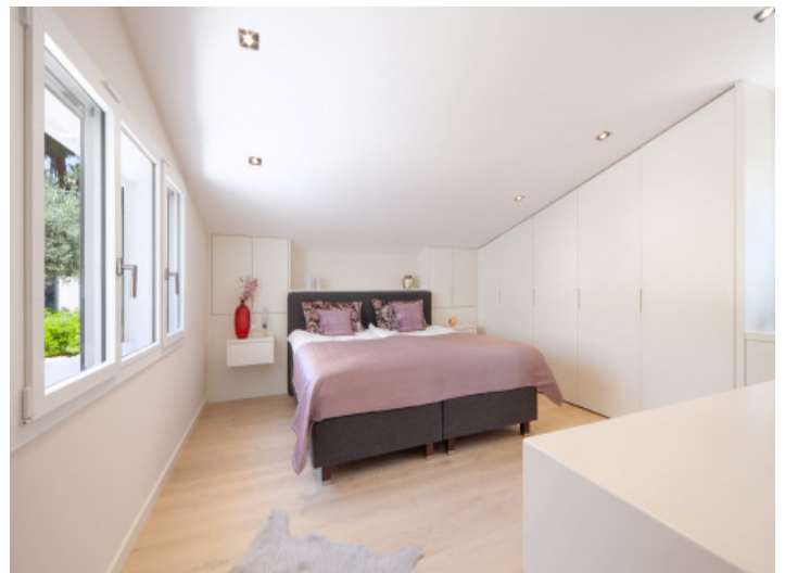
Uno de los 3 dormitorios

Toda la información como mejor se puede saber, salvo por error durante el periodo de venta. Sirva este documento como un informe previo, las bases legales solo serán válidas a través de un contrato de compra acordado ante Notario.