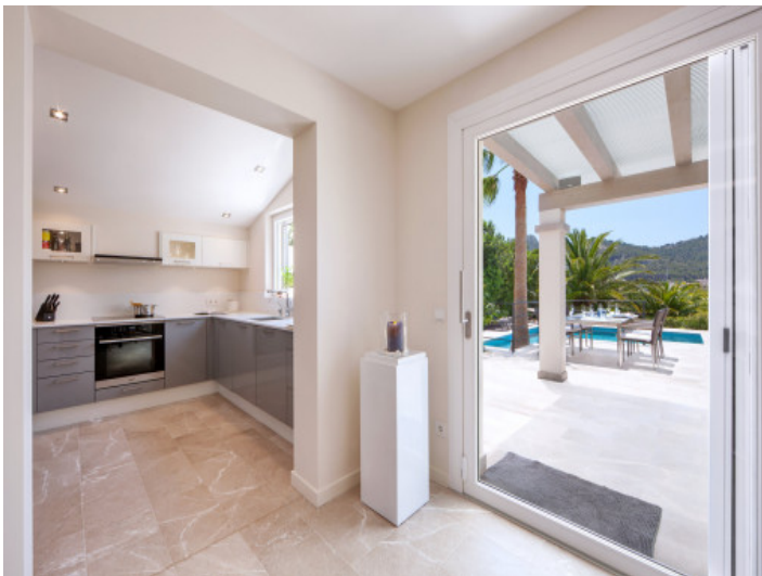
Zona de estar abierta