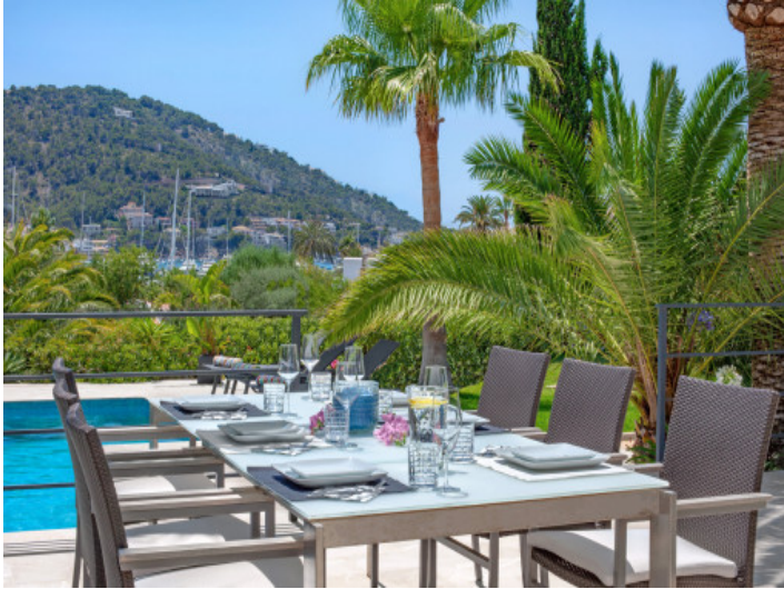
Piscina con vista al puerto