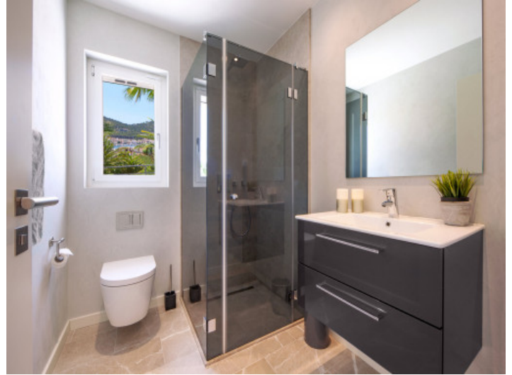
Uno de los 2 baños