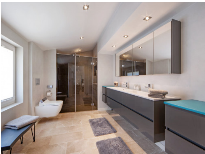
Uno de los 2 baños