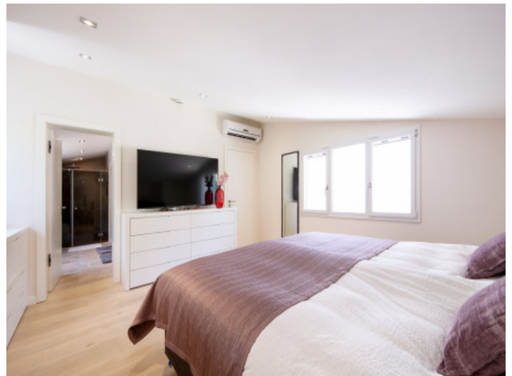
Uno de los 3 dormitorios