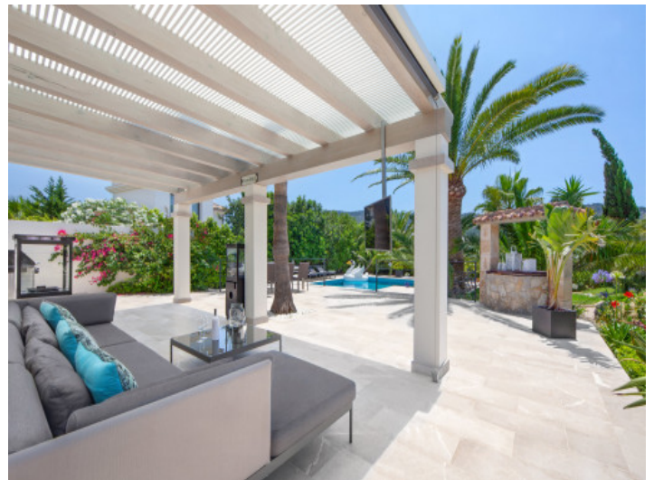
Terraza con vistas a la piscina