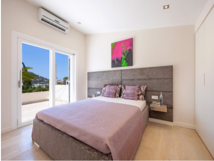
Uno de los 3 dormitorios