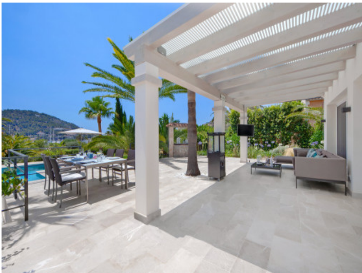
Terraza con vistas a la piscina