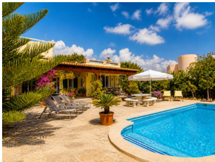
Gran piscina y terrazas justo al lado