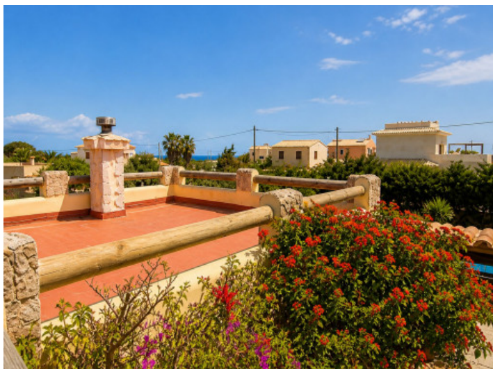
Varias terrazas en la azotea con vistas al mar