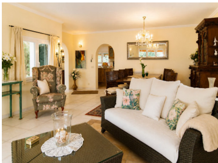
Sala de estar y comedor con chimenea