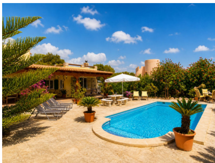
Terraza solárium justo al lado de la piscina

Toda la información como mejor se puede saber, salvo por error durante el periodo de venta. Sirva este documento como un informe previo, las bases legales solo serán validas a traves de un contrato de compra acordado ante Notario.