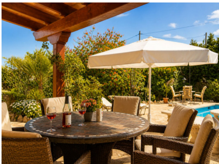
Terrazas cubiertas directamente adosadas a la casa