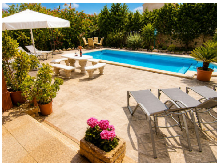
Terraza solárium justo al lado de la piscina