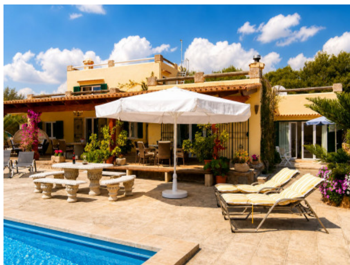
Terraza solárium justo al lado de la piscina