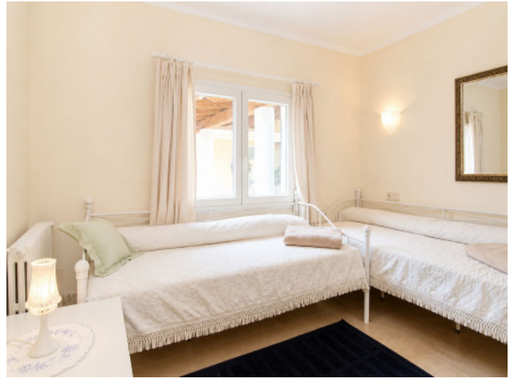
Tercer dormitorio en la planta baja