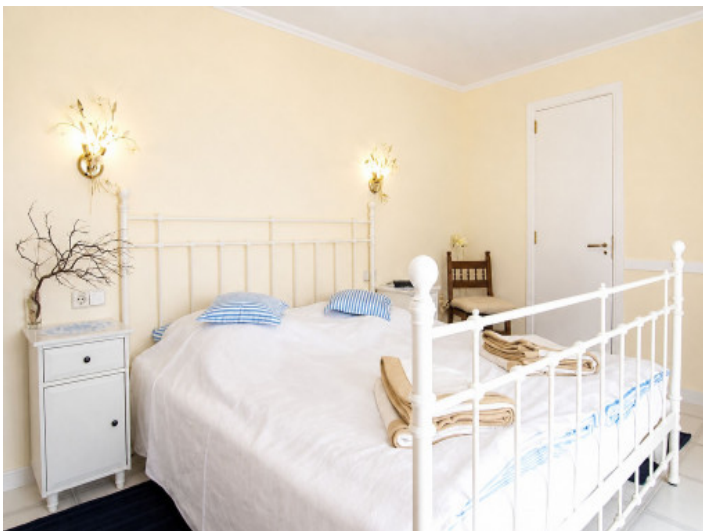
Dormitorio en la planta superior con acceso al balcón