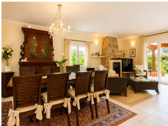
Sala de estar y comedor con chimenea