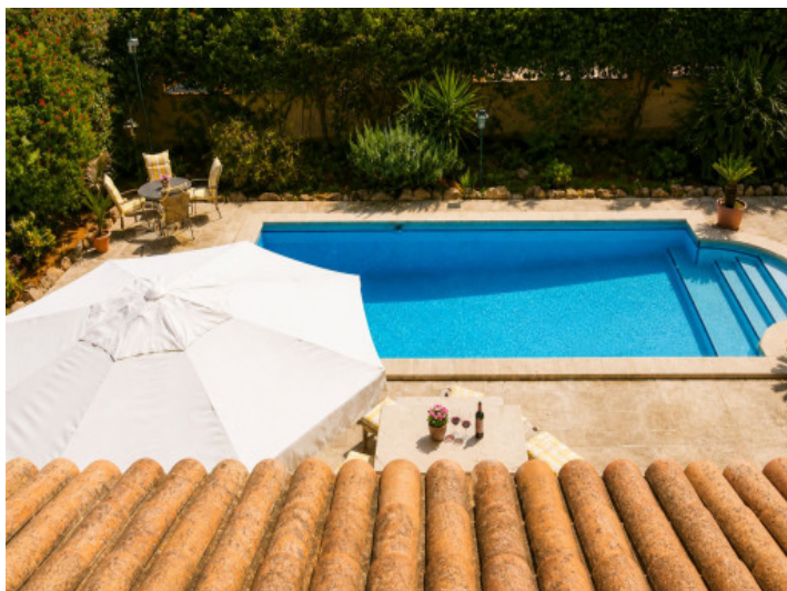
Vista de la piscina desde la terraza de la azotea