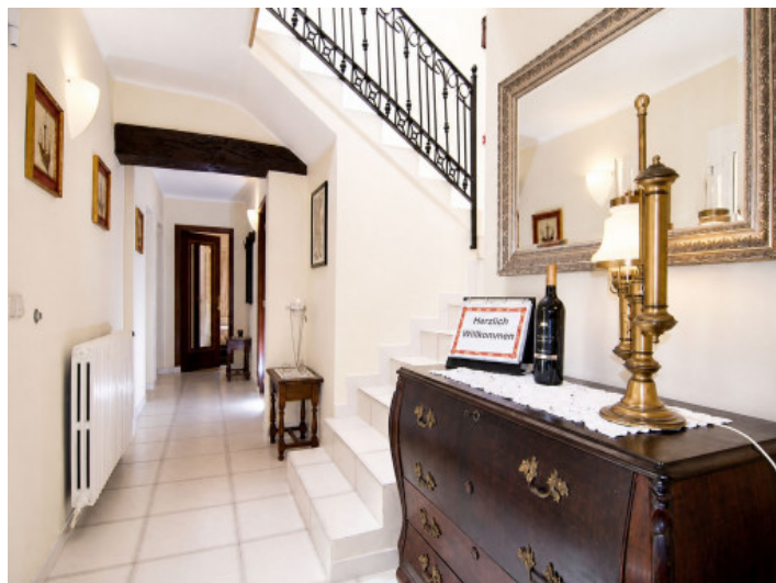
Hueco de escalera