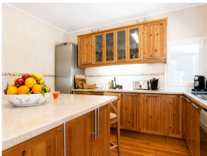
Cocina grande y moderna