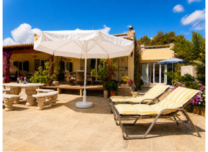
Terraza solárium justo al lado de la piscina