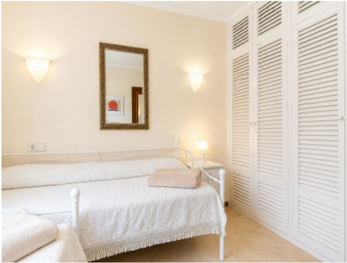
Tercer dormitorio en la planta baja