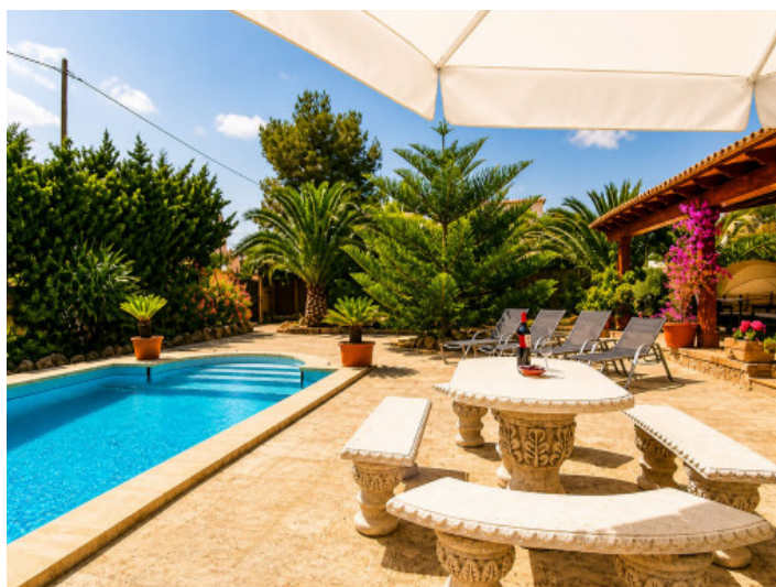
Terraza solárium justo al lado de la piscina