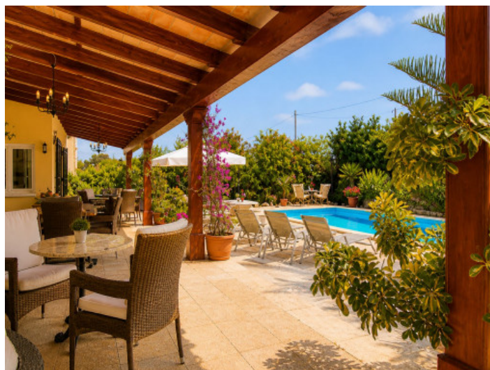
Terrazas cubiertas directamente adosadas a la casa

Toda la información como mejor se puede saber, salvo por error durante el periodo de venta. Sirva este documento como un informe previo, las bases legales solo serán válidas a través de un contrato de compra acordado ante Notario.