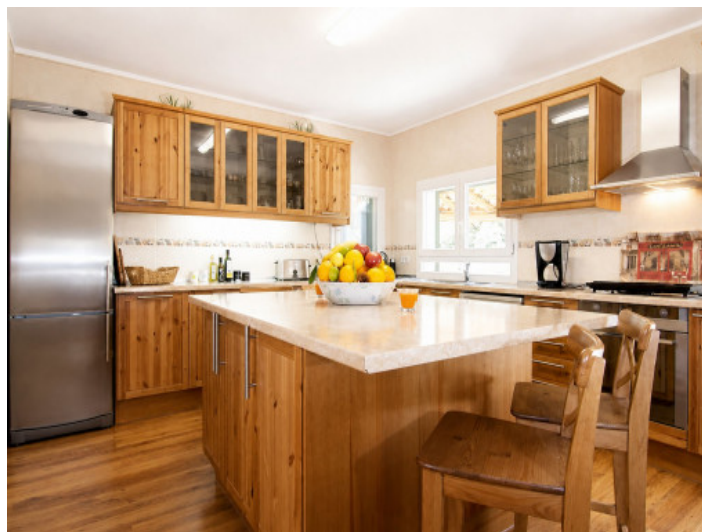
Cocina grande y moderna