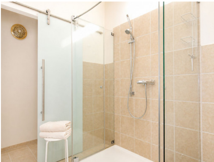
Baño con ducha grande en la planta baja