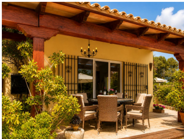
Terrazas cubiertas directamente adosadas a la casa