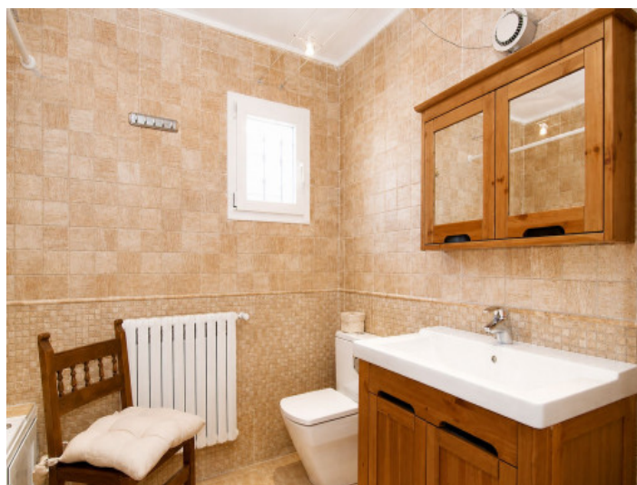
Baño con bañera en la planta baja