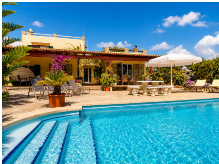
Gran piscina y terrazas justo al lado