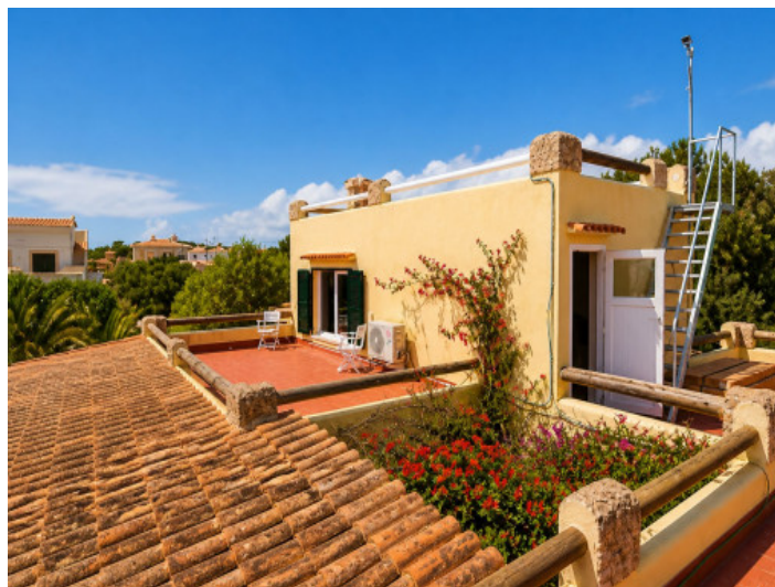
Varias terrazas en la azotea con vistas al mar