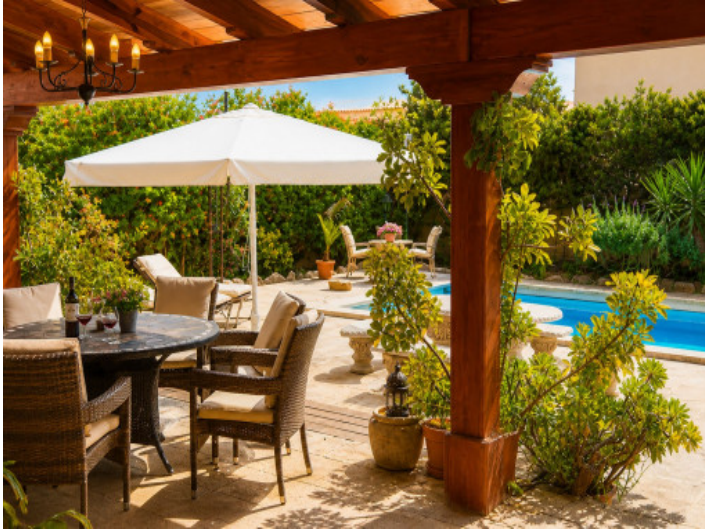
Terrazas cubiertas directamente adosadas a la casa