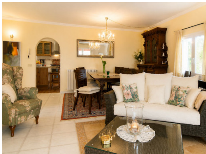
Sala de estar y comedor con chimenea

Toda la información como mejor se puede saber, salvo por error durante el periodo de venta. Sirva este documento como un informe previo, las bases legales solo serán válidas a través de un contrato de compra acordado ante Notario.