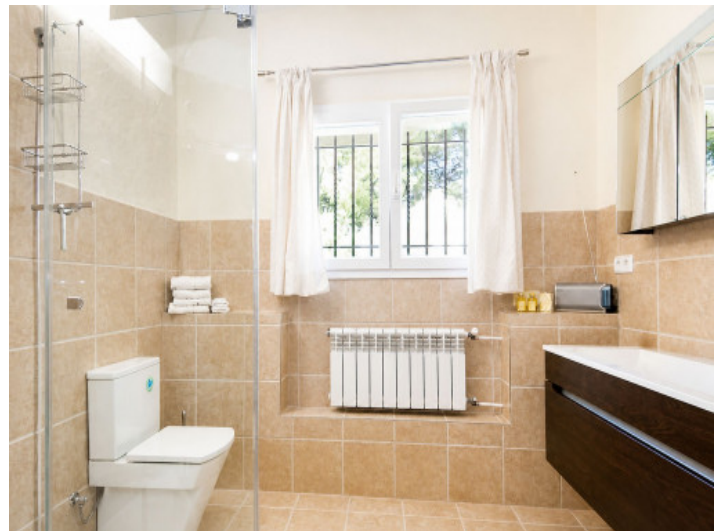
Baño con ducha grande en la planta baja