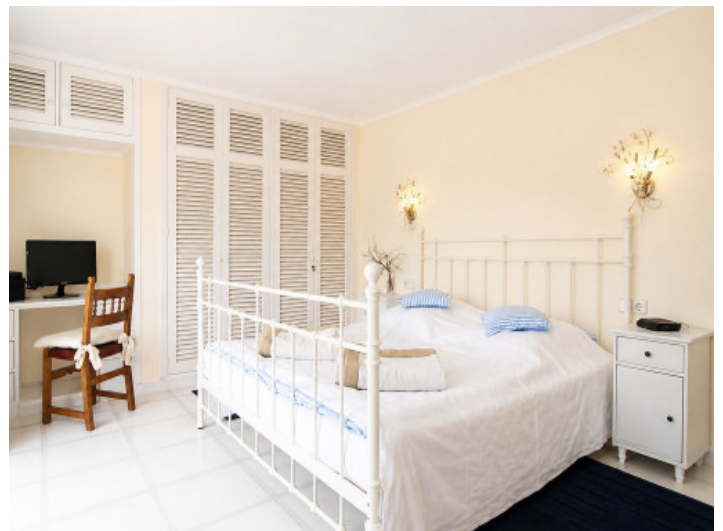
Dormitorio en la planta superior con acceso al balcón

Toda la información como mejor se puede saber, salvo por error durante el periodo de venta. Sirva este documento como un informe previo, las bases legales solo serán válidas a través de un contrato de compra acordado ante Notario.