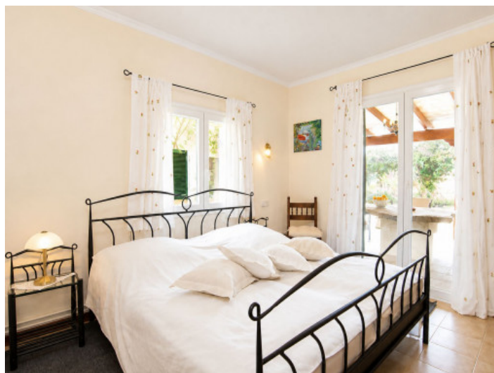
Segundo dormitorio en la planta baja

Toda la información como mejor se puede saber, salvo por error durante el periodo de venta. Sirva este documento como un informe previo, las bases legales solo serán válidas a través de un contrato de compra acordado ante Notario.