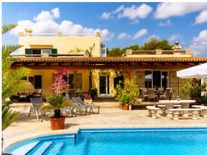
Gran piscina y terrazas justo al lado