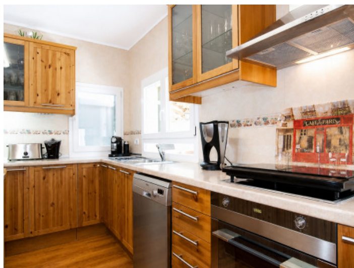
Cocina grande y moderna