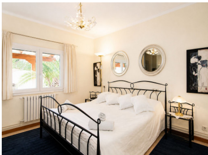
Primer dormitorio en la planta baja