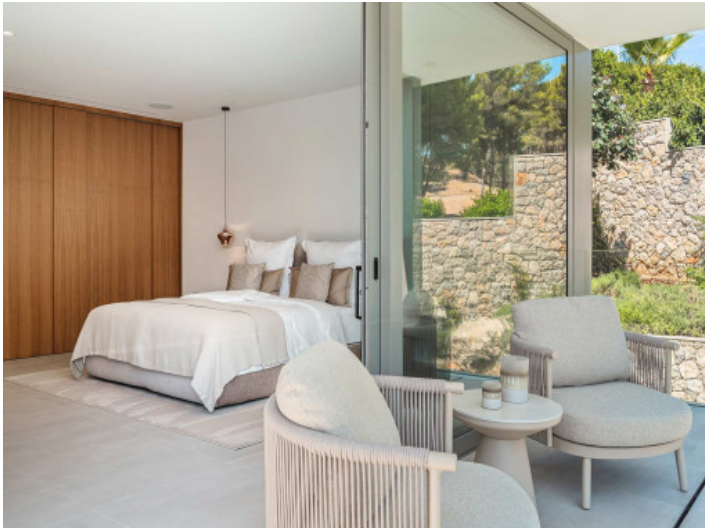
Una de las cuatro zonas de descanso con acceso directo a la terraza