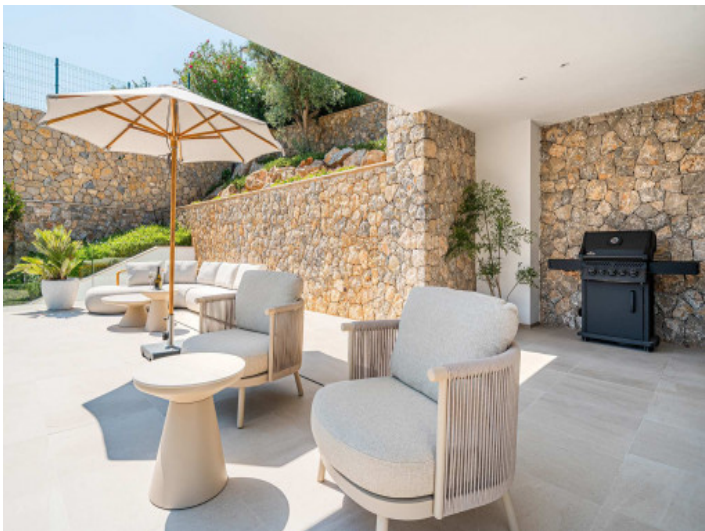
Terraza parcialmente cubierta