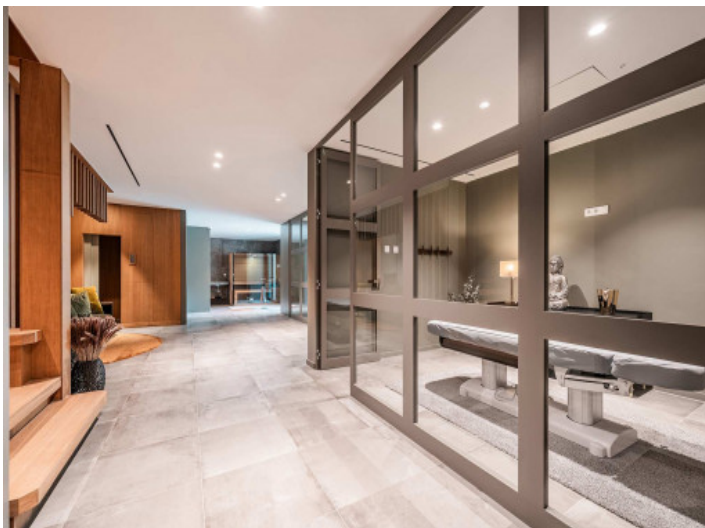
Zona de bienestar