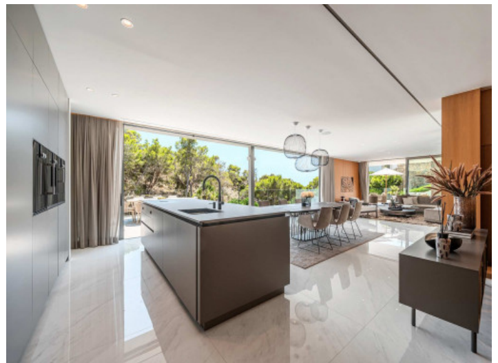
Cocina de alta calidad

Toda la información como mejor se puede saber, salvo por error durante el periodo de venta. Sirva este documento como un informe previo, las bases legales solo serán válidas a través de un contrato de compra acordado ante Notario.