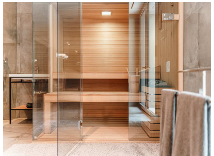
Zona de bienestar

Toda la información como mejor se puede saber, salvo por error durante el periodo de venta. Sirva este documento como un informe previo, las bases legales solo serán válidas a través de un contrato de compra acordado ante Notario.