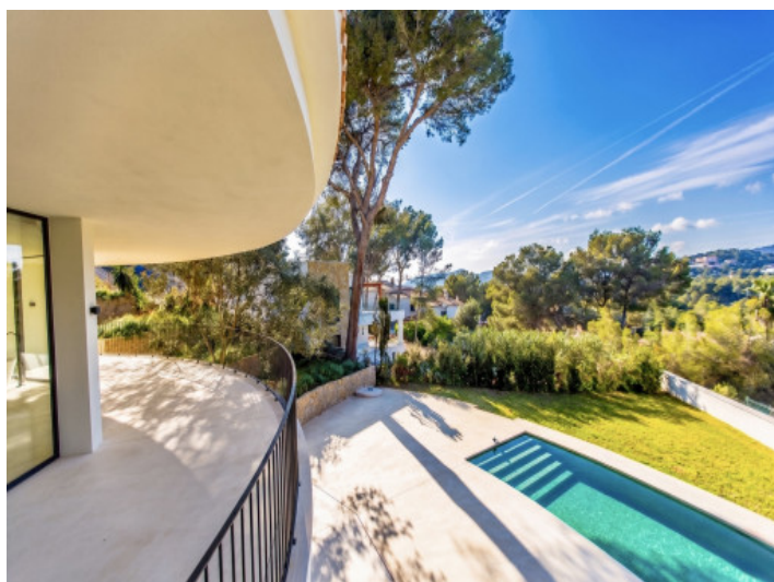
Vista idílica al verde