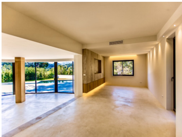
Zona de salón y comedor