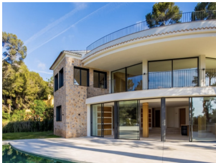
Villa de diseño