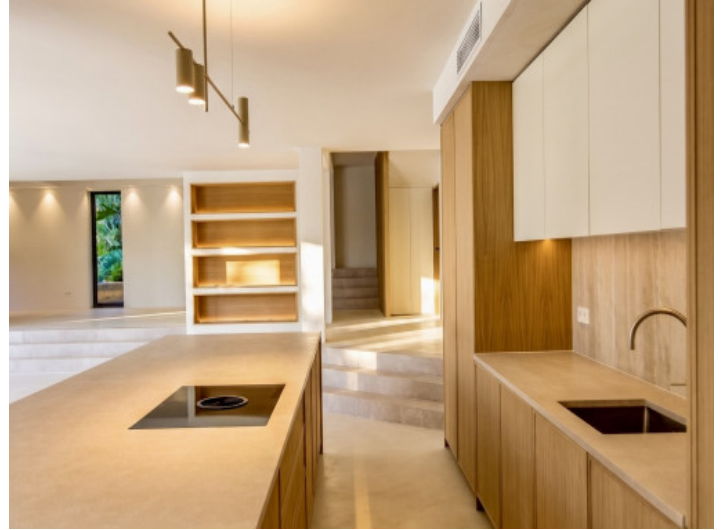
Cocina de diseño