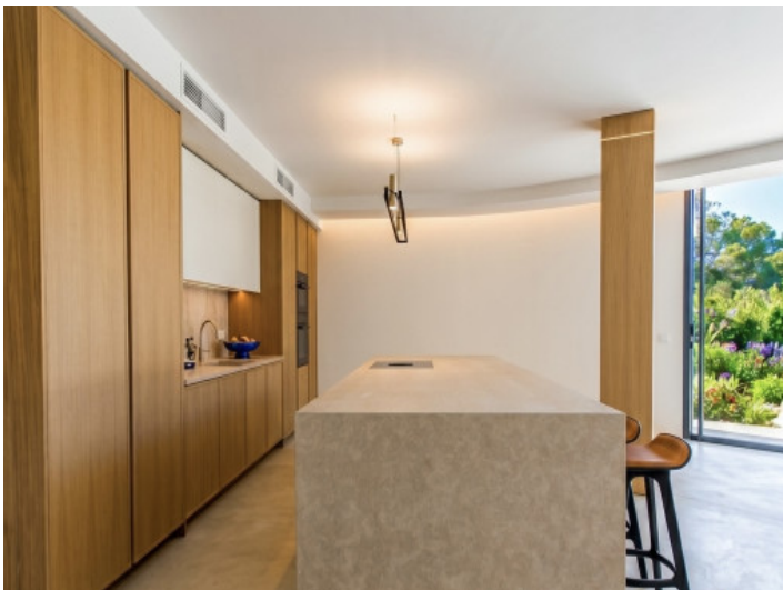
Cocina abierta con isla