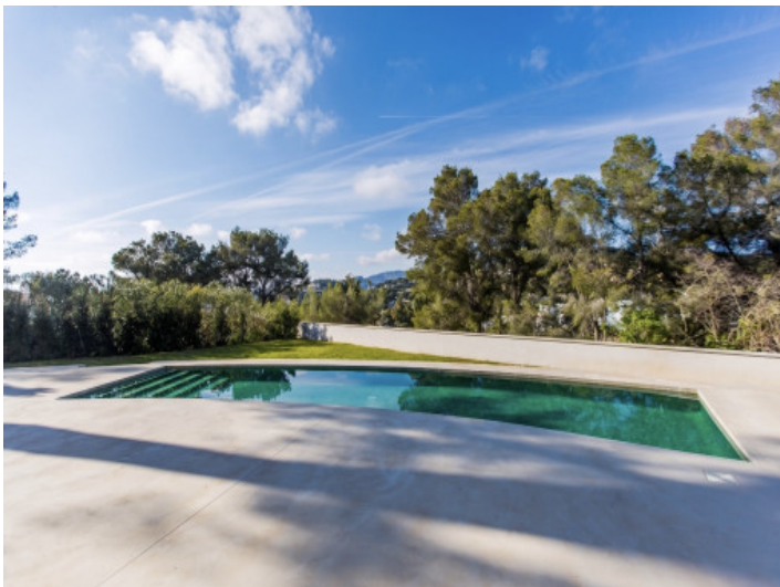
Amplia zona exterior