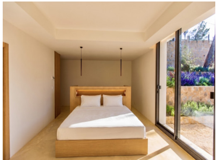
Dormitorio con acceso al jardín