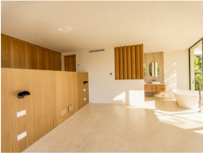
Dormitorio con baño en suite