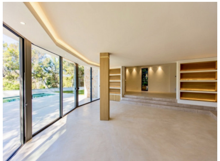
Zona abierta de salón y comedor

Toda la información como mejor se puede saber, salvo por error durante el periodo de venta. Sirva este documento como un informe previo, las bases legales solo serán válidas a través de un contrato de compra acordado ante Notario.