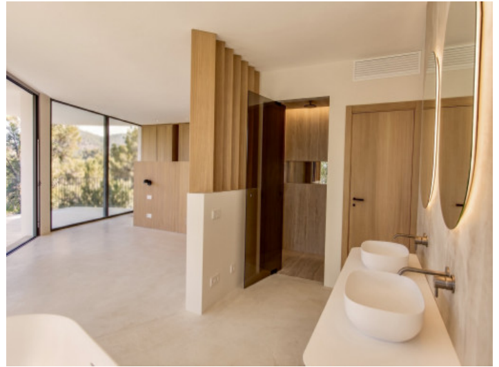
Dormitorio con baño en suite