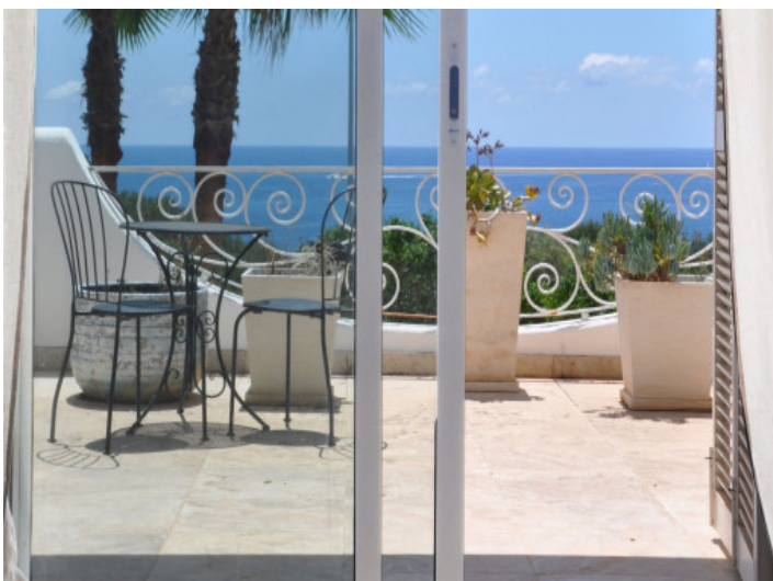
Terraza con vistas al mar y zona lounge exterior