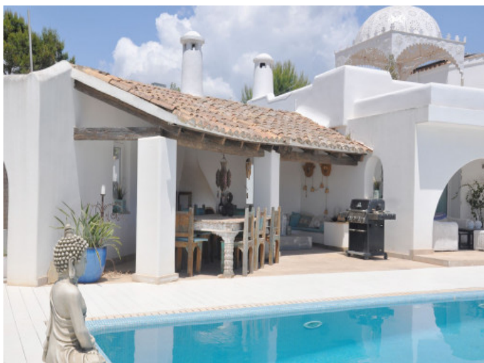
Zona cubierta de barbacoa y comedor exterior