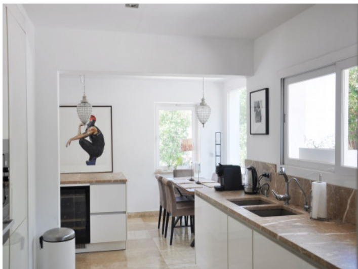
Cocina y omedor abierto con abundante luz natural