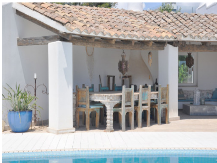
Zona cubierta de barbacoa y comedor exterior

Toda la información como mejor se puede saber, salvo por error durante el periodo de venta. Sirva este documento como un informe previo, las bases legales solo serán validas a traves de un contrato de compra acordado ante Notario.