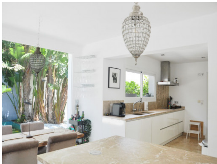
Cocina y omedor abierto con abundante luz natural