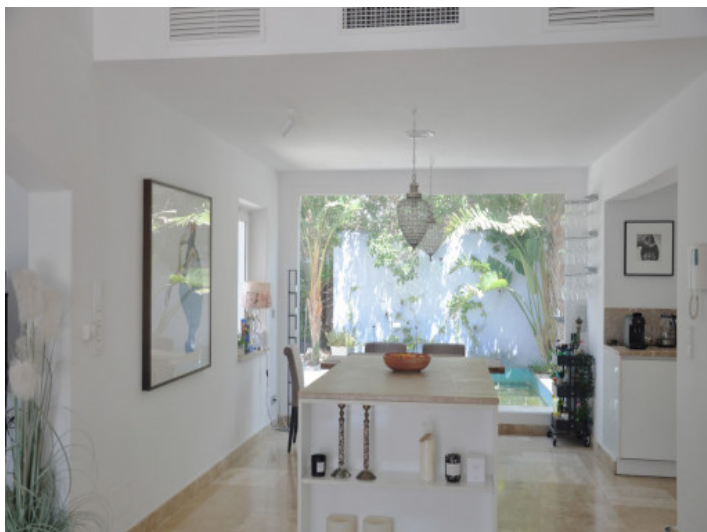
Cocina y omedor abierto con abundante luz natural