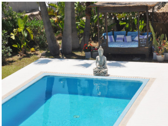
Piscina privada de agua salada con solárium