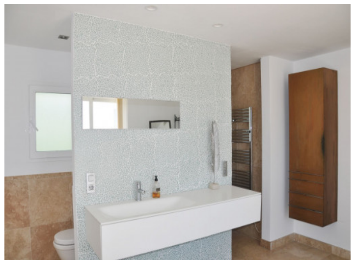
Baño moderno con ducha

Toda la información como mejor se puede saber, salvo por error durante el periodo de venta. Sirva este documento como un informe previo, las bases legales solo serán válidas a través de un contrato de compra acordado ante Notario.