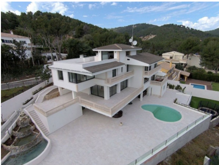
Vista de pájaro sobre la propiedad en Son Vida