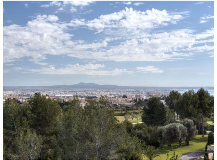
Vistas panorámicas a los alrededores y al mar