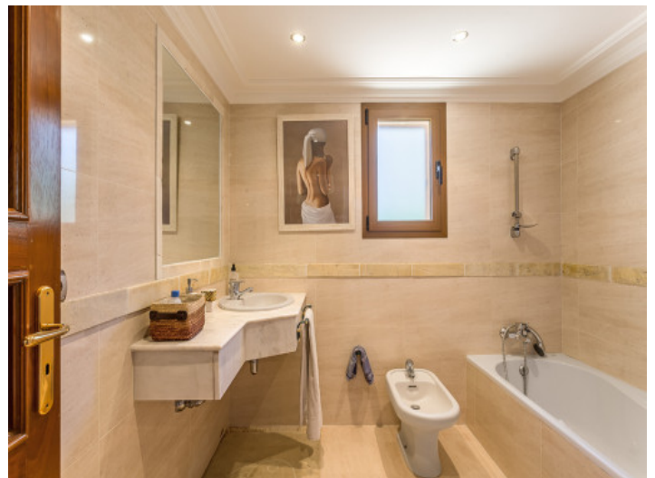
Uno de 8 baños en suite

Toda la información como mejor se puede saber, salvo por error durante el periodo de venta. Sirva este documento como un informe previo, las bases legales solo serán validas a traves de un contrato de compra acordado ante Notario.