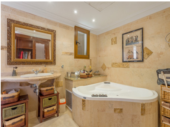
Baño principal con gran bañera de hydro masaje