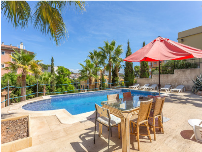
Maravillosa zona de piscina para los días de verano