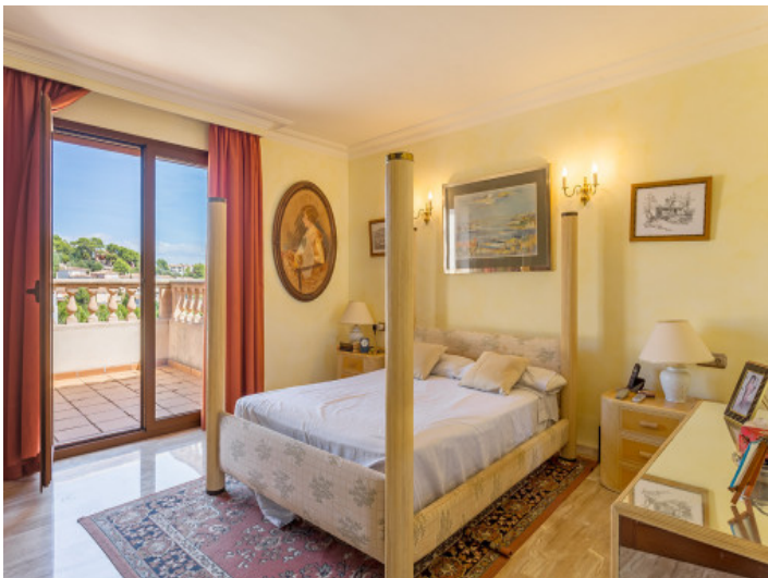
Dormitorio doble con acceso a la terraza