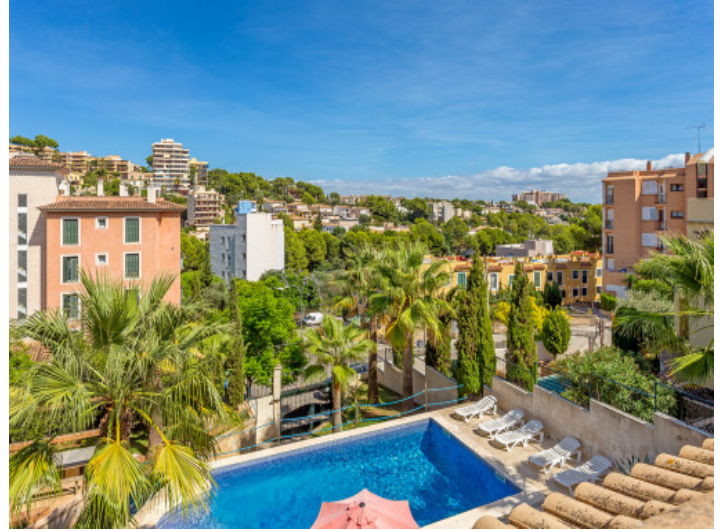
Vistas a la bonita zona de piscina