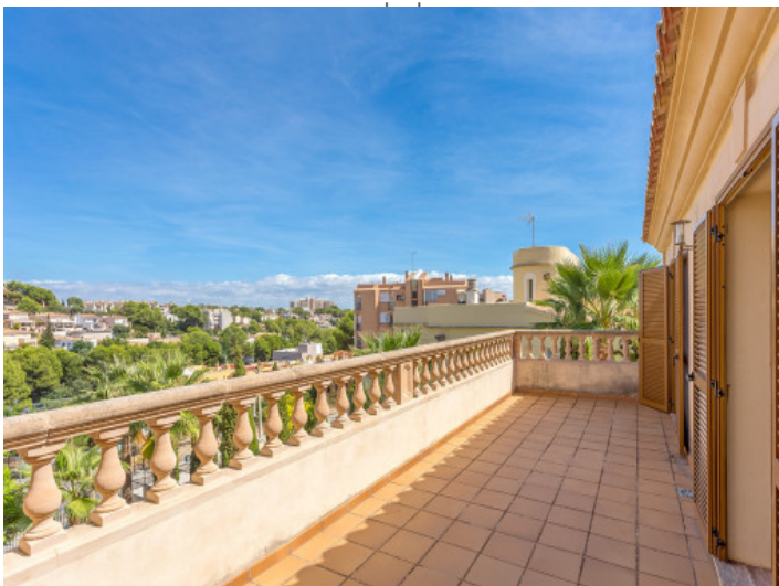
Balcón de 30 metros cuadrados con vistas hermosas