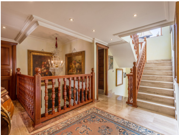
La casa impresionante tiene una superficie habitable de 668 metros