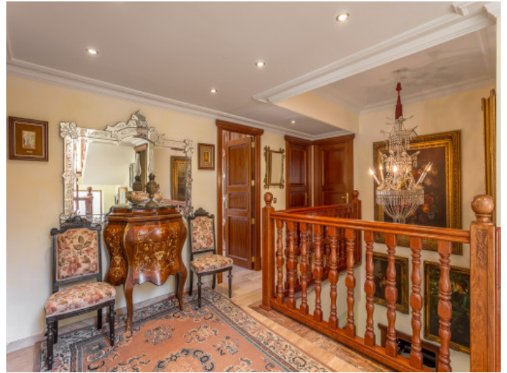
Galería abierta en la planta superior