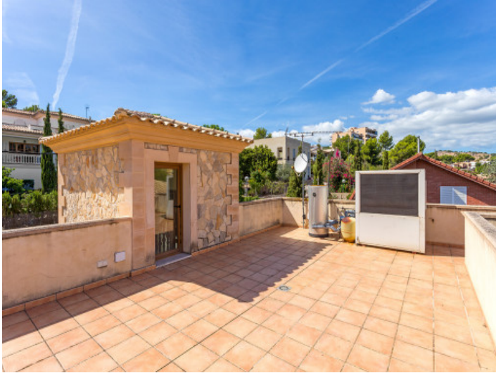
Azotea de 90 metros cuadrados