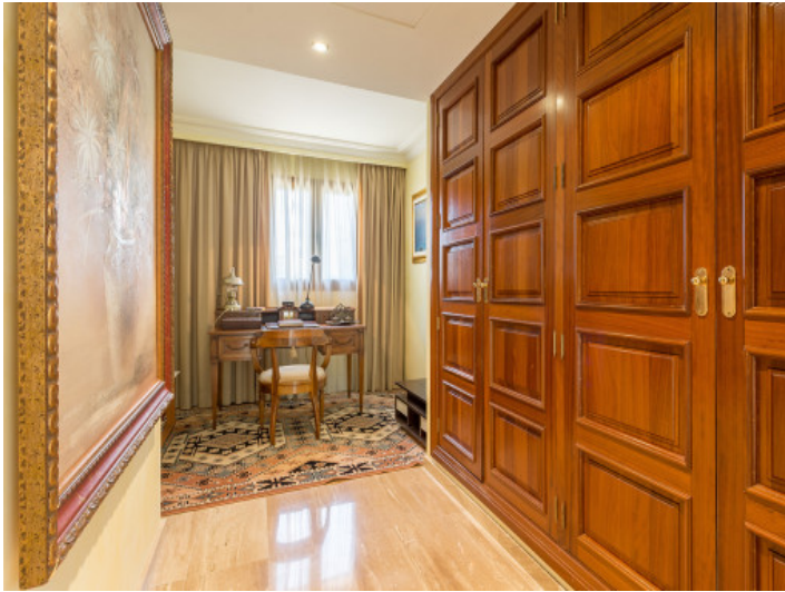
Otra oficina con amplios armarios empotrados