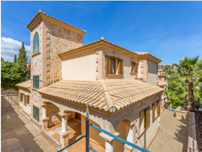
Vista exterior de la casa