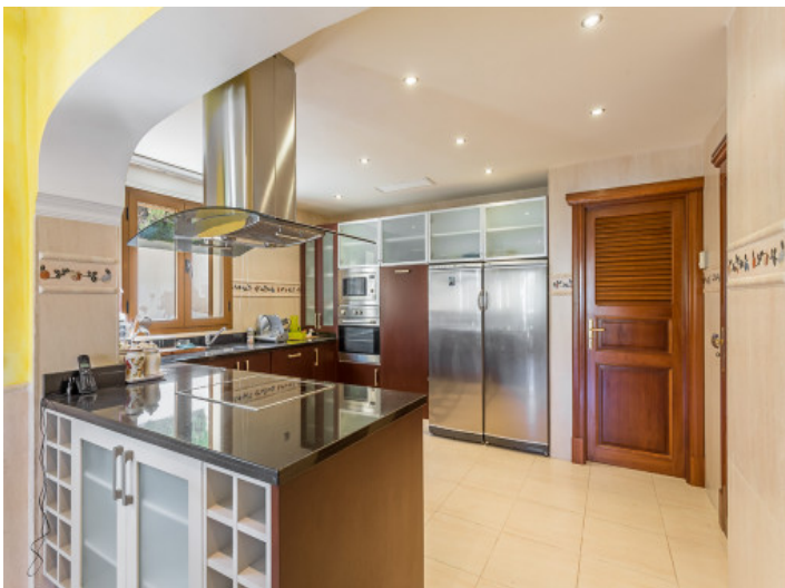
Cocina totalmente equipada con isla central