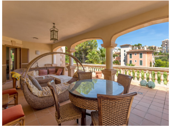
Terraza cubierta con zona de relax y comedor