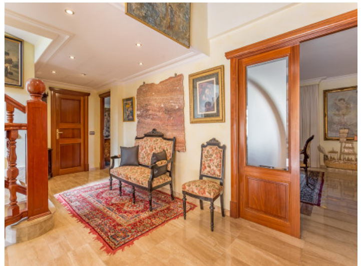
La generosa casa fue construida en el año 2004