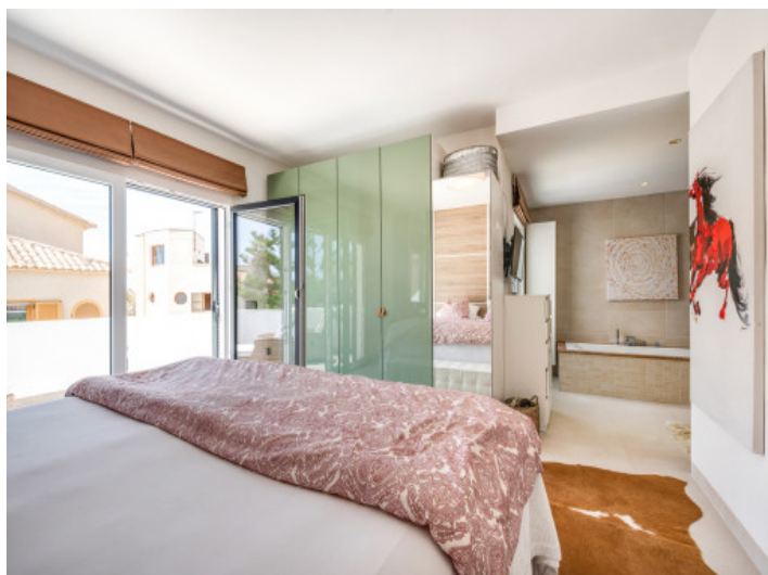
Vista al baño en suite