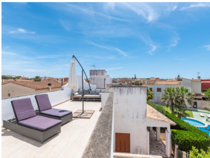
Azotea fantástica de la villa