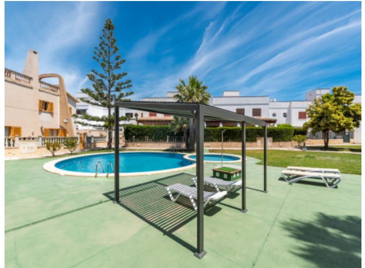
Tumbonas en la zona de la piscina