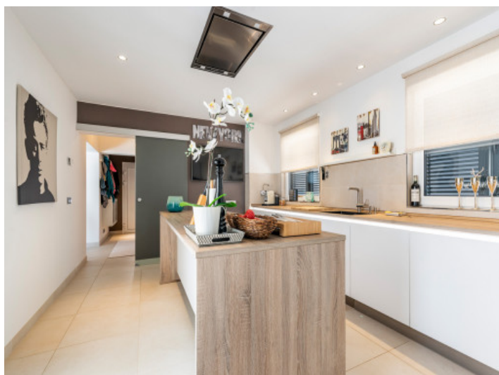
Vista alternativa a la cocina