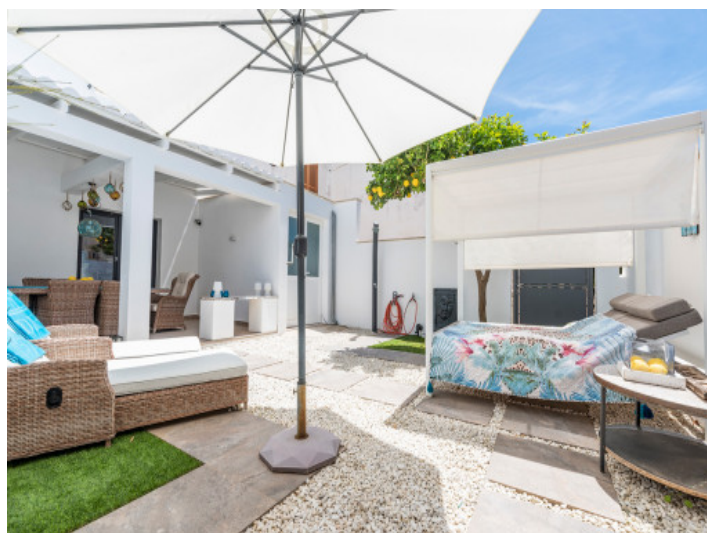
Vista al patio