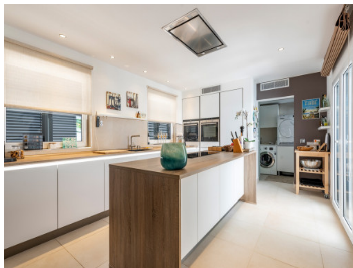
Cocina totalmente equipada