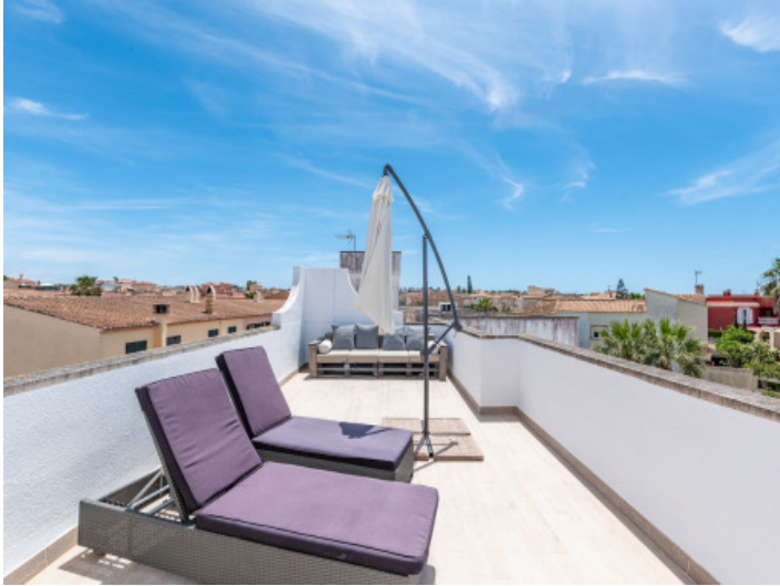
Vista a la terraza