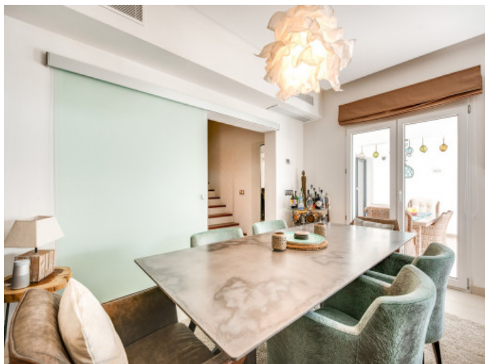
Vista alternativa al comedor