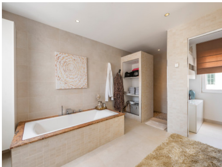
Baño en suite