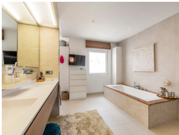
Baño con bañera