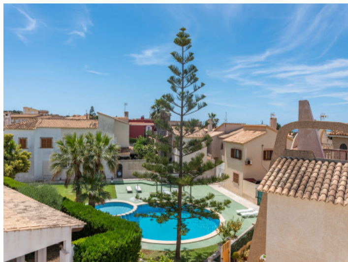
Vista a la piscina comunitaria