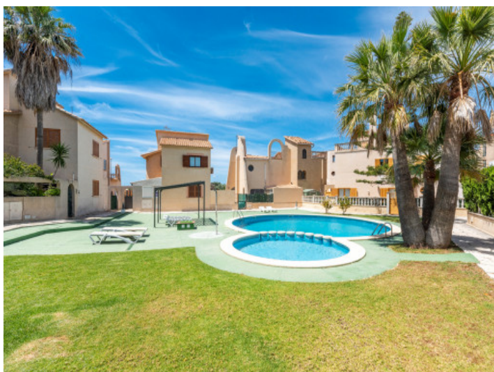
Jardín y piscina