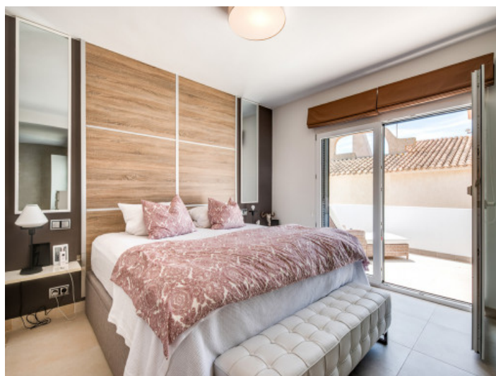
Dormitorio con balcón