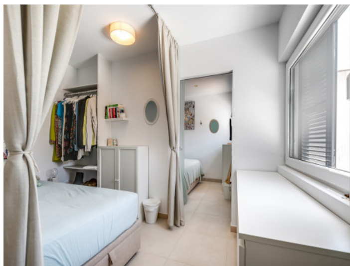
Dormitorio doble espacioso