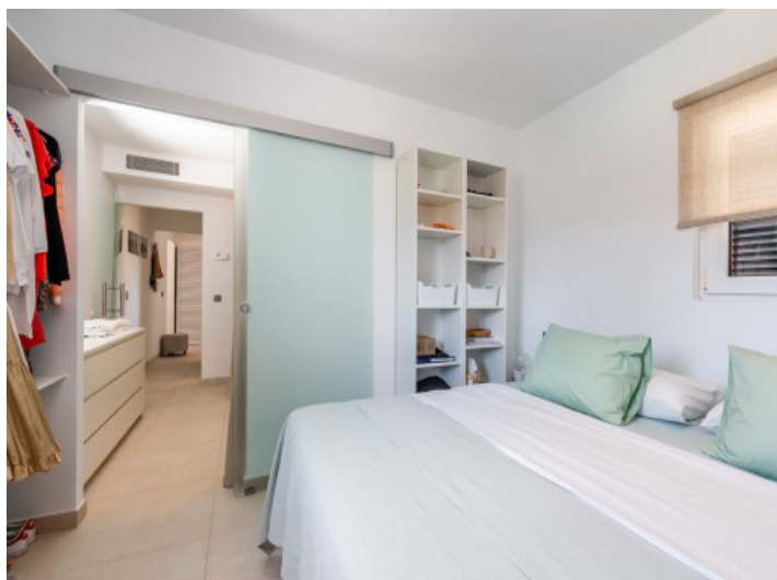
Vista alternativa al dormitorio