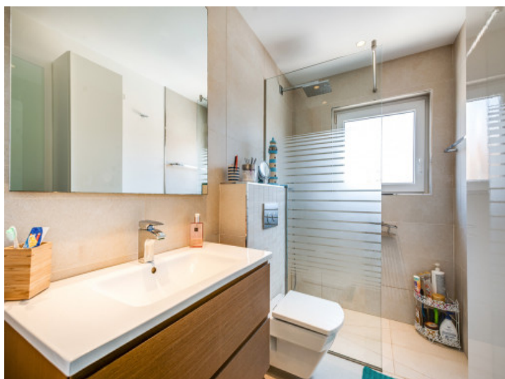
Baño inundado por luz natural con ducha