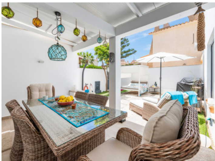
Zona de estar cubierta