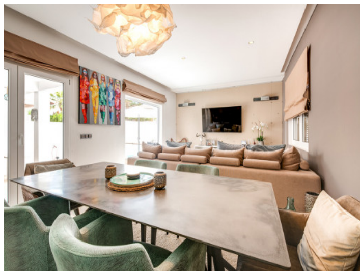
Salón y comedor abierto

Toda la información como mejor se puede saber, salvo por error durante el periodo de venta. Sirva este documento como un informe previo, las bases legales solo serán válidas a través de un contrato de compra acordado ante Notario.