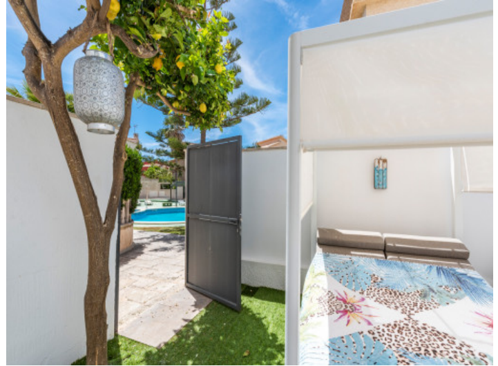
Acceso a la piscina