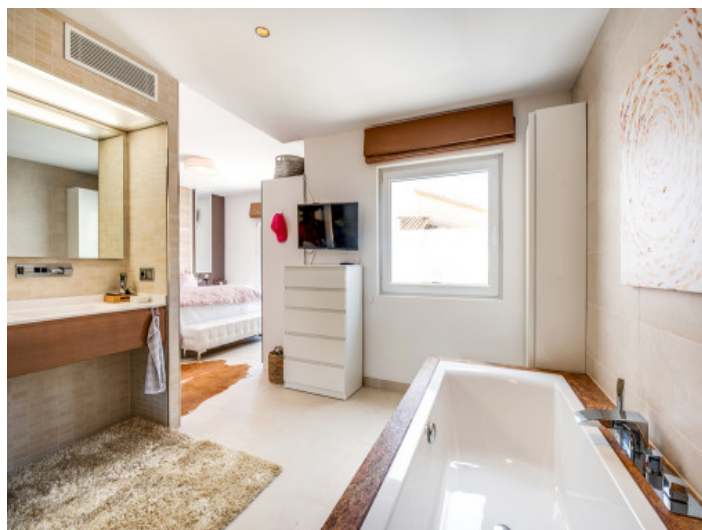
Baño en suite fantástico

Toda la información como mejor se puede saber, salvo por error durante el periodo de venta. Sirva este documento como un informe previo, las bases legales solo serán válidas a través de un contrato de compra acordado ante Notario.