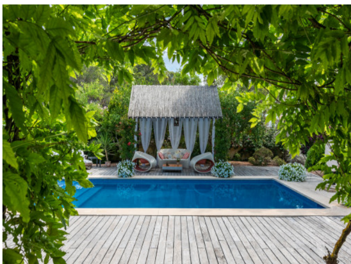
Área de piscina