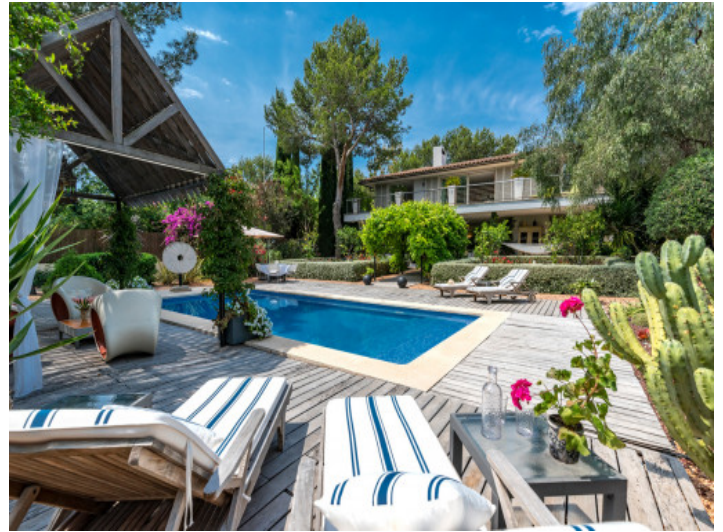
Área de piscina