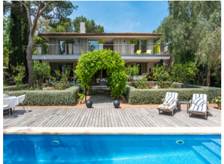
Área de piscina