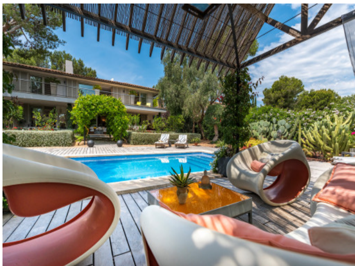
Área de piscina