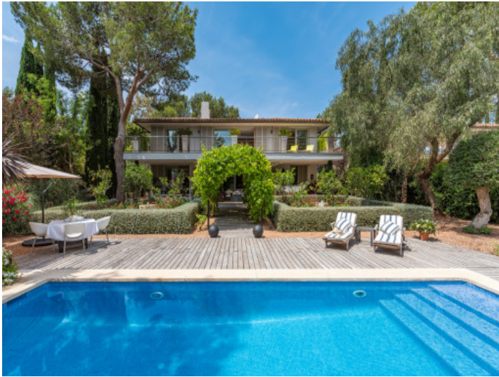
Área de piscina