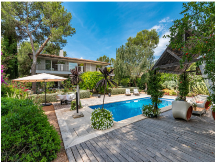
Área de piscina