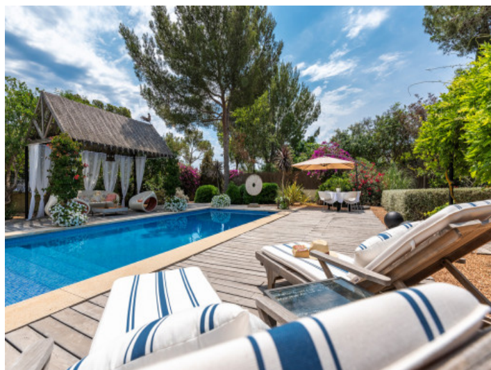
Área de piscina

Toda la información como mejor se puede saber, salvo por error durante el periodo de venta. Sirva este documento como un informe previo, las bases legales solo serán válidas a través de un contrato de compra acordado ante Notario.