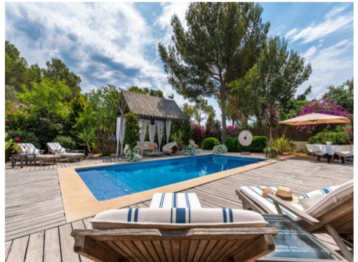
Área de piscina

Toda la información como mejor se puede saber, salvo por error durante el periodo de venta. Sirva este documento como un informe previo, las bases legales solo serán válidas a través de un contrato de compra acordado ante Notario.