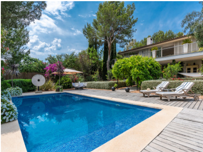
Área de piscina