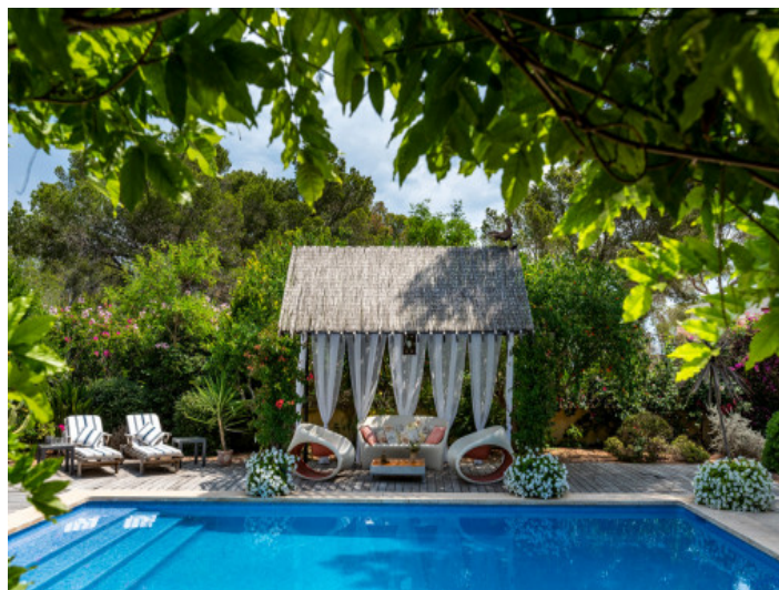
Área de piscina