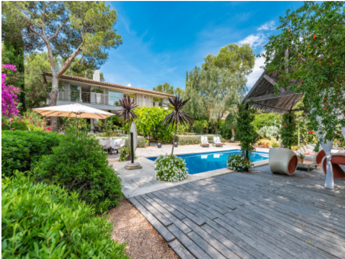
Área de piscina