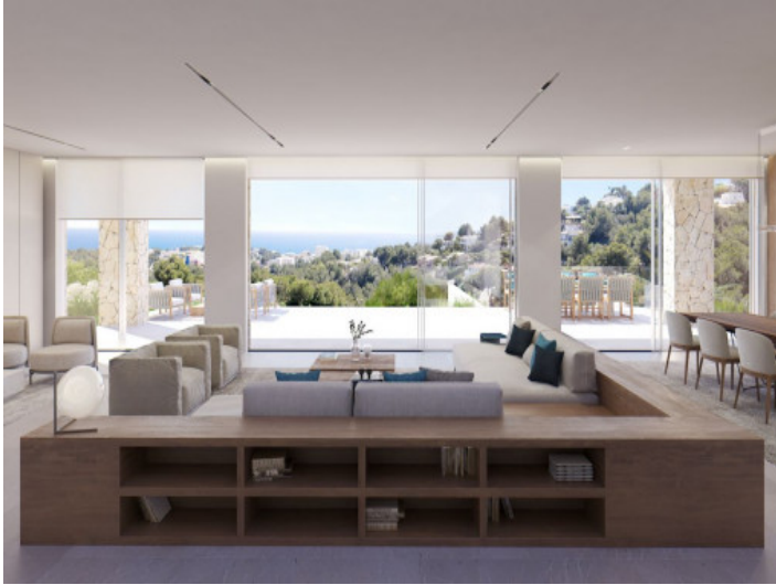
Área de estar