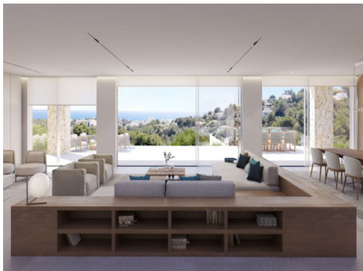
Área de estar