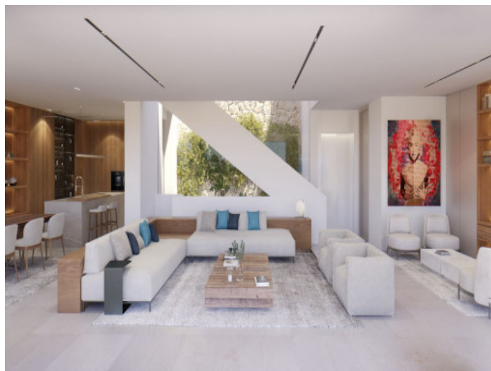
Área de estar