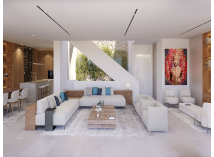
Área de estar