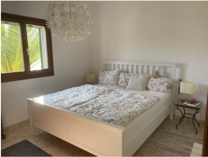
Uno de 2 dormitorios