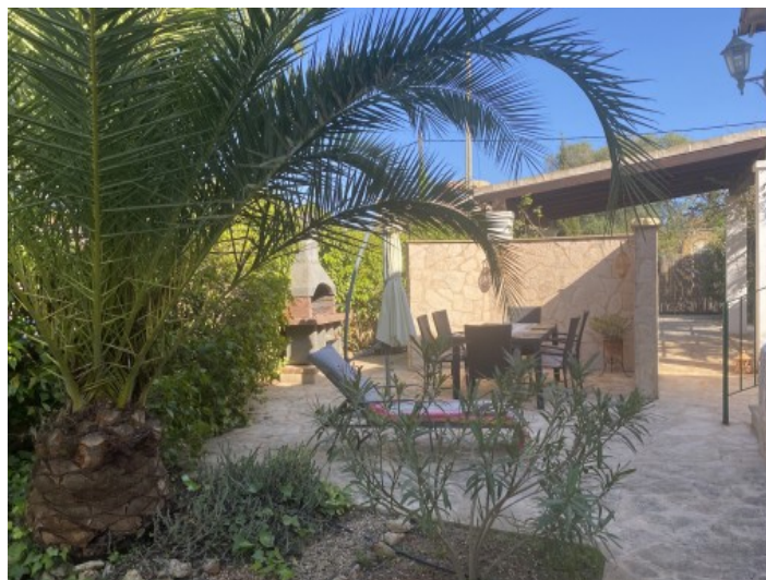
Jardín y zona de barbacoa