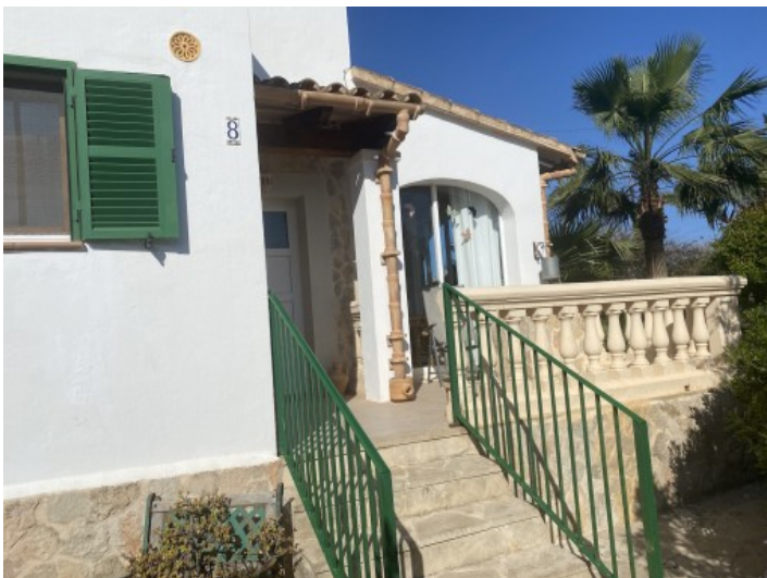
Vista exterior del chalet