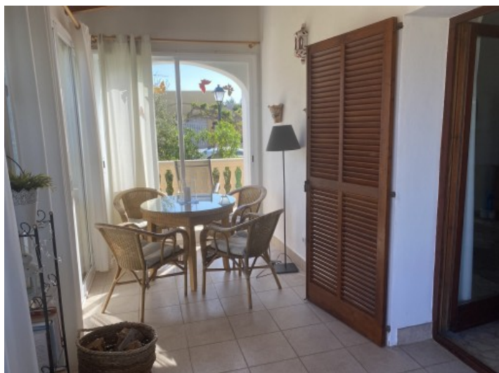
Zona de estar