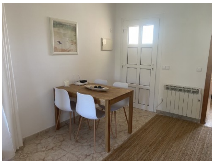
Vista al comedor