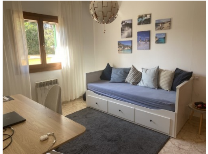
Uno de 2 dormitorios