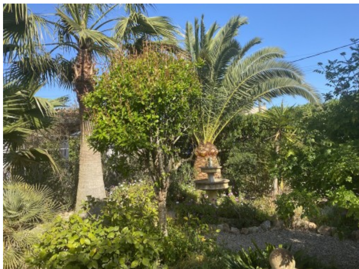
Vista al jardín idílico